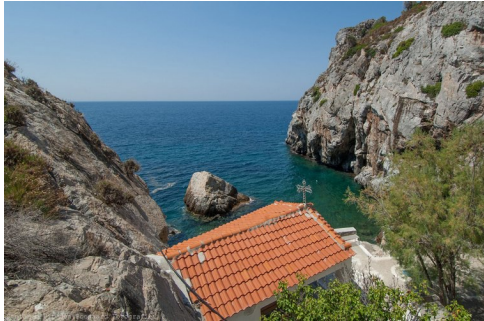
Nog een aanrader: Het verborgen kerkje van Panagia Krifti nabij Melínda.

Kasteel van Mitilíni, een van de grootste vestingwerken Zomerconcert in het kasteel Paleókastro bij Vrísá, een oude vesting van de familie Gattelusi