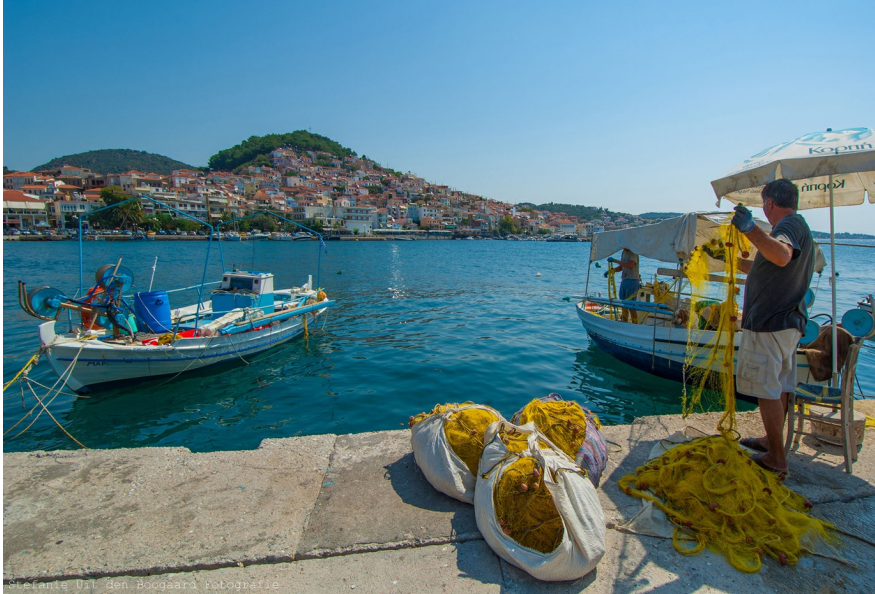
Een visser prepareert zijn netten, op de achtergrond Plomári.

Het eiland Lésbos (Grieks: Λέσβος) ligt in de Egeïsche Zee, niet ver van de kust van Turkije en Klein-Azië. Met 1630 km 2 is het een van de grootste eilanden van Griekenland. Het eiland telt ruim 85.000 inwoners, van wie circa een derde in de hoofdstad Mitilíni woont. Bestuurlijk is het eiland een gemeente (dímos) en een regionale eenheid (periferiaki enótita) binnen de regio (periféria) Noord-Egeïsche Eilanden.