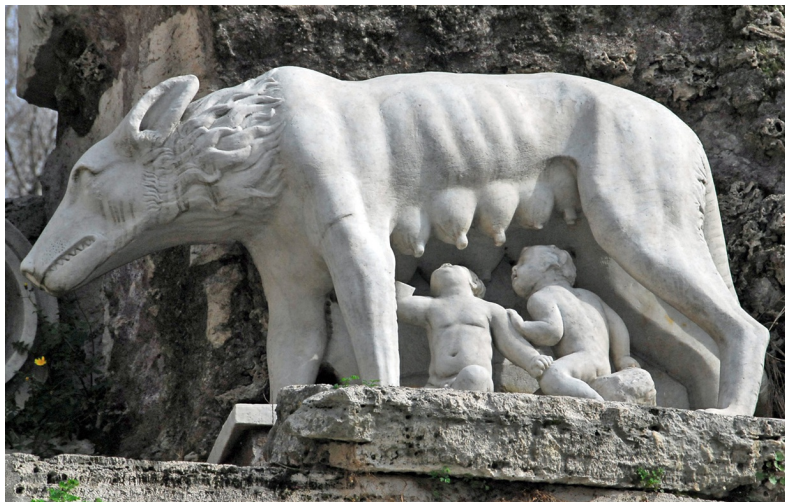
Beeld van Romulus en Remus; stichters van Rome.

Volgens de legende is Rome in 753 v. Chr. gesticht door de broers Romulus en Remus. In werkelijkheid waren sommige heuvels in de 10de eeuw v. Chr. al bewoond. Voordat het tijdperk van het Romeinse Rijk zich aandient, maakt Rome deel uit van het Etruskische koninkrijk. In 509 v. Chr. kwamen de Romeinen in opstand tegen de overheersing van de Etrusken, wat uiteindelijk resulteerde in de onafhankelijkheid van Rome. Hierop werd de Romeinse Republiek uitgeroepen, welke werd geleid door twee machtshebbers, twee consuls. In deze periode groeide het Romeinse Rijk tot haar grootste omvang, van Engeland tot Marokko en Iran, met Rome als hoofdstad.