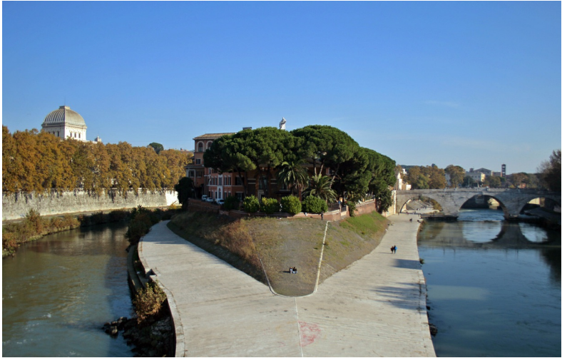
Het Tibereiland, links torent de synagoge boven de bomenrij uit.

Deze gids is bedoeld om binnen korte tijd zoveel mogelijk van Rome te kunnen zien. Het is een complete gids waarin zowel de gebaande paden als de minder toeristische plekken worden behandeld. Als aanvulling op deze reisgids is het aan te raden een plattegrond van de stad mee te nemen tijdens de wandeling. Deze is gratis verkrijgbaar op de luchthaven, de meeste hotels of de toerismekantoren. Je kunt er ook voor kiezen een gratis Rome map app te downloaden op je smartphone of tablet. De verschillende routes in deze gids overlappen elkaar niet, maar kunnen gemakkelijk worden gecombineerd. Iedere route bestrijkt een ander gedeelte van de stad en zo hebben de meeste routes een ander beginpunt. Naast het bewandelen van de routes kun je deze ook afleggen per fiets.