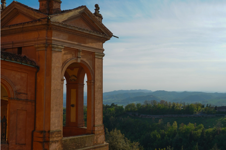
Uitzicht over de heuvels van de Apennijnen vanaf de basiliek van San Luca

De oorsprong van de route die tegenwoordig bekendstaat als de Godenweg en dwars door de Apennijnen loopt, gaat terug tot de 7de eeuw v. Chr. Een groot deel van het Italiaanse schiereiland was in handen van de Etrusken. Deze bevolkingsgroep vormde de eerste grote beschaving in het gebied tussen de rivieren de Arno en de Tiber (het huidige Toscane en delen van Umbrië en Lazio). Vooral tussen de 7de en 5de eeuw v. Chr. waren de Etrusken een van de hoogst ontwikkelde volken van de Oudheid.