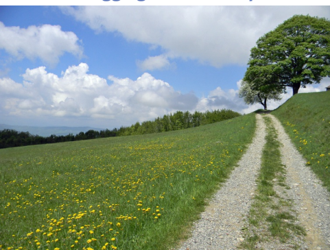
Onderweg op de Godenweg

Deze goddelijke bergen en dorpen bevinden zich in het noordelijke deel van de Apennijnen, de bergketen die zich over een lengte van 1350 kilometer over het hele Italiaanse schiereiland uitstrekt. De Apennijnen vormen zo de ruggengraat van het land. En zijn een ideaal bergwandelgebied. In vergelijking met andere berggebieden zijn de Apennijnen – zeker het relatief lage deel waar de Godenweg loopt – minder hoog en alle toppen zijn voor wandelaars te beklimmen. Veel gebieden in de Apennijnen zijn (nog) niet ontdekt door toeristen en zijn daardoor rustig en ruig.