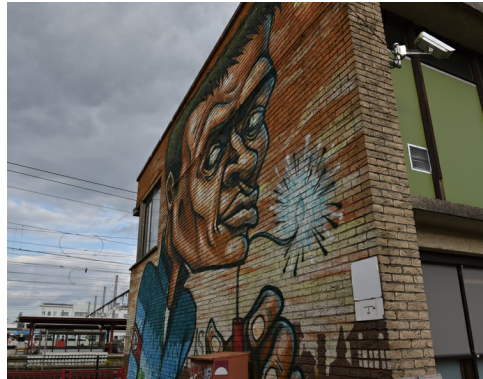
Street art, Hasselt