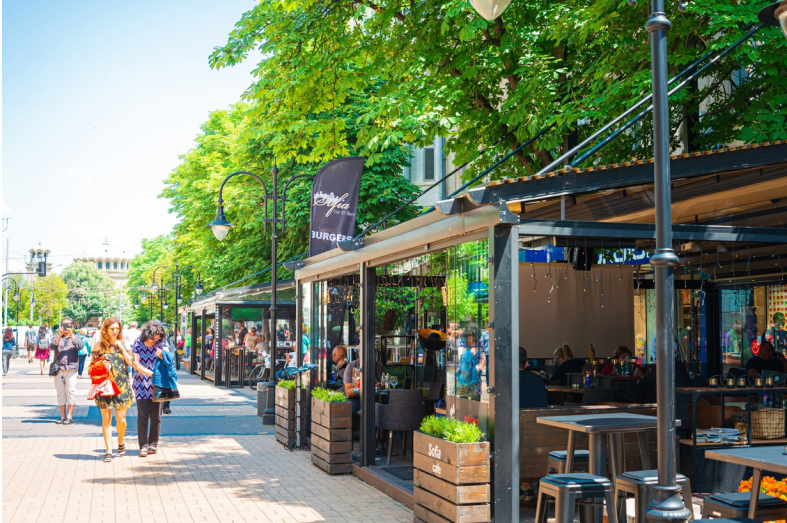
De Vitosha boulevard is de belangrijkste straat van Sofia.

Sofia is de hoofdstad en tevens grootste stad van Bulgarije. Sofia telt ruim 1,2 miljoen inwoners, bijna een vijfde van de 7,1 miljoen inwoners die in Bulgarije wonen. Officieus zouden het er zelfs bijna twee miljoen zijn. De meeste hoofdstedelingen wonen in de grote betonnen buitenwijken, waar voor toeristen niet veel te vinden is, behalve als je geïnteresseerd bent in dit soort communistische architectuur. Het centrum van Sofia is klein en goed te bewandelen. Musea, winkels, parken, restaurants en cafés: in het centrum van Sofia zit het naast elkaar. Het maakt de Bulgaarse hoofdstad tot een interessante en comfortabele bestemming.