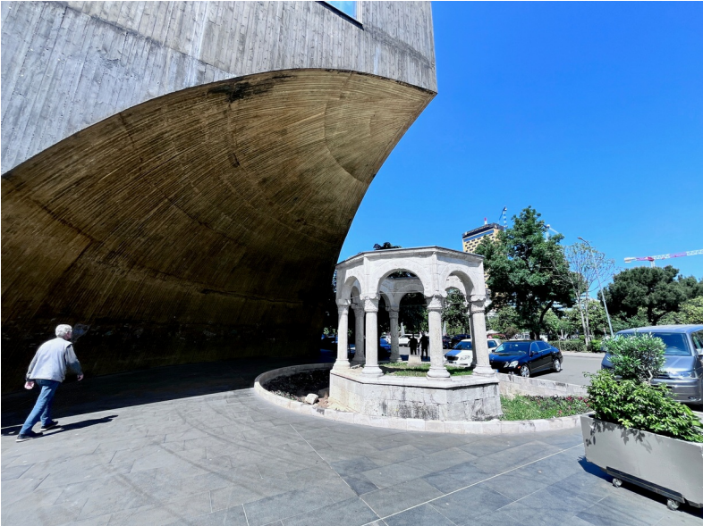
Turbe Kapllan Pasha onder de nieuwe TID-toren

Tussen Cultuurpaleis, de straten Rr. Barikadave/Rr. George W. Bush en de Lana rivier ligt een hybride centrumgebied met een mix van Ottomaanse Italiaanse, Sovjet en Albanese invloeden, na 1991 aangevuld met moderne hoogbouw, waar winkelcentra, hotels en kantoren in gevestigd zijn. De belangrijkste bezienswaardigheden zijn twee musea: het moderne museum-huis van schrijver Kadare en de tentoonstelling over het communistische regime Bunk'Art2. Het gebied telt twee populaire drukke uitgaansgebieden: het voetgangersgebied in de Sh. Murat Toptani en Kalaja in het Fort van Tirana.