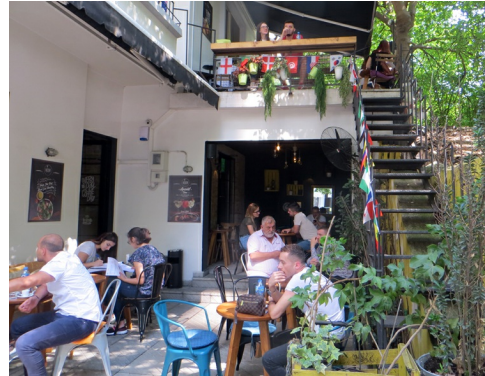
Cafe Noor in Italiaanse villa