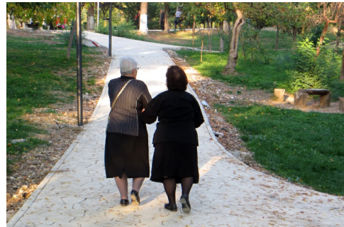
Wandelen in het Grote Park