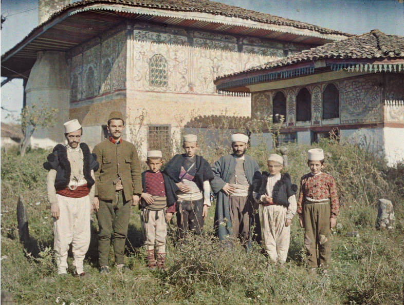
Muslims staand voor de Sulejman Pashamoskee, 1913