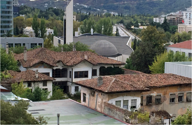
Achter een muur verborgen liggen de verwaarloosde Ottomaanse huizen van de families Toptani en Libohova

Tirana, de jonge hoofdstad van Albanië, verrast de bezoeker in veel opzichten. In het begin van de 20ste eeuw was Tirana een levendig marktstadje in een verre provincie van het Ottomaanse rijk. Je verwacht dan dat de stad na honderd jaar een gerestaureerd oriëntaals centrum heeft, met een bazaar, winkeltjes, moskeeën. Dat is niet zo. Die oude wijk is afgebroken.