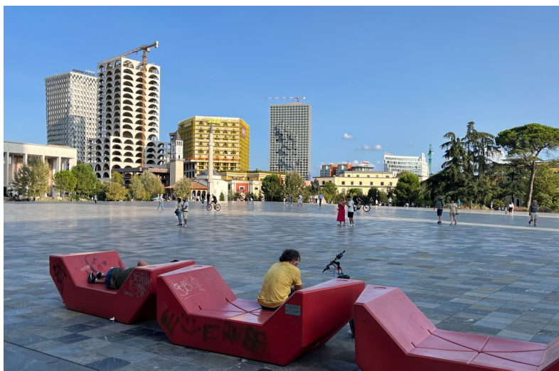
Skanderbegplein in 2025 met op de achtergrond de Et'hem Beymoskee en de Ottomaanse Klokkentoren

Het centrum van Tirana is niet groot, zeer overzichtelijk en goed te belopen. Het bestaat uit het Skanderbegplein, twee kaarsrechte boulevards die vanaf het plein naar het noorden (Zog I) en zuiden (Dëshmorët e Kombit) lopen en twee wijken ten oosten (de oude Ottomaanse stad) en ten westen (de stadsuitbreiding van de jaren 1920 en 1930) van het plein. In het zuiden ligt de nieuwe stad zoals die na de Tweede Wereldoorlog gegroeid is, inclusief het grote park en het kunstmatige meer.