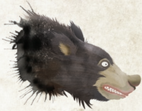
Lippenbeer (Melursus ursinus)