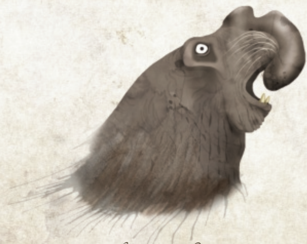
Zeeolifant (Elephantis mari)