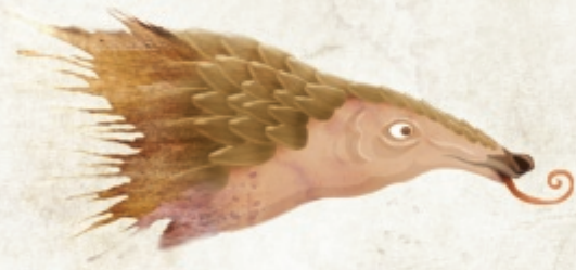
Miereneter (Manis pentadactyla)