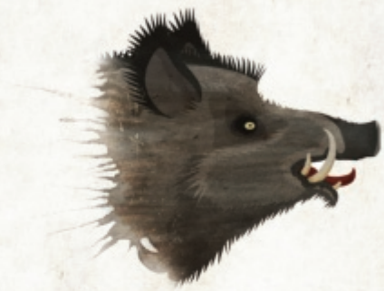
Wild zwijn (Sus scrofa scrofa)