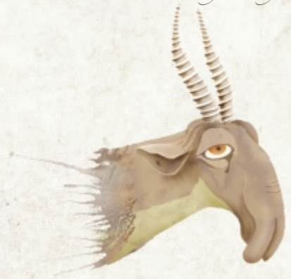
Saiga-antilope (Saiga tatarica)