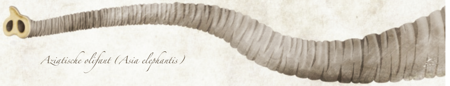
Aziatische olifant (Asia elephantis)