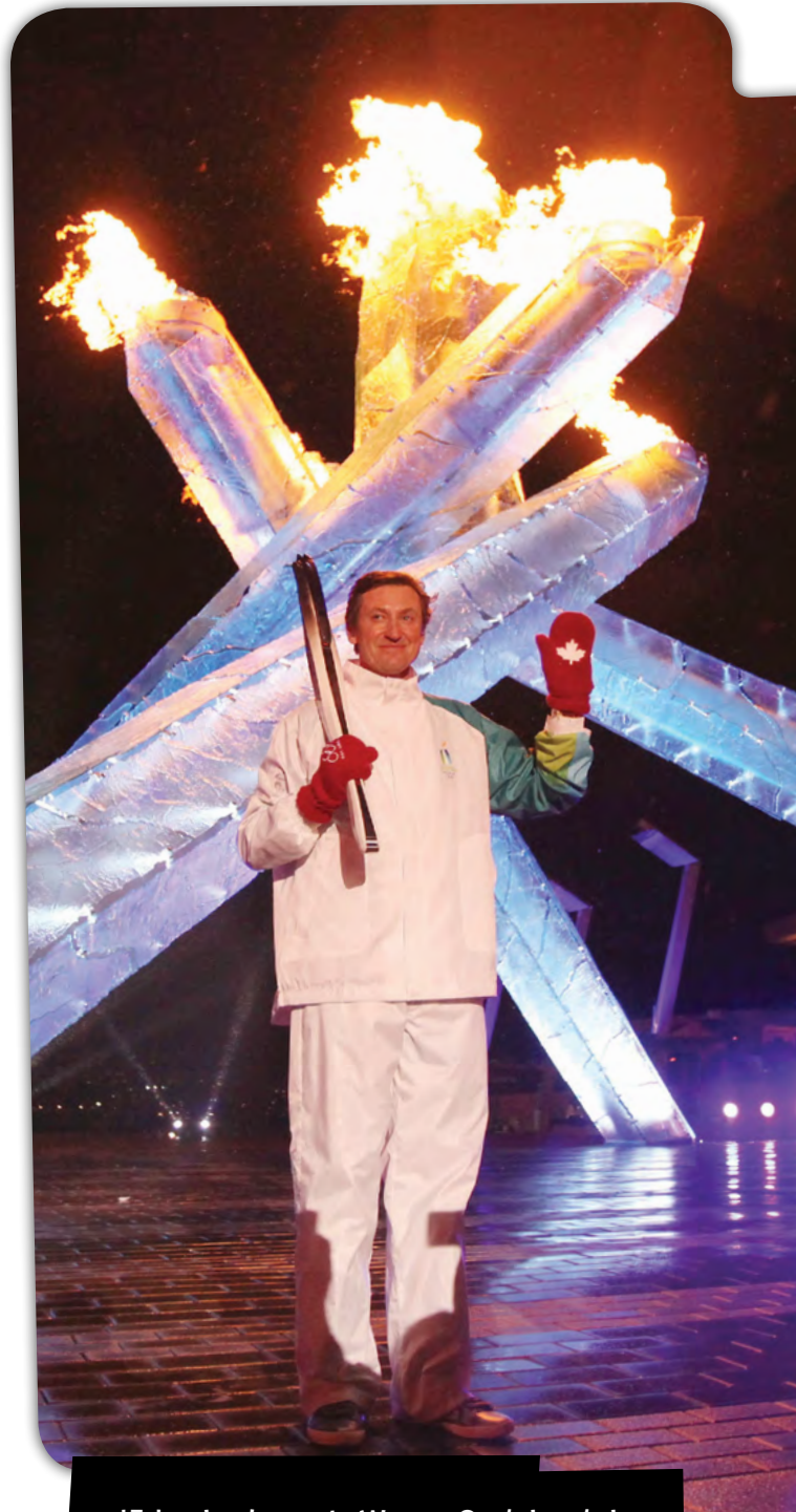
IJshockeylegende Wayne Gretzky stak de olympische vlam aan tijdens de openingsceremonie in 2010.

Sinds de Spelen van 1976 in Innsbruck (Oostenrijk) horen er mascottes bij de Olympische Winterspelen. De Oostenrijkse mascotte was een sneeuwman met een traditionele Oostenrijkse hoed. De officiële mascotte is vaak een dier uit het gastland. Bij Spelen minder lang geleden, zoals in Vancouver in 2010, symboliseerden meerdere mascottes verschillende kenmerken van de Spelen of het gastland.