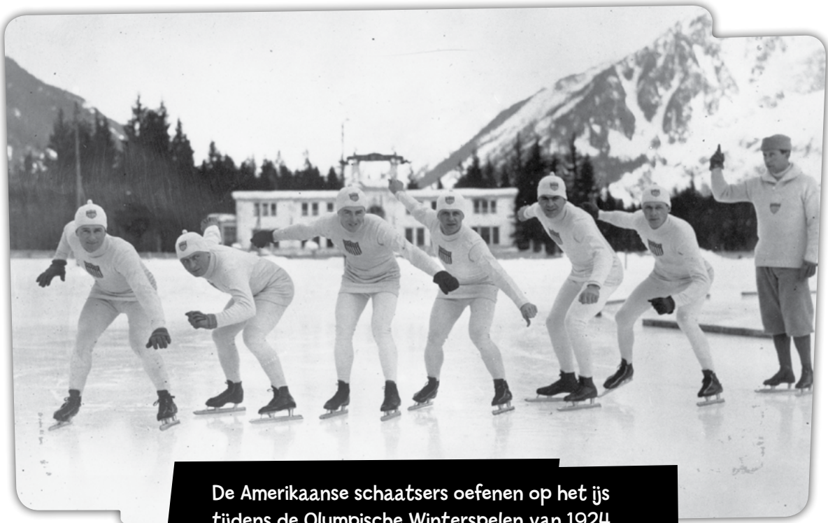
De Amerikaanse schaatsers oefenen op het ijs tijdens de Olympische Winterspelen van 1924.

Na de Eerste Wereldoorlog (1914-1918) werd het idee opnieuw besproken, en in 1924 organiseerde het IOC een 'wintersportweek' in Chamonix (Frankrijk). Meer dan 10.000 toeschouwers maakten het evenement tot een groot succes. Noorwegen en Zweden stonden bovenaan in de medaillespiegel , maar Canada won de ijshockeycompetitie. De Olympische Winterspelen waren niet meer weg te denken.