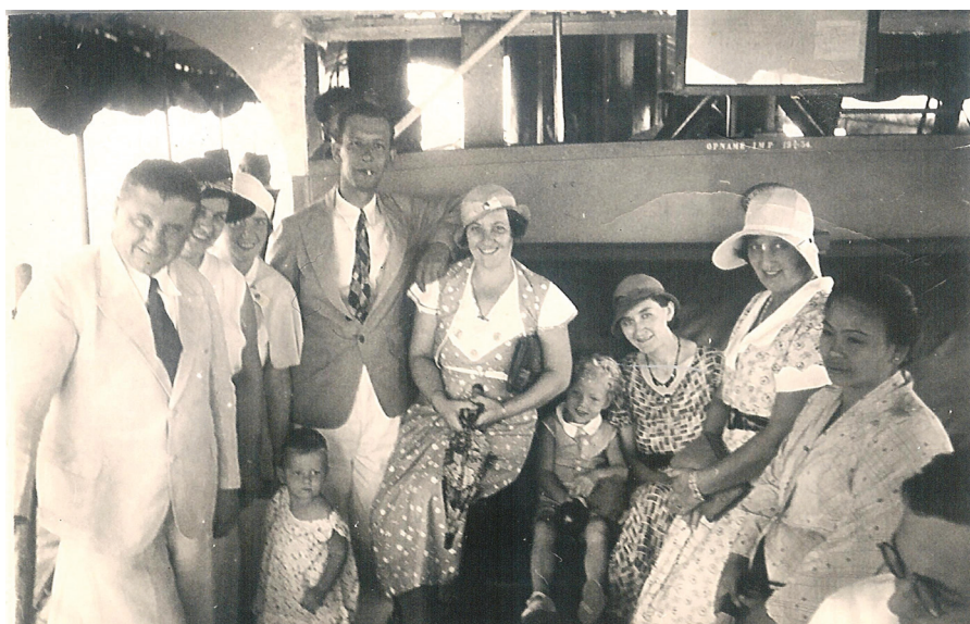
1934 Op een boot op de rivier de Moessi

Een kind dat zoekraakt op een mailschip betekent veel ongerustheid voor bemanning en ouders. Het kinderdek, een soort beveiligde crèche met juf, wisten we steeds te ontvluchten. Ik denk dat ik genoeg had van het kleuterschool-idee. De streken die we uithaalden waren legio, vreselijk! Mijn moeder heeft me ervan verteld en ik geloof dat ze er zelfs later nog niet om kon lachen. Het resultaat was dat ik gelukkig nooit meer naar een kleuterschool ben gestuurd.