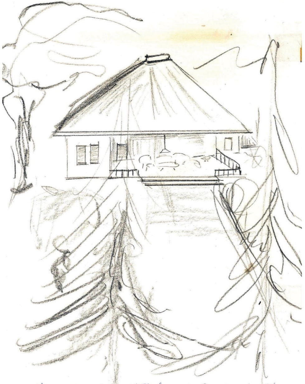
zo ongeveer zag het huis in Ambon er uit.

Achter in de tuin had mijn vader een aantal orchideeën, ze hingen aan een soort rek. Het was de trots van de tuinman en van hem. Samen stonden ze de bloeiende orchideeën te bewonderen, ja, bijna te strelen.