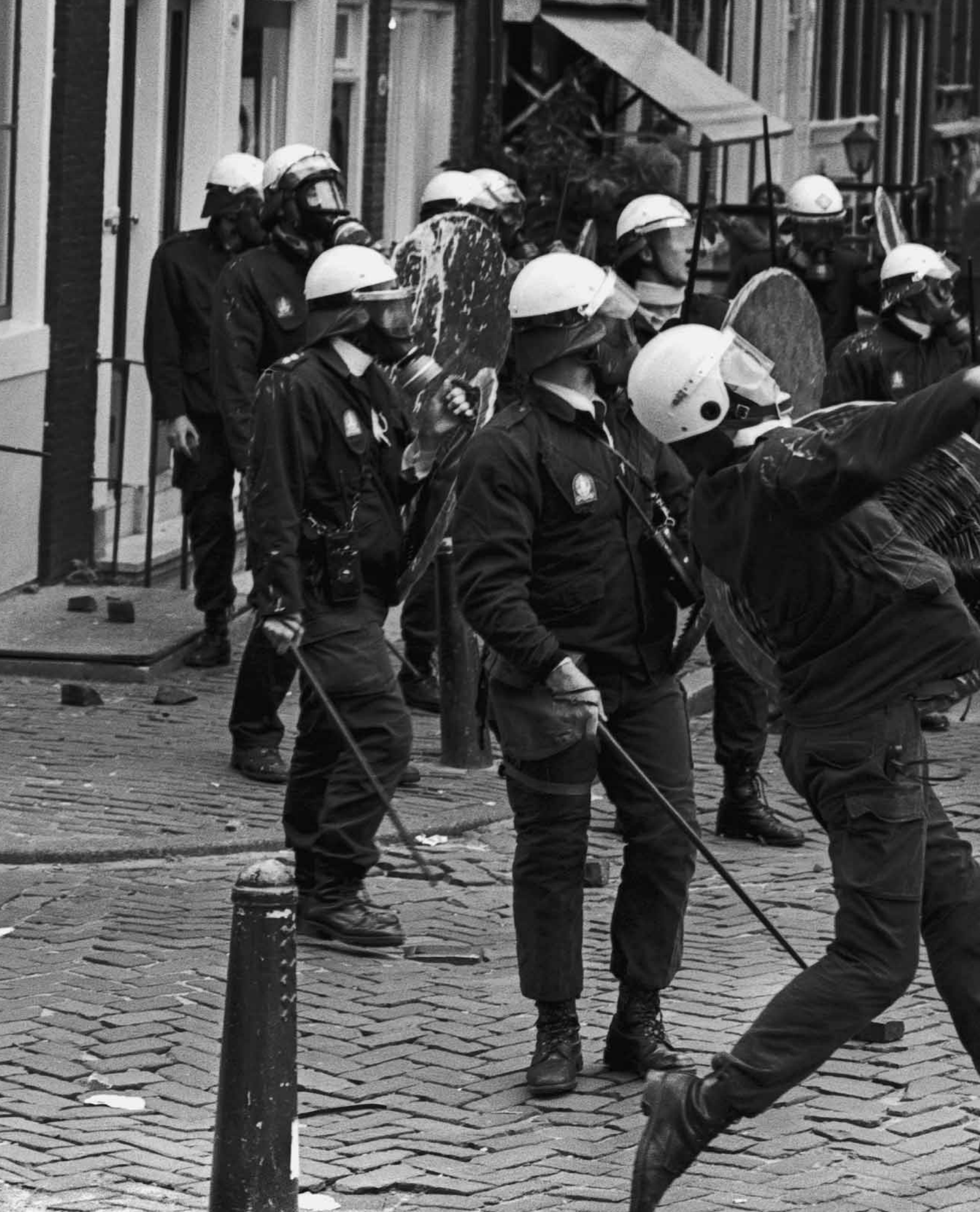
3_juli_1980 Vechten om het kraakpand de Vogelstruys aan het Singel.