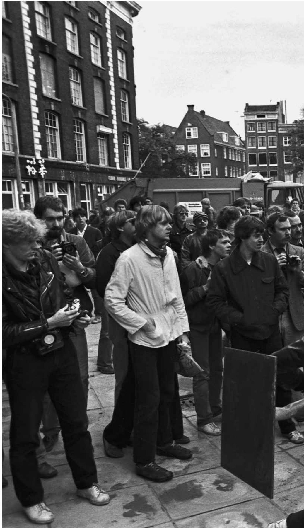
10_oktober_1980 Metrostation Nieuwmarkt na de officiële opening.