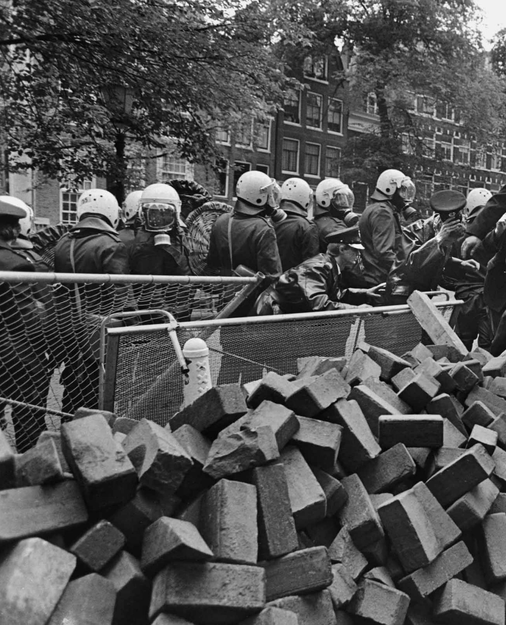
11_juni_1981 Ontruiming gekraakt pand aan de Groenburgwal.