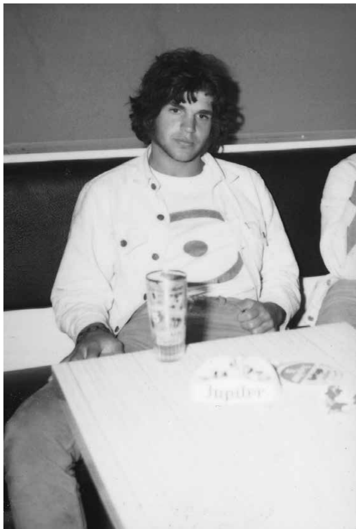
Achttien jaar en bij de tijd in de disco