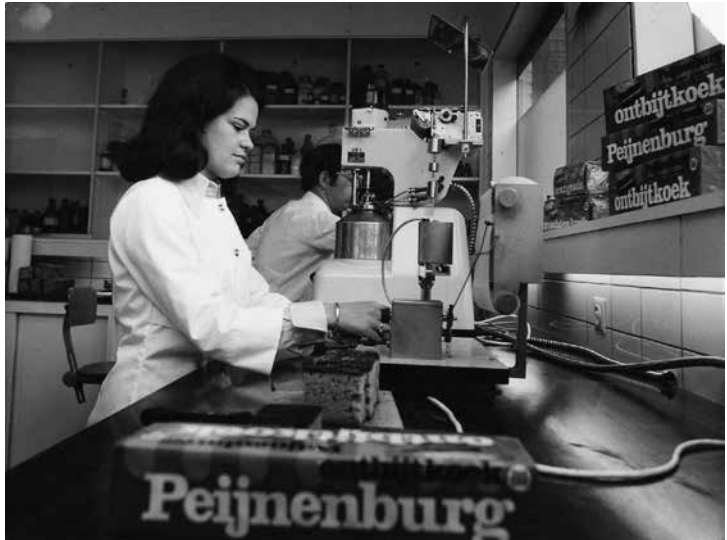
Peijnenburg koekfabriek: 'Wat je ruikt, is de beroemde Peijnenburgs koek...'