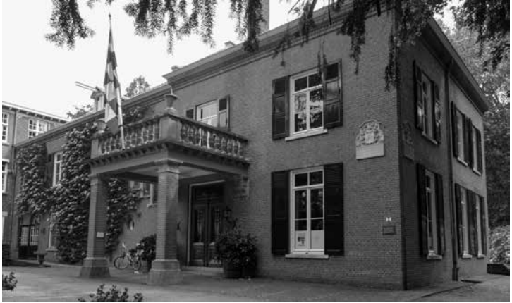
Kasteel Geldrop, na een lange geschiedenis centrum van velerlei activiteiten