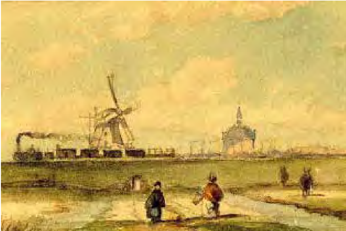
2.2 Andreas Schelfhout Een stoomtrein op de spoordijk bij Leiden, ca. 1845 Penseel met waterverf, 102 x 70 mm Utrecht, Spoorwegmuseum, inv.nr. 9801