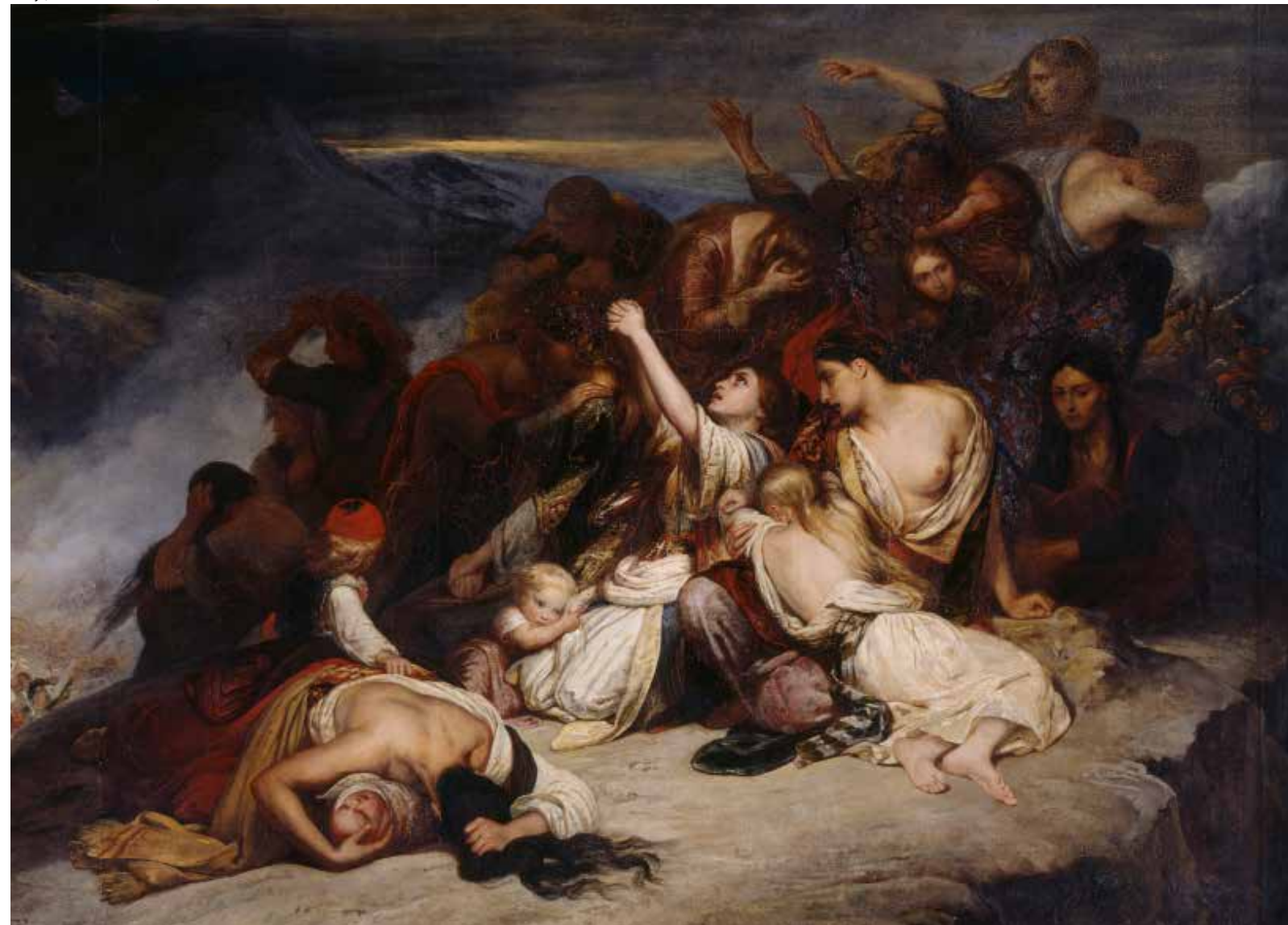
2.31 Ary Scheffer, cDe vrouwen van Souli , ca. 1827 Olieverf op doek, 261,5 x 359,5 cm Parijs, Musée du Louvre, inv.nr. INV7857