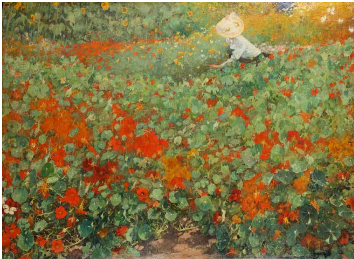
4.85 Jacobus van Looy, De tuin , ca. 1893 Olieverf op doek, 93 x 137 cm Haarlem, Teylers Museum, inv.nr. KS 2013 001; aangekocht met steun van de BankGiro Loterij, Stichting Roodenburg van Looy en Teylers Museum Fonds (legaat Boting) in 2013