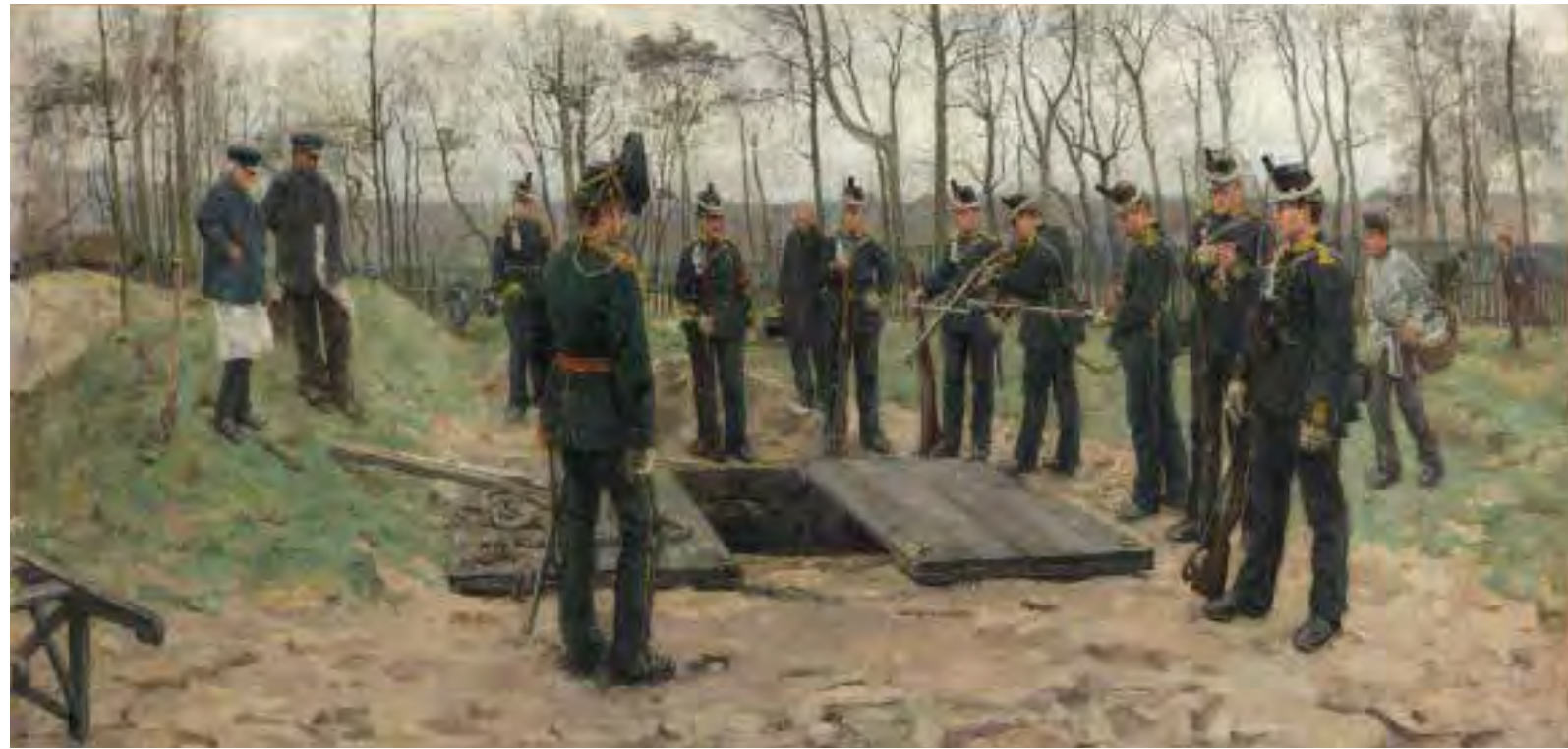
4.24 Isaac Israëls, De begrafenis van de Jager , 1882 Olieverf op doek, 125 x 261 cm Den Haag, Kunstmuseum Den Haag, inv.nr. 0332012