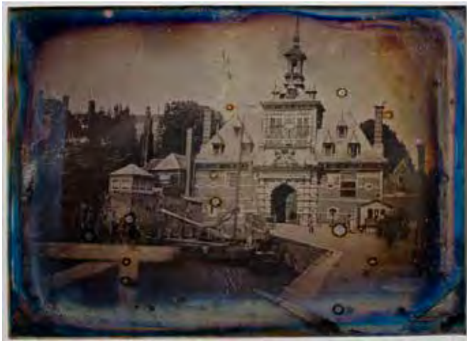
2.1 Dr. Schneider (plaat) Gezicht op de Ooster Oudehoofdpoort te Rotterdam, 1841–1845 Daguerreotypie, verzilverd, 120 x 165 mm Rotterdam, Museum Rotterdam, inv.nr. 20078