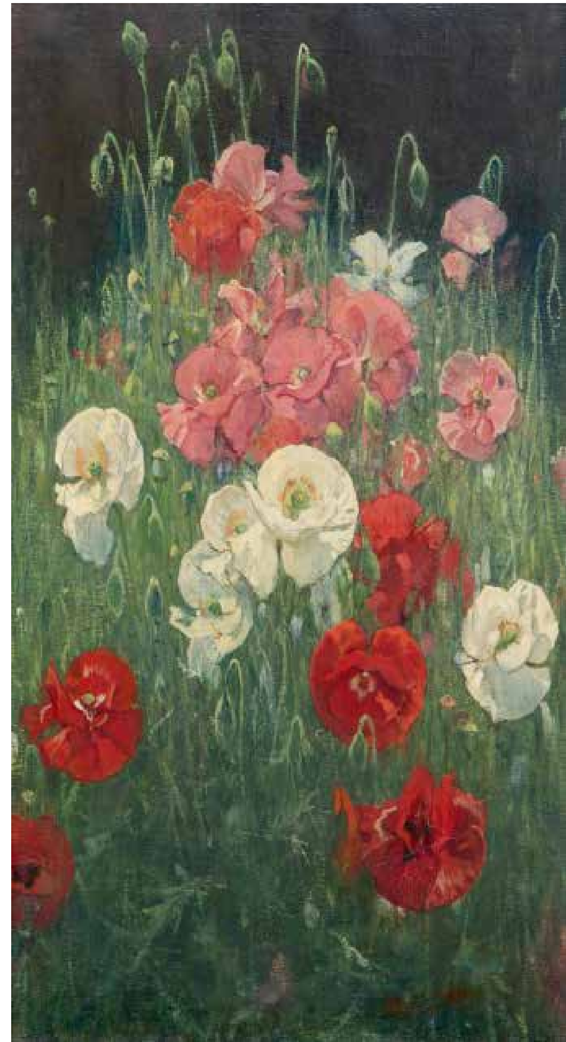
4.87 Jacobus van Looy, Papaverveld , 1919 Olieverf op doek, 92 x 50 cm Haarlem, Frans Hals Museum, inv.nr. vL 49-352; geschonken door Stichting Jacobus van Looy