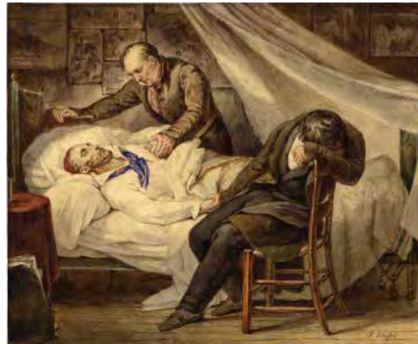
2.29 Ary Scheffer, Sterfbed van Théodore Géricault , 1824 Olieverf op doek, 36 x 46 cm Dordrecht, Dordrechts Museum, inv.nr. S/T2

Behalve de replica’s van eigen werk die hij in opdracht maakte, was hij ook een van de meest gereproduceerde kunstenaar van zijn tijd. 63 Toch kwam er een kentering: in de Salon van 1846 had Scheffer zeven schilderijen geëxposeerd die door de oudere critici zoals altijd werden omarmd, maar waar de jongeren nu afstand van namen. Van hen was Charles Baudelaire het onbarmhartigst: hij schreef een artikel met de titel ‘De M. Ary Scheffer et les singses du sentiment’ – Over Mijnheer Scheffer en de apen van