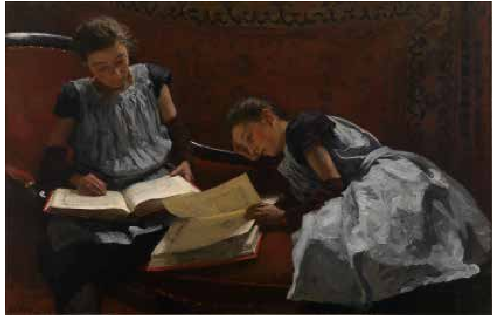
4.77 Willem Bastiaan Tholen, De gezusters , 1893 Olieverf op doek, 36,5 x 57 cm Gouda, Museum Gouda, inv.nr. 55498