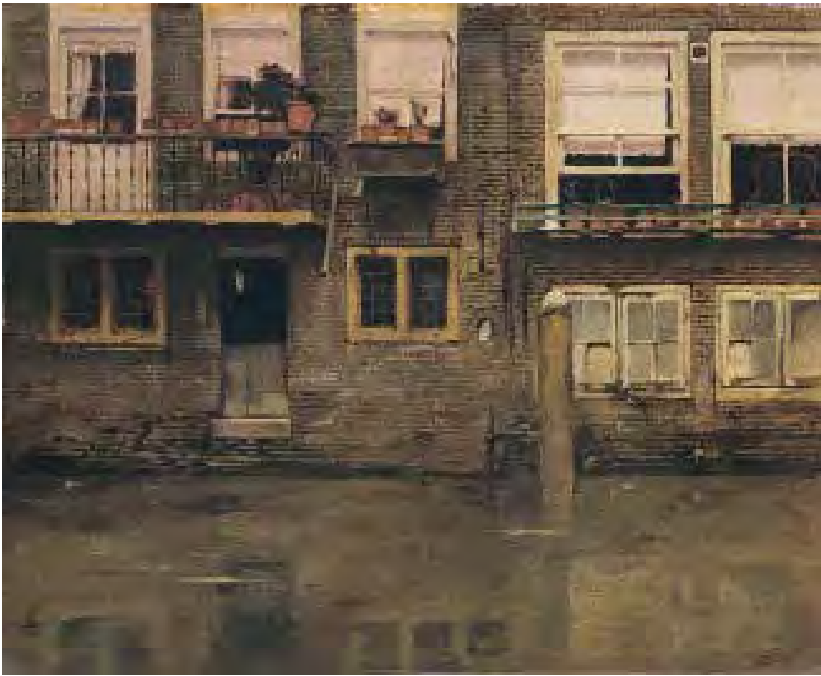
4.75 Willem Witsen De Voorstraathaven in Dordrecht , 1898 Olieverf op doek, 44,5 x 54,3 cm Dordrecht, Dordrechts Museum, inv.nr. DM-976-506