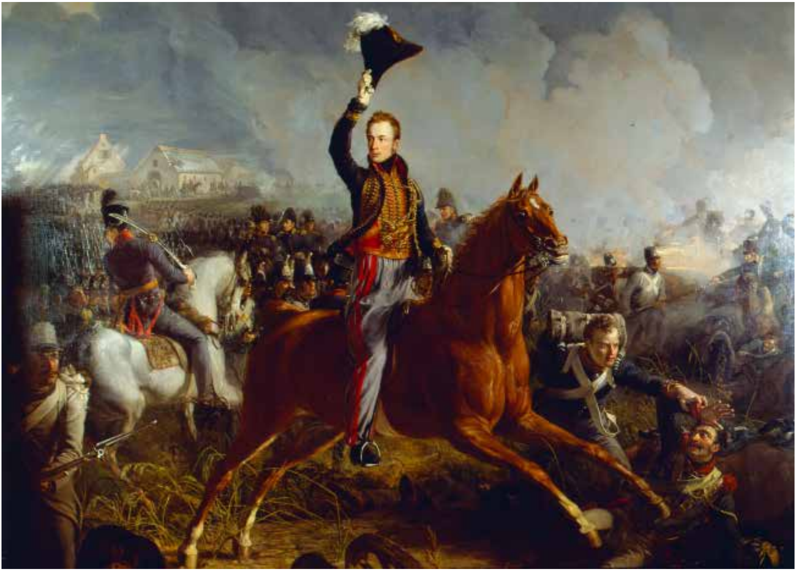
1.24 Jan Willem Pieneman, De prins van Oranje bij de Slag van Quatre Bras , 1817-1818. Olieverf op doek, 400 x 625 cm Den Haag, Koninklijke Verzamelingen, inv.nr. SC-0715