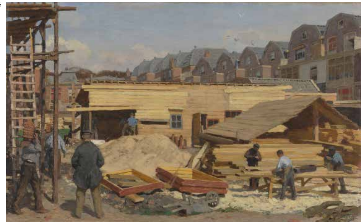
4.78 Willem Bastiaan Tholen, Huizen in aanbouw , 1895 Olieverf op doek, 42 x 66 cm Otterlo, Kröller-Müller Museum, inv.nr. KM 108.927