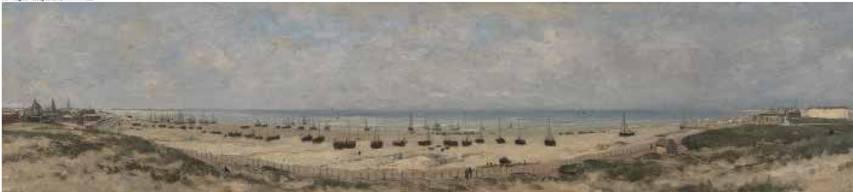
3.70 Hendrik Willem Mesdag, Studie voor Panorama van Scheveningen , 1880 Olieverf op doek, 32 x 230 cm Den Haag, De Mesdag Collectie, inv.nr. hwm0227