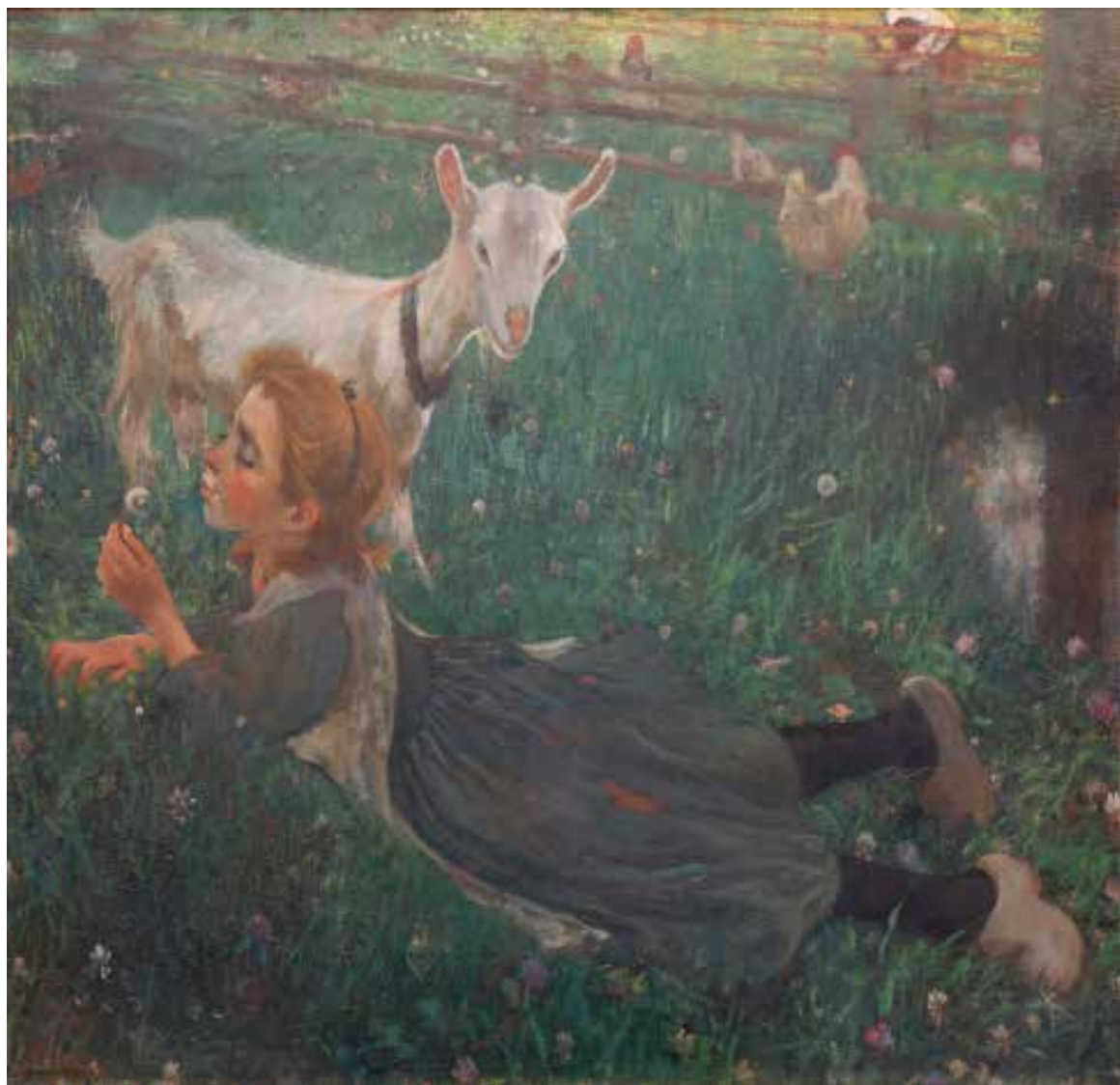
4.86 Jacobus van Looy Aaltje met de geit , 1897 Olieverf op doek, 128,1 x 133,2 cm Haarlem, Frans Hals Museum, inv.nr. vL 49-235; geschonken door Stichting Jacobus van Looy