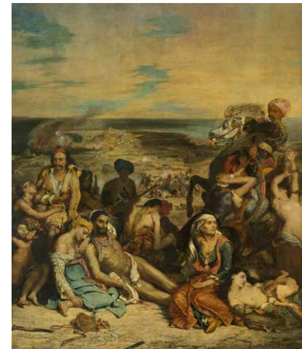
2.30 Eugène Delacroix, Scènes des massacres de Scio , 1822 Olieverf op doek, 419 x 354 cm Parijs, Musée du Louvre, inv.nr. INV3823