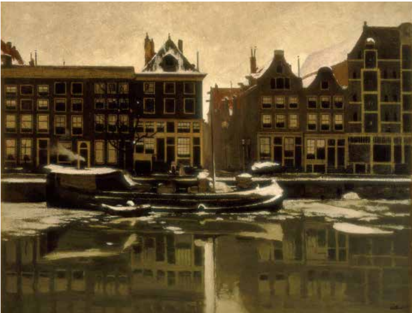
4.76 Willem Witsen, De Oude Schans , 1899-1900 Olieverf op doek, 100 x 129 cm Amsterdam, Stedelijk Museum Amsterdam, inv.nr. A 2368; v erworven met steun van de VHK