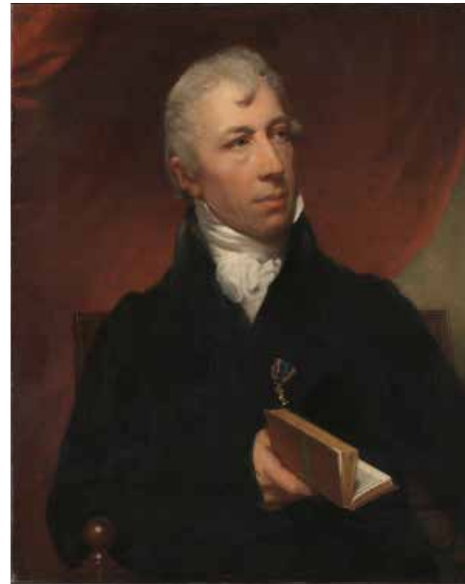
1.31 Charles Howard Hodges, Portret van Cornelis Apostool , na 1816. Olieverf op doek, 73 x 53 cm. Amsterdam, Rijksmuseum, inv.nr. SK-A-654; leegaat van de heer C. Apostool, Amsterdam

Het maatschappelijke leven van de welgestelde burger in het begin van de 19de eeuw speelde zich voornamelijk af binnen twee kernen: de familie en het genootschap. Dit was een laat-18de-eeuwse besloten vereniging voor mannen, waar ze naartoe gingen om over de laatste stand van zaken op gebied van politiek, kunst en wetenschap te spreken en de couranten te lezen. Op