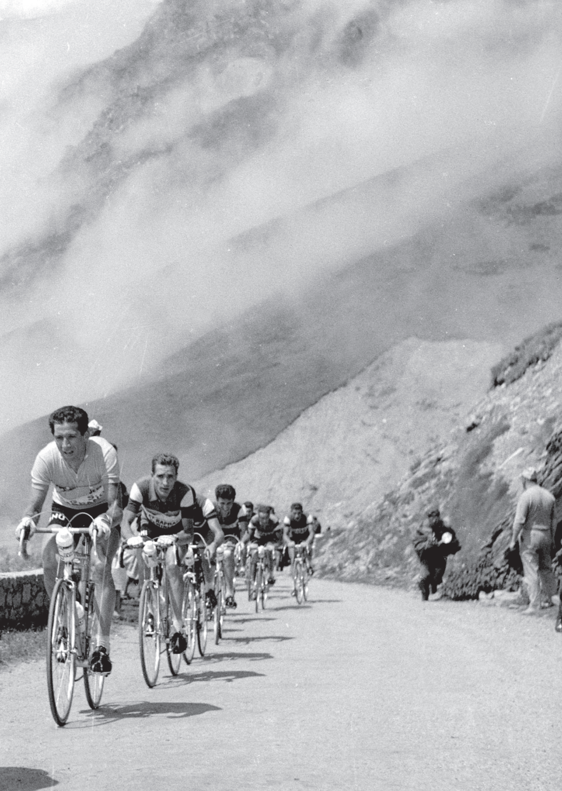
Tom Simpson op kop voor gele truidrager Gastone Nencini tijdens beklimming van de Tourmalet in de Tour van 1960