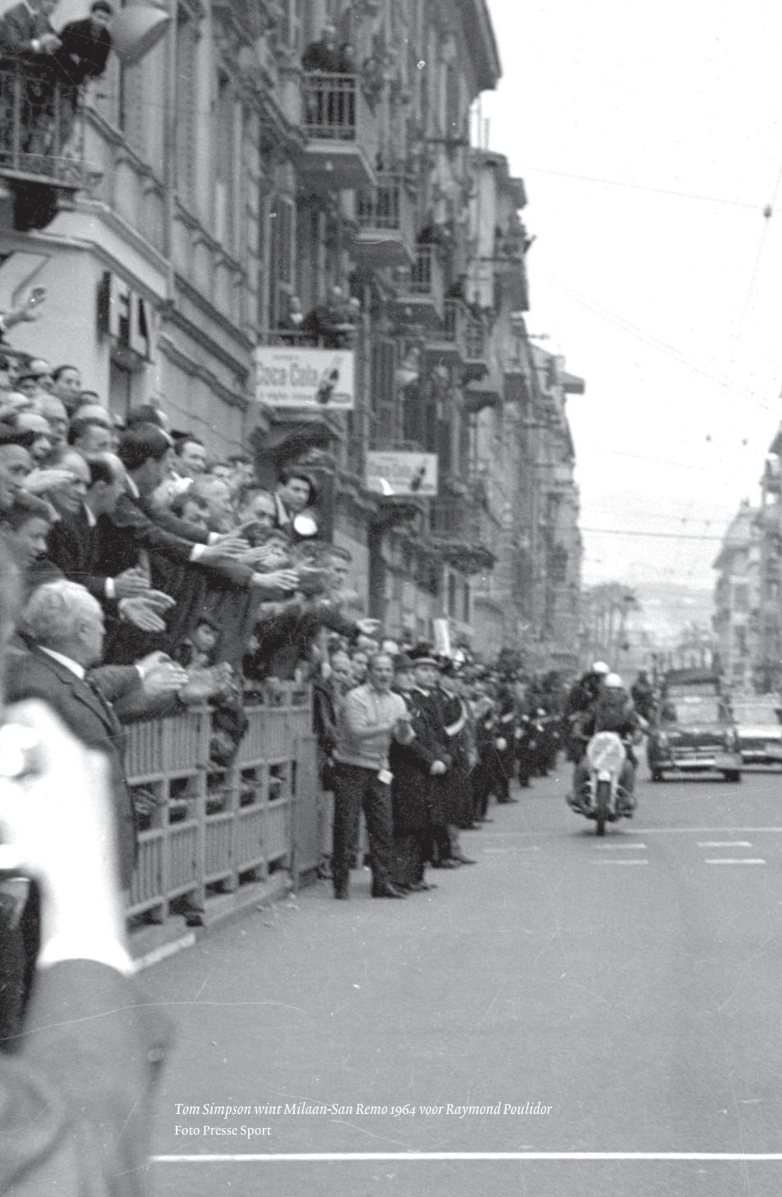
Tom Simpson wint Milaan-San Remo 1964 voor Raymond Poulidor