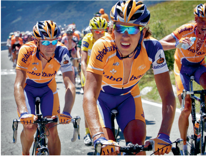
Michael Rasmussen in de gele trui, voorafgegaan door zijn ploeggenoten.