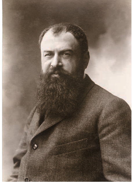
Paul 'Tristan' Bernard (°1866), Frans schrijver, theater- en velodroom- directeur