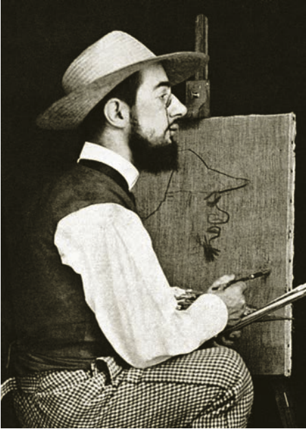
Henri de Toulouse-Lautrec (°1864), Frans kunstenaar