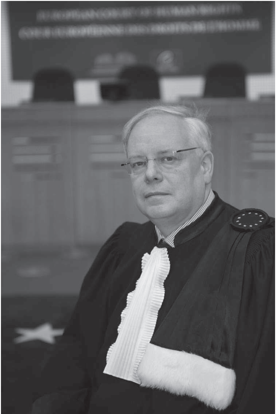
Dean Spielmann