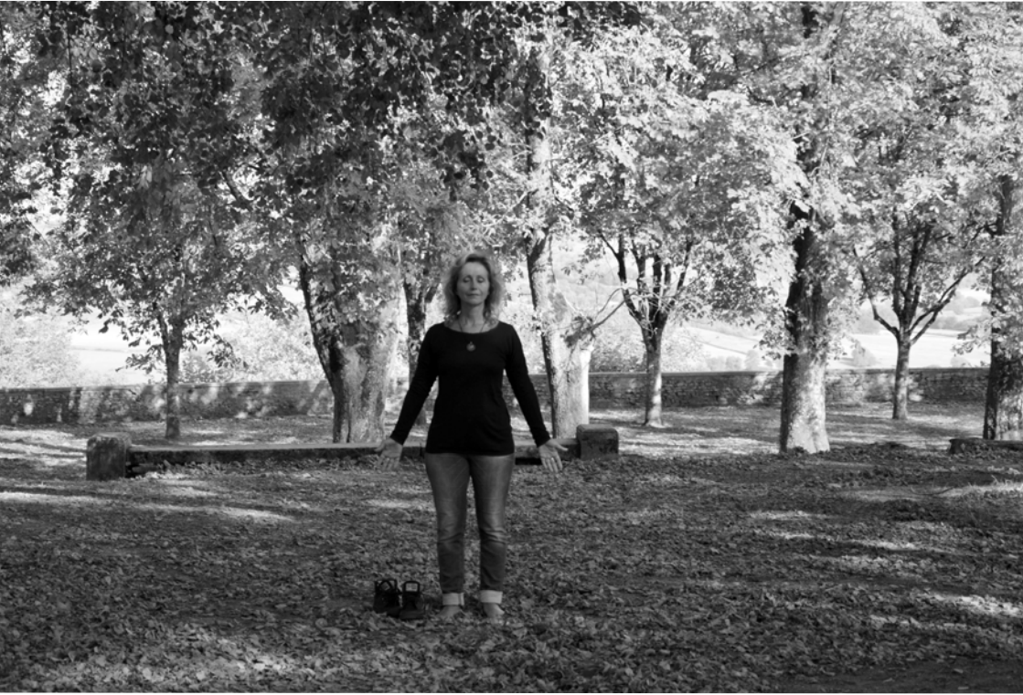
Kracht groenplateau achter de kerk in Vezelay