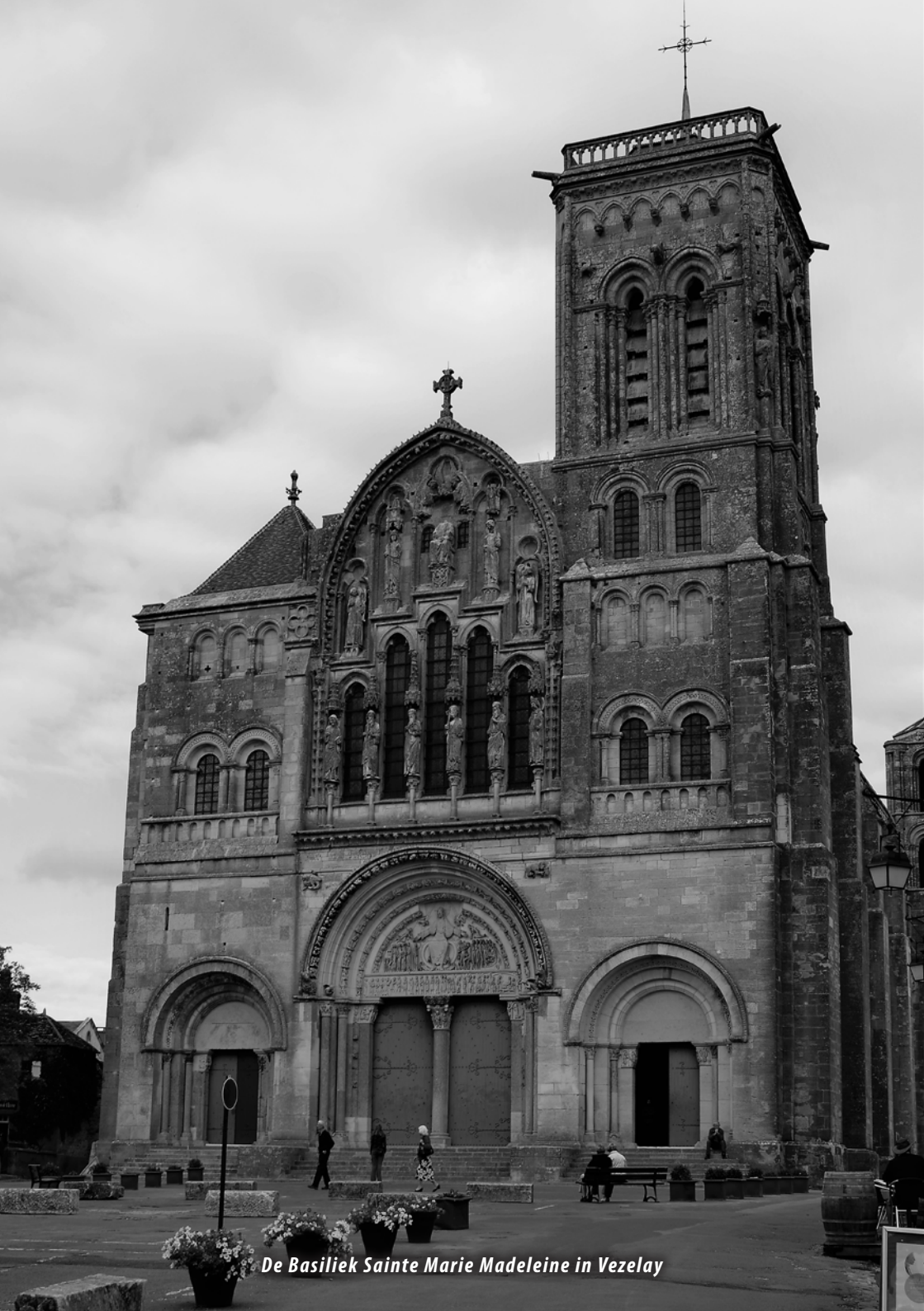
De Basiliek Sainte Marie Madeleine in Vezelay