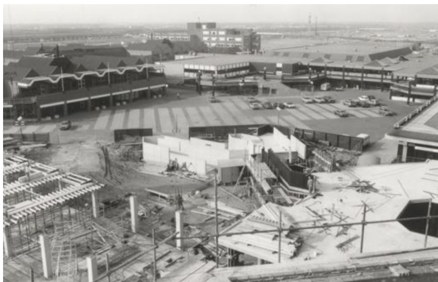
De aanbouw van Winkelcentrum De Gordiaan begin jaren zeventig.