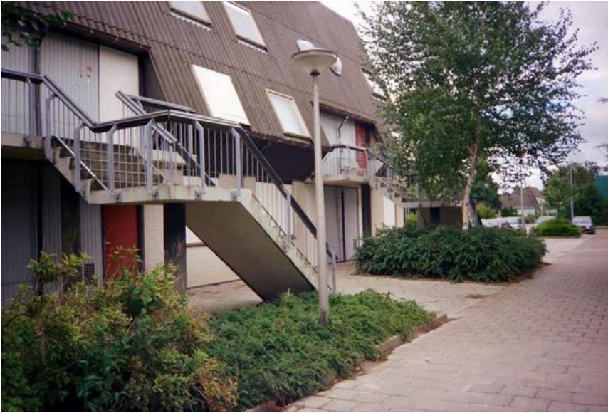
Schouw 24-12 waar jarenlang de studio was.