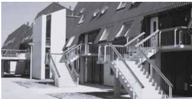
De futuristische woningen in het Schouw.

Goed doe Radio Helystad, groetjes Ron van je luister-