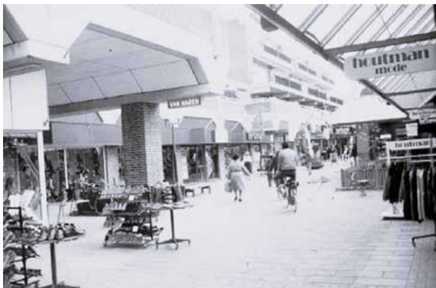
Het winkelcentrum De Gordiaan 1980