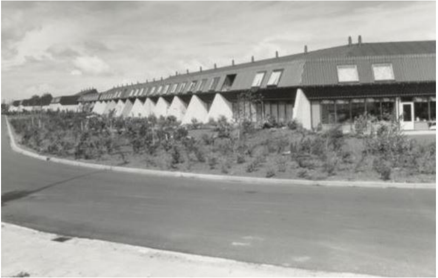
De lage type woningen in het Schouw.