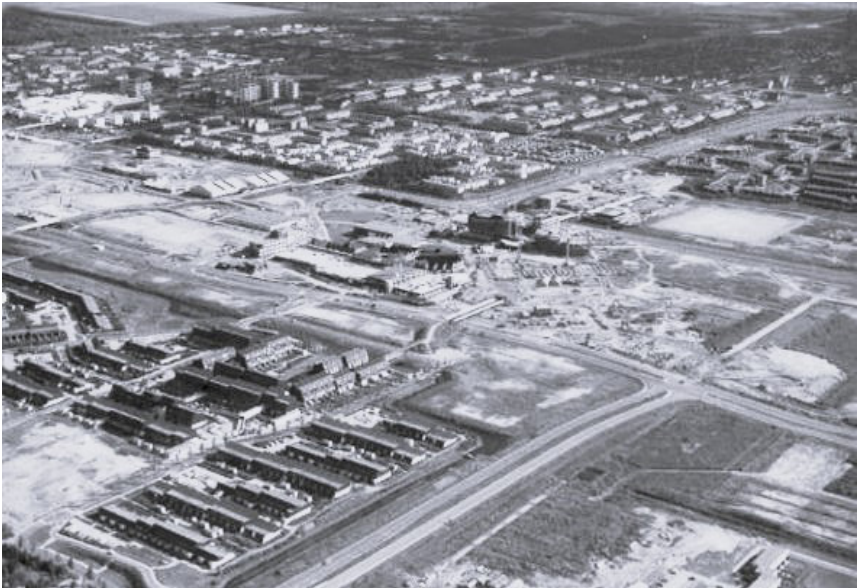
Linksonder de wijk Schouw 1975 vanuit de lucht gezien