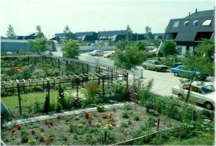
Een dagelijks tafereeltje van de wijk Schouw, jarenlang het thuishonk van Radio Lelystad.

Maar nu het ontvangststation op de toren stond, was de afstand fors groter geworden. Zogezegd, zo gedaan: de antenne stond hoger bij de burens op dak. Het inbreken op het kabelnet lukte weer; de hoogte en richting van de antenne gaven dus een goed resultaat.