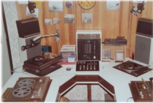
De begin studio van Radio Mercurius 1977

Radio Lelystad was geboren. WRL zond uit op zondagochtend en woensdagavond via het kabelnet van Lelystad.