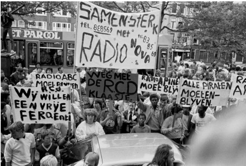
Demonstratie radiopiraten in Amsterdam 1982.

Het antwoord: het radiolandschap bestond uit vier publieke zenders, elke omroep had zijn eigen uitzenddag en op veel dagen viel je nog net niet in slaap. Je hoorde enkel muziek die in hun kaders paste en geplugd werd door de vele platenpluggers. Bij de piraten was dat anders, daar draaide de dj van alles, van Nederlandstalig tot de nieuwste importmuziek, die pas maanden later te horen zou zijn in Hilversum, of het zelfs helemaal niet haalde. Het grote aanbod van piratenzenders maakte de keus voor de luisteraar gemakkelijk, en bellen of verzoekplaten aanvragen maakten het vertrouwd en dichtbij.