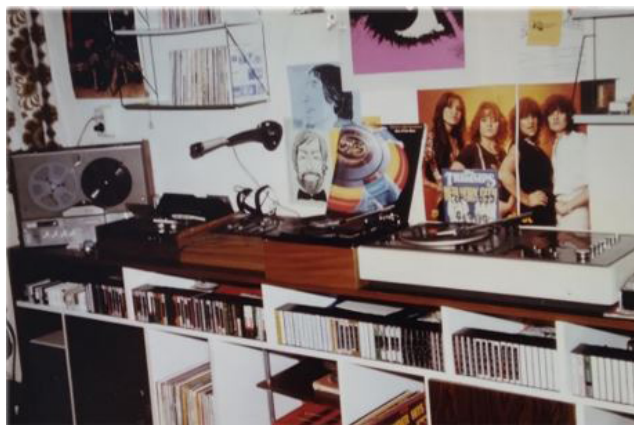
Het allereerste begin van Radio Mercurius, 1978.