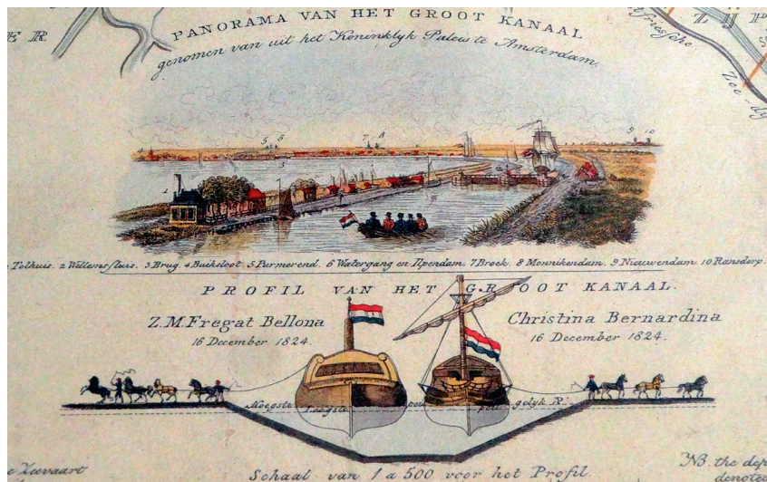
Van de Bellona bestaan weinig afbeeldingen maar op 16 december 1824 voer die als eerste schip door het nieuw gegraven Noordhollandsch kanaal.

en geef cursussen over het Nederlandse (VOC) erfgoed in dat land, waar- toe ik ook de (immateriële) verhalen en tekeningen van de mannen van de Bellona reken. 20 Uit hun ervaringen blijkt dat India grote indruk op ze heeft gemaakt. In hoeverre dat blijvend is geweest of bepalend, kan ik niet zeggen. Maar mijn eerste bezoek aan India in 1974 als 22-jarige heeft wel een blijvende indruk op me gemaakt. Het kan niet anders dan dat dit ook geldt voor de 17-jarige prins Hendrik die bijna 180 jaar gele- den de Gangesvlakte van Noord-India doortrok.