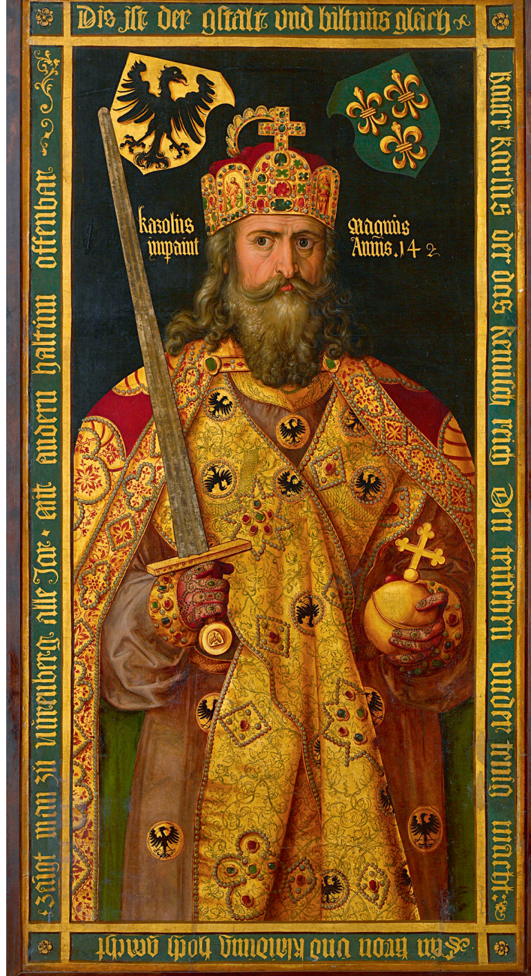
Zeer bekend, ideaaltypisch portret van Karel de Grote door Albrecht Dürer (1513), gemaakt in opdracht van Dürers vaderstad Neurenberg.

Wegens de Frankische opvolgingstraditie viel het rijk na Karels dood snel uiteen, geteisterd door broeder-twisten en invasies van Noormannen en Saracenen. Drie jaar na de dood van Lodewijk de Vrome werd het in 843 met het Verdrag van Verdun verdeeld onder Lodewijks drie zoons Lotharius I, Lodewijk de Duitser en Karel de Kale. Uit deze parten zou in het westen Frankrijk ontstaan en in het oosten het Heilige Roomse Rijk der Duitse Natie. Het zonderlinge Middenrijk ofwel het koninkrijk Lotharingen, dat van de Noordzee tot bezuiden Rome liep, werd