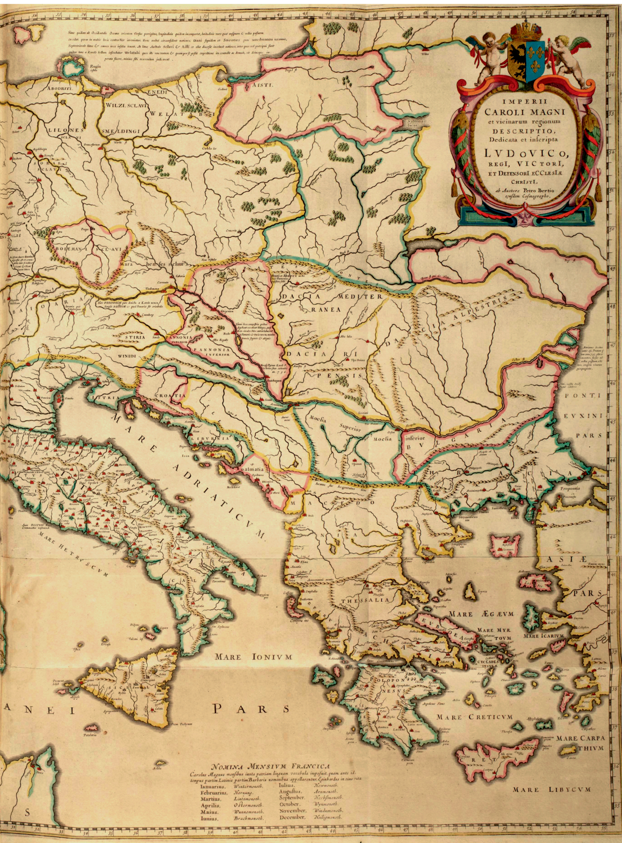
Imperii Caroli Magni et vicinarum regionum DESCRIPTIO [enz.]. | In Amsterdam vervaardigde historische kaart van het rijk van Karel de Grote, 1661/62. Afmeting: 64 x 98 centimeter.