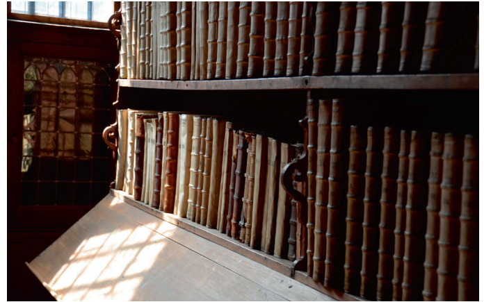
Interieur Librije Westerkerk Enkhuizen. Kasten met een leesplank eraan. De stang en de kettingen waarmee de boeken geketend waren, zijn in de negentiende eeuw verwijderd.

Een derde aspect dat uitnodigt tot een vergelijking van de gang van zaken in de diverse steden is het beheer van de bibliotheek. Vóór de overgang van de stad naar de Prins en dus de gereformeerde religie werden de bibliotheken in de kerken, publieke ruimtes bij uitstek, beheerd door de katholieke kerk. Kerkmeesters hadden de zorg voor de bibliotheek. Ze werden daarbij soms bijgestaan door de rector van de plaatselijke Latijnse school. Bewaard gebleven kerkelijke archieven (Zutphen, Gouda) geven inzicht in dit beheer. Na de Alteratie neemt de protestante stedelijke overheid met de bibliotheek ook het beheer ervan over. Er worden beheerders aangesteld, vaak leden van de vroedschap en een of meer predikanten. De dagelijkse zorg kwam meestal neer op de koster of zijn vrouw (Amsterdam, Rotterdam). In Gouda was het beheer in handen