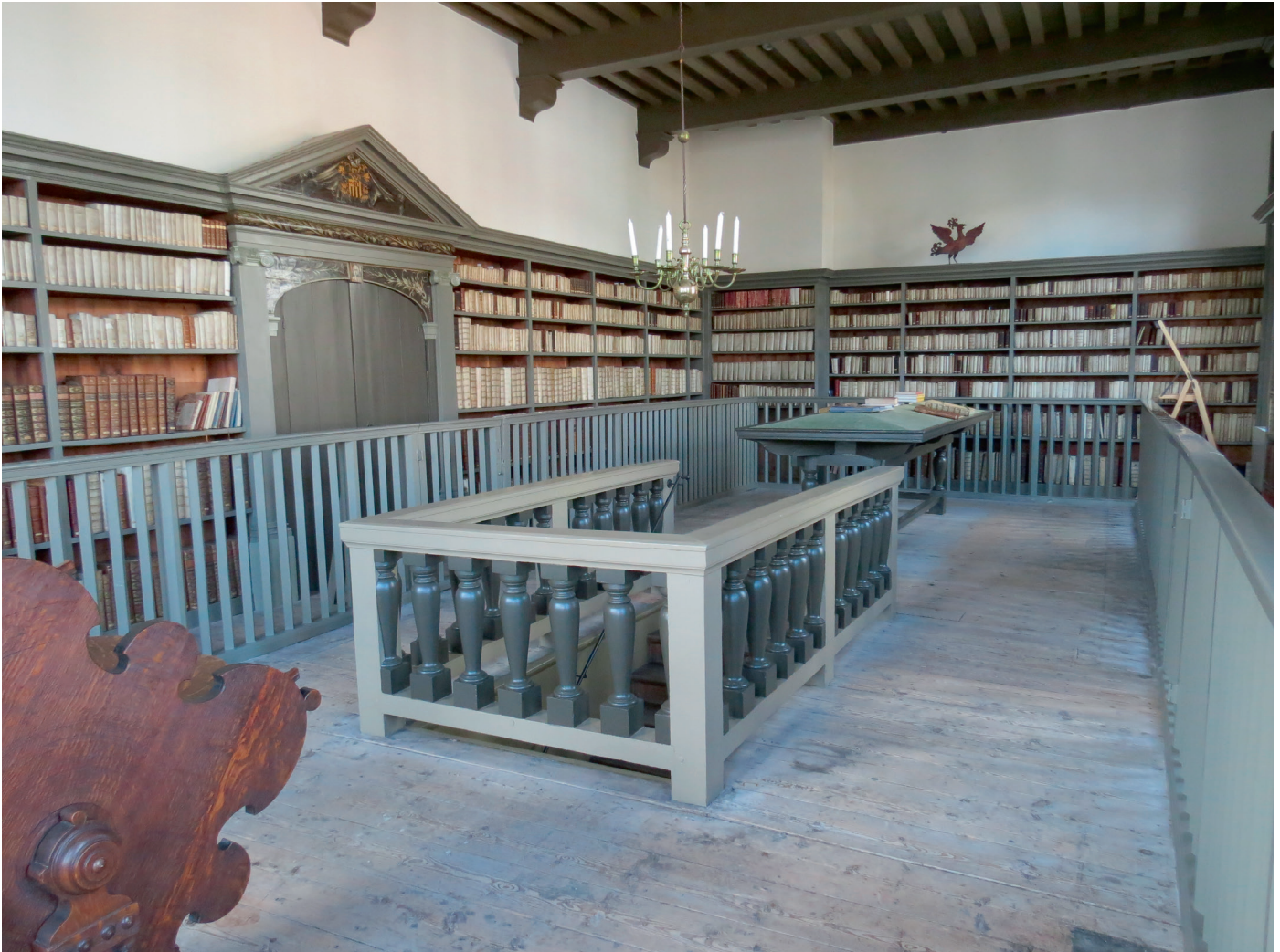
Bibliotheekzaal van de Bibliotheca Thysiana te Leiden (1655), gezicht naar het Noorden. Opvallend is de moderne, zeventiende-eeuwse inrichting: wandkasten met een hek ervoor.

Stadsbibliotheken nemen namelijk vaak de boeken uit kerkelijk bezit op in hun collecties. De beroemde monumentale Joodse bibliotheek, Ets Haim, te Amsterdam, wordt dus niet behandeld. 7 Ook priesterbibliotheken en bibliotheken van katholieke orden en congregaties blijven goeddeels buiten beschouwing. 8