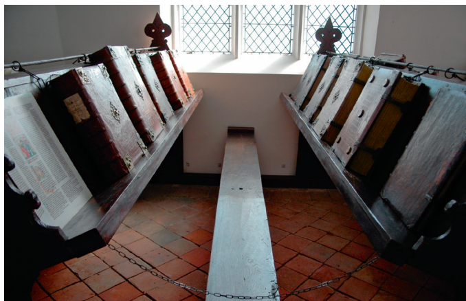
Interieur Librije Zutphen. Lectrijnen met dubbele leesplank, waarboven een stang waaraan van weerskanten met kettingen boeken zijn vastgemaakt.

Hoe de boeken in deze bibliotheekruimten werden geplaatst, valt gelukkig op drie plaatsen in Nederland nog te zien. In de librije van de Walburgiskerk te Zutphen liggen in leer gebonden folianten op zogenaamde lectrijnen aan een ketting die met een ring aan een ijzeren roede boven de lectrijn is bevestigd. Hier heeft een lectrijn, ook wel pulmt (Latijn: pulpitum ) of in het Middelnederlands pulpit genaamd, twee schuin geplaatste leesplanken waarop de boeken rusten. Een houten richel voorkomt dat de boeken van de planken schuiven. Tussen twee lectrijnen staat een bank waarop de lezers kunnen