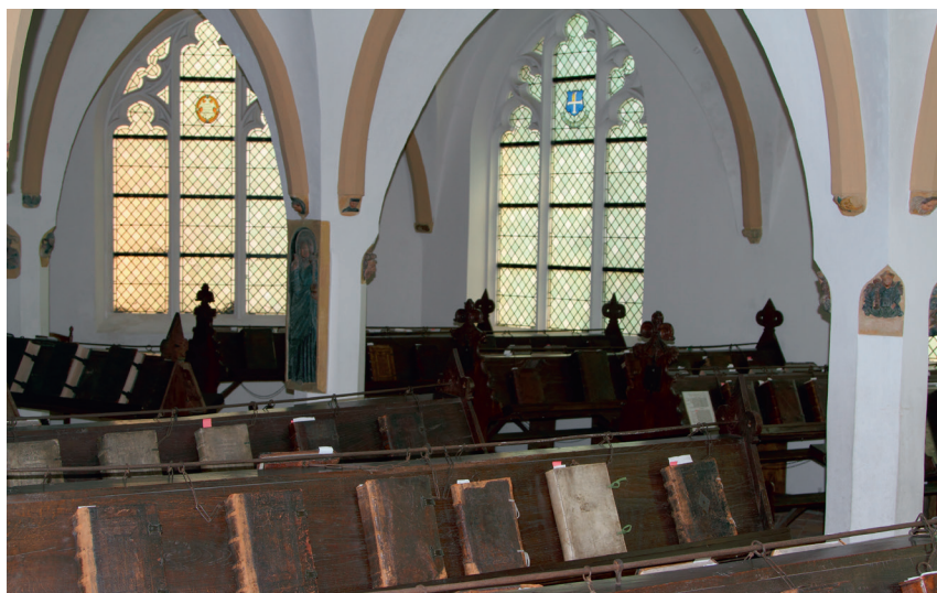
Interieur ‘Benedenlibrije’ Librije St. Walburgiskerk te Zutphen (1564). De enige nog bestaande Nederlandse kettingbibliotheek.

Deze bundel gaat over historische stadsbibliotheken in de Nederlanden die zijn gesticht in de zestiende of zeventiende eeuw. Bibliotheken die later zijn ontstaan bijvoorbeeld in de Zuidelijke Nederlanden uit kloosterbibliotheken die op last van de Franse overheid opgeheven werden (Brugge, Gent), blijven buiten beschouwing. In de boek- en bibliotheekwetenschap worden stadsbibliotheken gerekend tot de institutionele bibliotheken. 1 Het zijn bibliotheken die door een stedelijke regering zijn opgericht, door de stad worden onderhouden en die voor ingezetenen van een stad toegankelijk zijn. Een stedelijke bibliotheek wordt ook wel bibliotheca publica (openbare bibliotheek) genoemd. De term bibliotheca publica wordt in de zestiende- en zeventiende-eeuwse bronnen gebruikt om dit type bibliotheek te onderscheiden van de privébibliotheken van geleerden en van welgestelde bibliofielen of van de bibliotheken van bestuurs- of rechtscolleges die alleen voor de eigen functionarissen toegankelijk zijn.