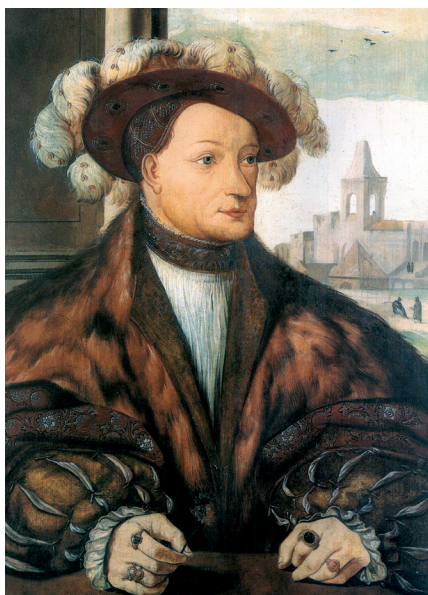
Karel van Egmond, hertog van Gelre en graaf van Zutphen. Kopie naar vermoedelijk B. Bruyn. Historisch Museum Arnhem.

Binnen het versnipperde West-Europa hadden alleen de Bourgondiërs voldoende inkomsten om zich zo'n staand leger te kunnen permitteren. Dat betekende dat Bourgondië zich opwierp als een nieuwe machthebber waar anderen rekening mee moesten gaan houden. Bourgondië begon met het zich losmaken van de Franse koning en het achtereenvolgens veroveren van Brabant, Henegouwen en Luxemburg. Holland en Vlaanderen kwamen 'binnen de familie' door liefde, list en slimme allianties. Het gevolg was dat Gelre een soort enclave werd, omringd door Bourgondische bezittingen en daarmee een gewilde prooi. Gewild, omdat de rivieren, de verkeerswegen bij uitstek, door Gelre liepen.