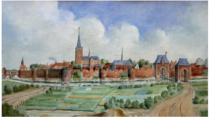
Vesting Lochem door Gerrit Prop. De Veldmaat Lochem.

De vestingmuur zelf moet ongeveer 3-4 meter hoog zijn geweest. Alle kleine bastions, zoals getekend op de prent van Prop, zijn twijfelachtig. Behalve de zogenoemde 'Blauwe Toren'. Die wordt gebouwd in opdracht van graaf Reinoud II, als bolwerk op een hoek van de muren aan de Zuider- en Westerwal. Een noodzakelijke versterking in de stadsverdediging op een onoverzichtelijk hoek.