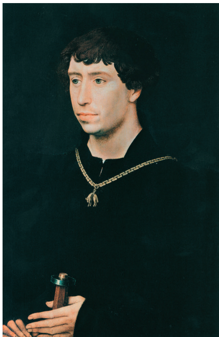
Karel de Stoute door Rogier van der Weyden. Staatliche Museen Berlijn.

te kunnen berekenen voor een effectief schot. Alleen een geoefend leger met voldoende permanente bezetting, een 'staand leger', had daarom nog toekomst. En dat kostte geld, veel geld.