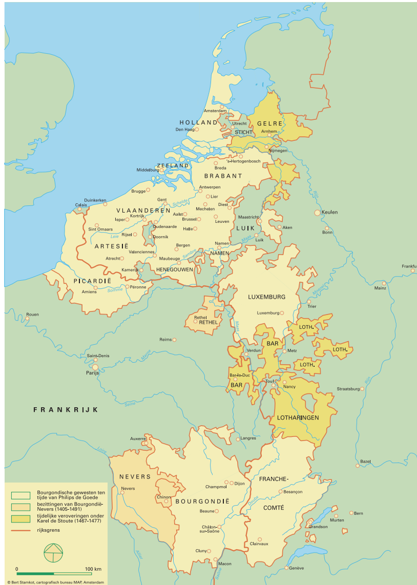
Het Bourgondische Rijk onder Karel de Stoute.

In deze situatie kwam verandering in de eerste helft van de 15e eeuw, toen de 'tanks van de Middeleeuwen', de gepantserde ridders op hun geharnaste paarden, het moesten afleggen tegen de piekeniers, gewone voetsoldaten met lange lansen. Die waren, in een onverschrokken en wendbaar vierkant opgesteld, steeds vaker een ondoordringbare en levensgevaarlijke muur voor de ridders. Daarvoor moest je als piekenier veel oefenen, om de angst voor die ridders op hun paarden succesvol te overwinnen en het ingestudeerde vierkant van manschappen in stand te houden. Want paniek betekende een zekere dood. Daarnaast konden door veel effectievere kanonnen en kruidladingen, vestingmuren aan puin worden geschoten. Maar ook daarvoor moest je door theorie en ervaring voldoende kennis opdoen om succesvol te kunnen zijn. Zo maar even wat soldaten huren ging niet meer. Piekeniers moesten de zekerheid krijgen dat hun lansen, die in het zand waren vastgezet, de ridders en hun paarden daadwerkelijk konden tegenhouden. Kanonnières moesten wiskunde gestudeerd hebben om afstand, schiethoek en kruidlading van tevoren