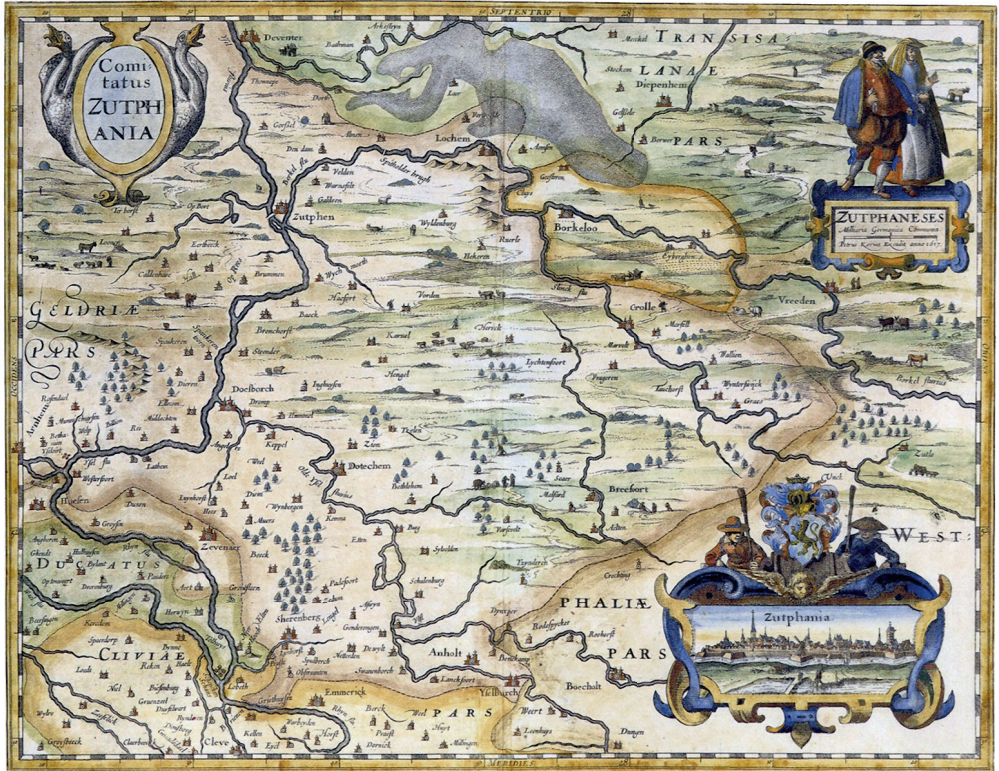
De route tussen oost en west loopt door Lochem en tussen Berkel, moerassen en Lochemse berg. Comitatus Zutphania door Petrus Kaerius. Musea Zutphen.

stad, kon zowel als ‘buffer voor’ en als ‘uitvalsbasis van’ de Münsterse bisschop tegen Zutphen gezien worden. In beide gevallen kon Lochem, als versterkte stad, goed van pas komen.