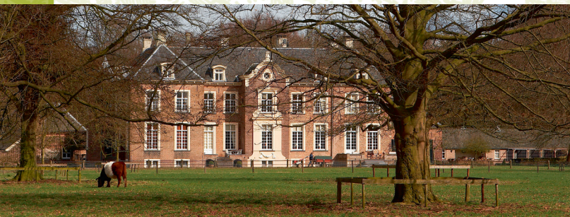
Kasteel Ampsen bij Lochem, het meest authentiek.

Het verhaal over de Lochemse kastelen heeft betrekking op vele eeuwen en op een grote variëteit. Sommige, zoals Verwolde, Dorth en Nettelhorst, zijn als middeleeuwse burcht begonnen, als weerbaar huis ter ver-