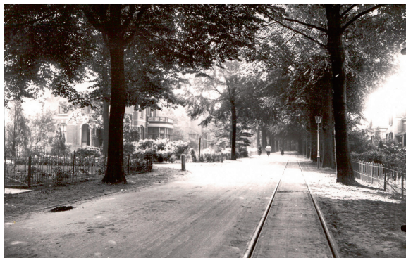
Oude trambaan langs de Nieuweweg.