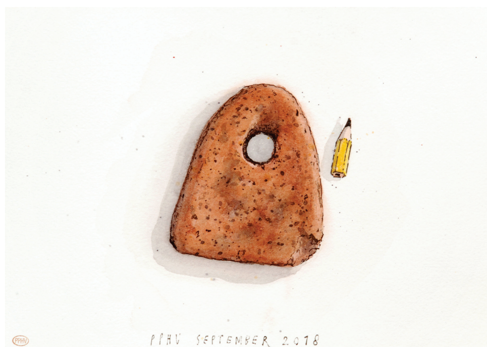
Bakstenen visnetverzwaring, gevonden langs de IJssel bij heel laag water 2018