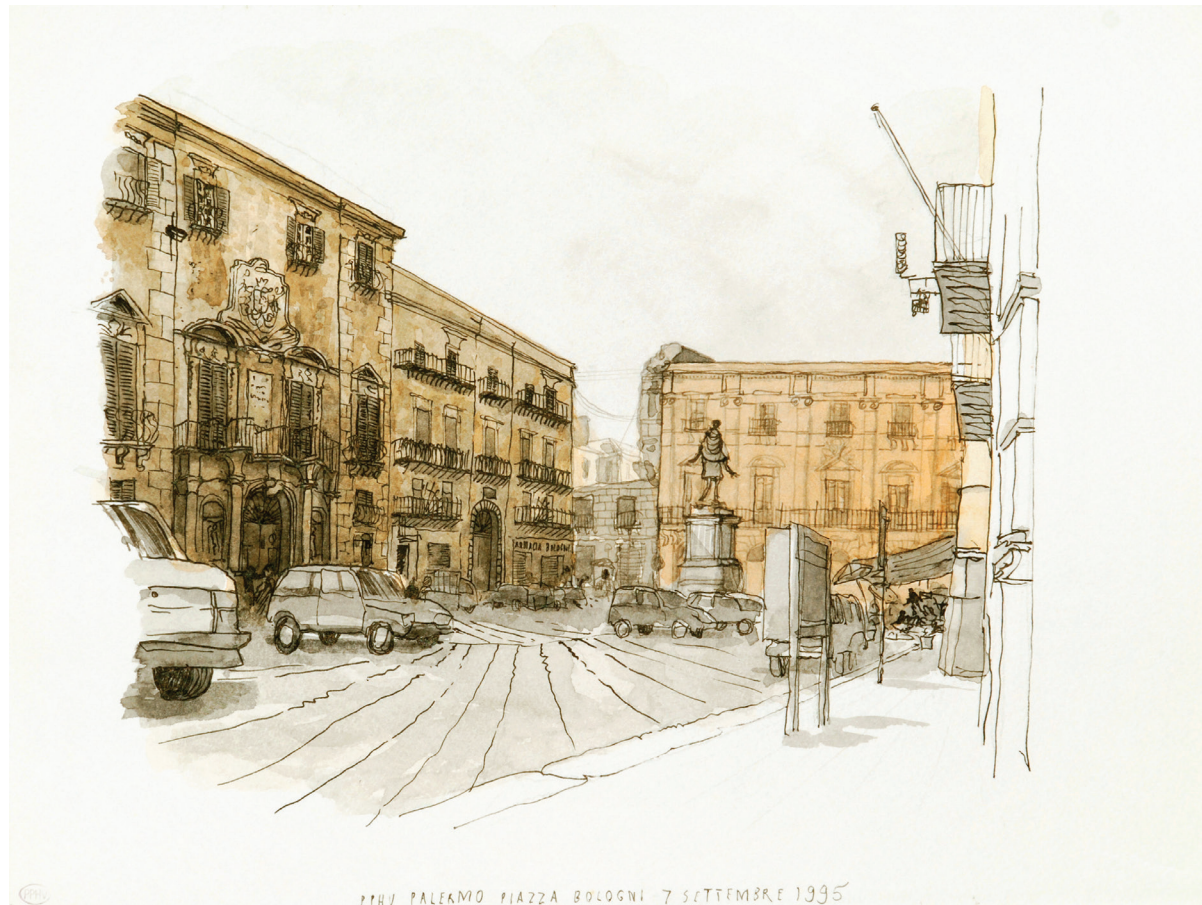
Palermo Piazza Bologni 1995