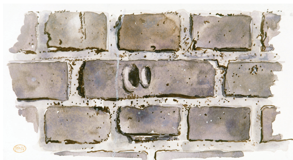
Vingerafdrukken, meegebakken in een metselsteen ergens in Deventer 2016

De stad is niet één dag dezelfde. Veranderingen vinden niet ongemerkt plaats, maar ons kortetermijngeheugen laat ons op veel punten in de steek als het gaat om de vraag hoe het er ergens in de stad nog geen generatie geleden uit zag. Op diverse plekken in Deventer heb ik tweemaal getekend met een tussenpoos van soms meer dan twintig jaar. De tekeningenparen die zo zijn ontstaan brengen het veranderende gezicht van de stad aan de oppervlakte. Zij confronteren ons met wat wij ons herinneren en onlosmakelijk daarvan ook met wat we vergeten zijn. Zij leggen ook verandering van inbreng en visie van de tekenaar zelf bloot. Die tekeningenparen zijn steeds op naast elkaar liggende bladzijden geplaatst, zodat u kunt vergelijken. Het veranderen gaat immer door. Iedere keer dat u dit boek inkijkt zien de stad, de wereld en uzelf er anders uit.