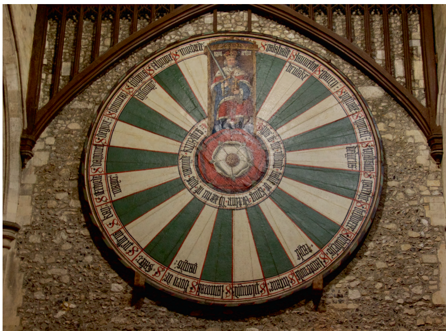
De ronde tafel van koning Arthur in Winchester.