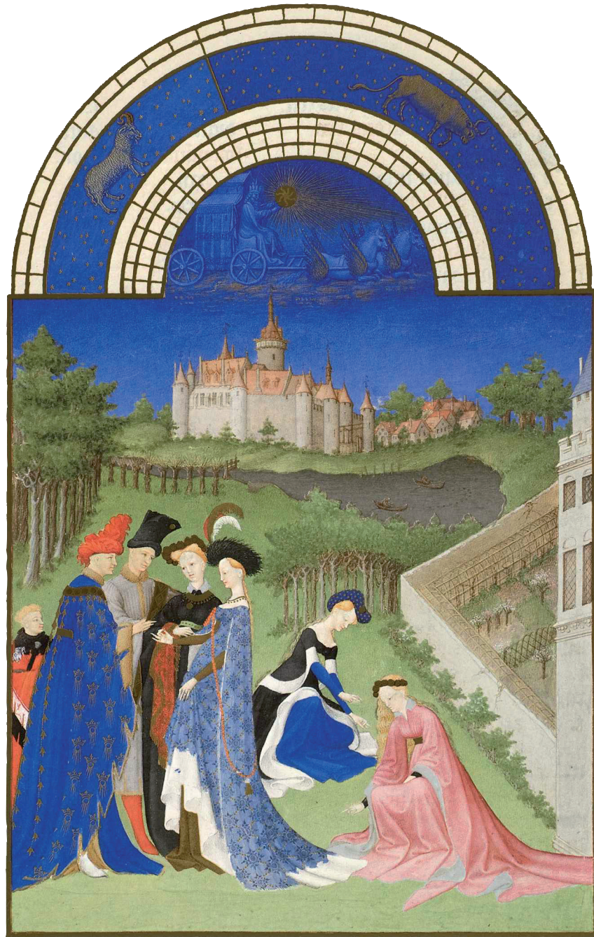
Mooi uitgedoste dames en heren vermaken zich met elkaar in een lieflijk landschap. Kalenderblad voor de maand april uit het beroemde getijdenboek Les Très Riches Heures , dat rond 1410 in opdracht van de hertog van Berry werd vervaardigd. De uit Nijmegen afkomstige gebroeders Van Limburg maakten de illustraties. (Chantilly, Musée Condé)