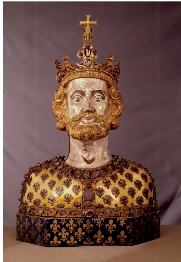
Borstbeeld Karel de Grote. (Aken, Domkapittel)

ondergraven werd door conflicterende lokale, regionale en maatschappelijke belangen: een onuitputtelijke voedingsbodem voor het beruchte particularisme dat ook de Republiek der Verenigde Nederlanden (1581-1795) nog zou karakteriseren.