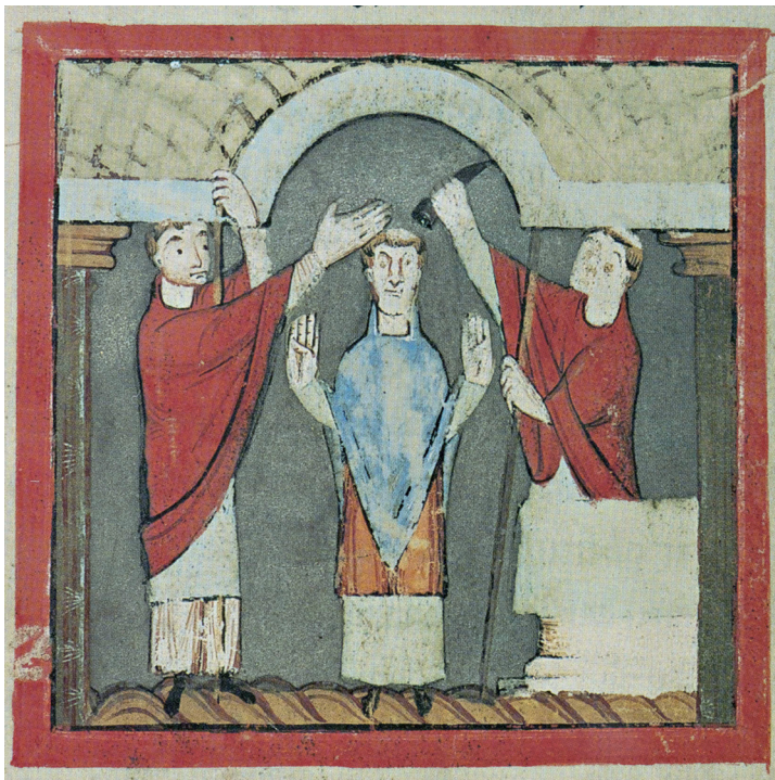
Liudger wordt tot bisschop gewijd. Miniatuur uit de Vita Sancti Liudgeri , plm. 1100 (facsimile). De missionaris Liudger speelde rond 800 een belangrijke rol bij de kerstening van Oost-Nederland. ( Den Haag, Koninklijke Bibliotheek )

De leenstaatjes en vorstendommen waarin het rijk uiteindelijk versnipperde en die in de Nederlanden slechts nominaal ressorteerden onder het gezag van de Duitse keizer (of, in het zuiden, de Franse koning) werden nu bestuurd door graven (oorspronkelijk Karolingische ambtenaren), hertogen en bisschoppen; deze nieuwe territoriale verbanden kregen meer duurzame vorm vanaf de twaalfde eeuw (11, 13, 18, 19, 24, 34). Een uitzondering in onze streken vormde het noorden ( DE FRIESE VRIJHEID , 21). Grote abdijen bleven vooralsnog de centra van geestelijk leven, onderwijs en cultuurproductie (12, 31). Een vrijwel permanente koude of ‘warme’ oorlogstoestand tussen de leenstaten bevorderde de aantrekkingskracht en vitaliteit van een ridderideaal, waarvan het overwegend mannelijke, martiale karakter een zekere verfijning door invloed van de hoofse cultuur onderging ( DE RIDDER ALS CULTUURIDEAAL , 17). Eeuwenlang domineerde de ridder het middeleeuwse krijgstoneel. Sinds de slag bij Kortrijk in 1302 (26) taande zijn rol in de