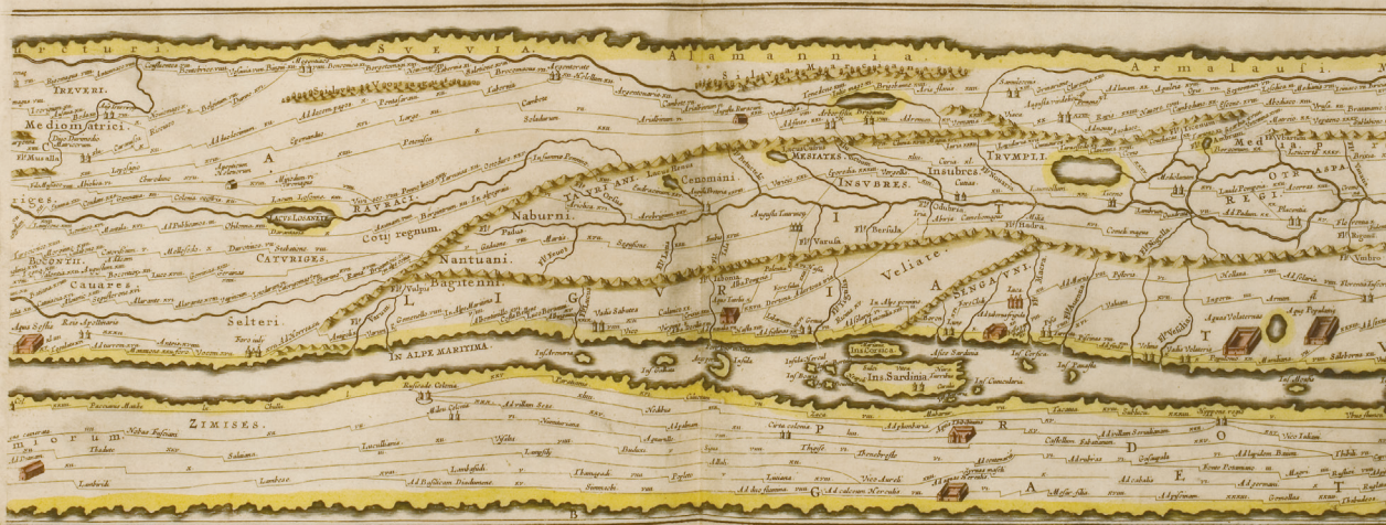
SEGMENTVM SECVNDVM à Bonna vique ad Marcomanos.

Fragment van de Peutinger kaart, een kopie van een Romeinse reiskaart uit de 3 e -4 e eeuw. De rol perkament is 6,82 meter lang en geeft een schematische weergave van wegen en rivieren. (Leiden, Rijksmuseum van Oudheden)