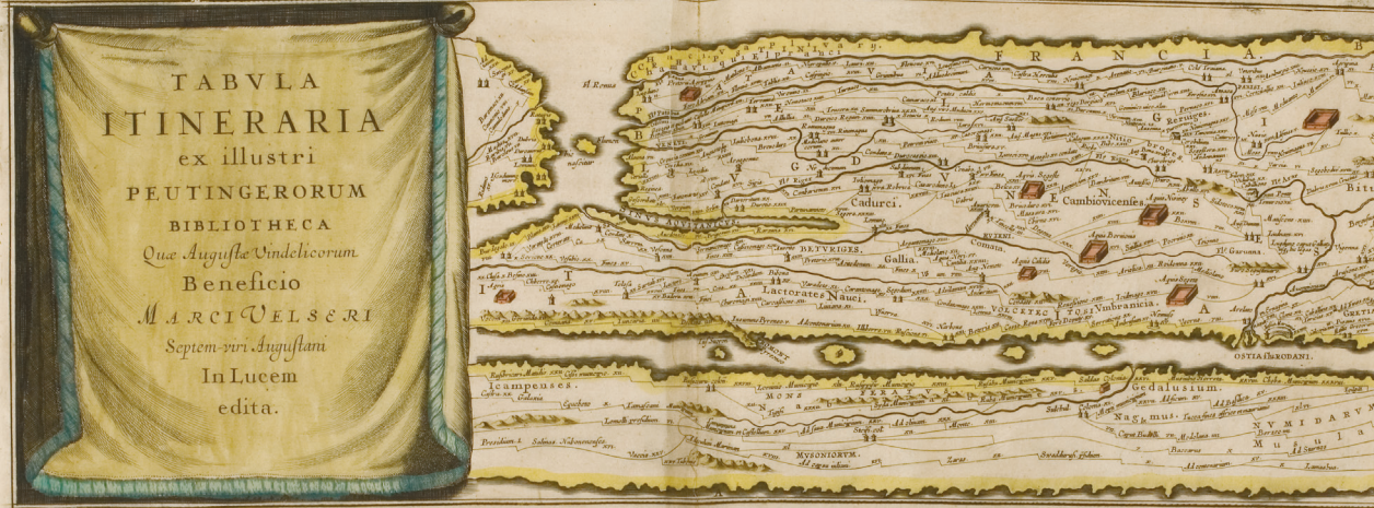
TABVLÆ PEVTINGERIANÆ. SEGMENTVM PRIMVM, ab ostiis Rheni bonnam vique.