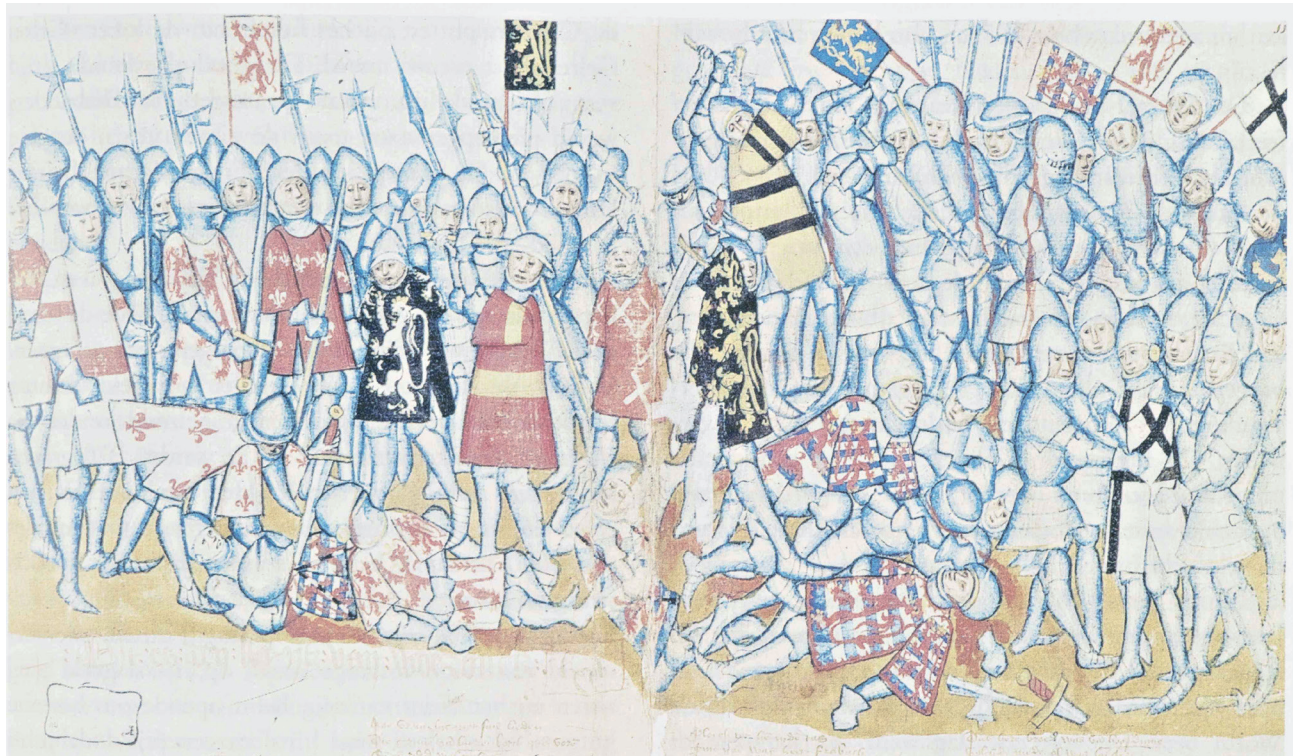
Miniatuur van de Slag bij Woeringen in 1288, uit de rijmchroniek van Jan van Heelu. Deze slag werd uitgevochten tussen Brabant en Gelre over de heerschappij in Limburg en werd gewonnen door hertog Jan I van Brabant. (Brussel, Koninklijke Bibliotheek)

Nederlanden; huurlingenlegers en het vuurgeschut verdreven hem nadien definitief uit de hoofdrol op het slagveld (49).