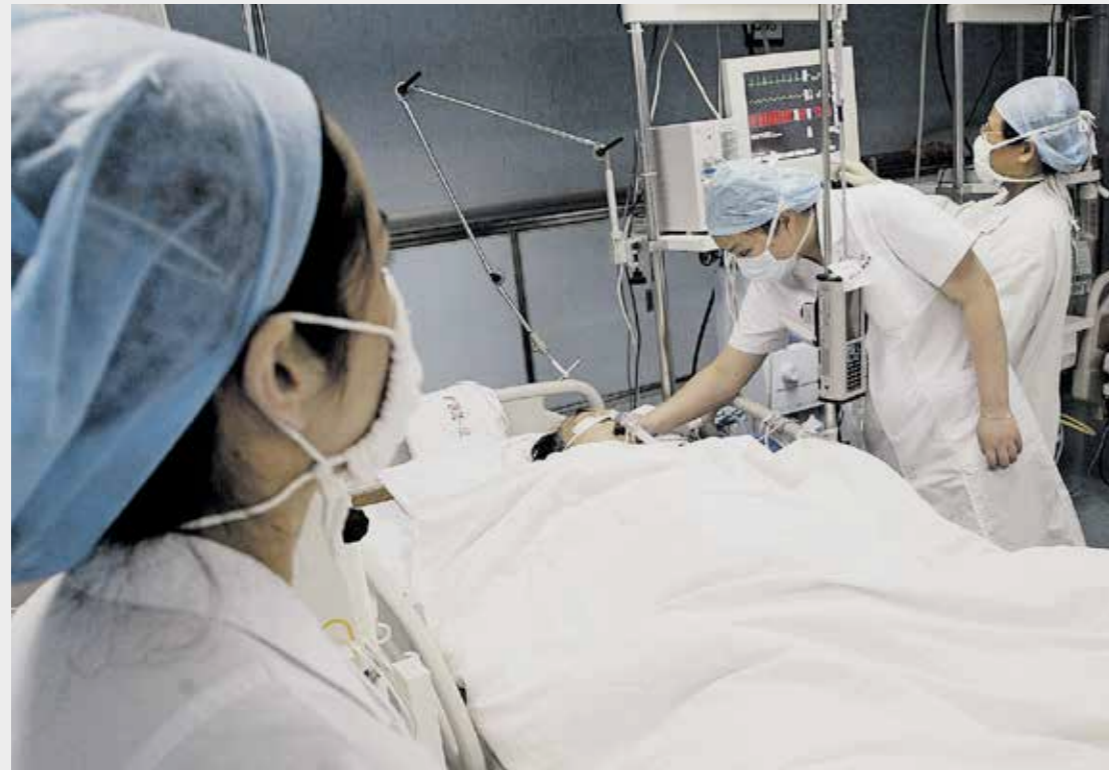
VIRUS Behandeling van patiënten met het sarsvirus in 2003 in China, waaraan uiteindelijk bijna 800 mensen overleden.

Timen zegt de situatie 'nauwlettend te volgen', maar ziet ook nog geen aan-