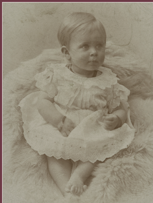
Links: George Haspels, Vreugden van Holland . Amsterdam, 1900.