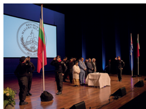
De RMS-regering in ballingschap op het podium tijdens de vlaghijsing. Op het podium hangen ook de Morgenstervlag (de vlag van West-Papua) en de vlag van Atjeh.