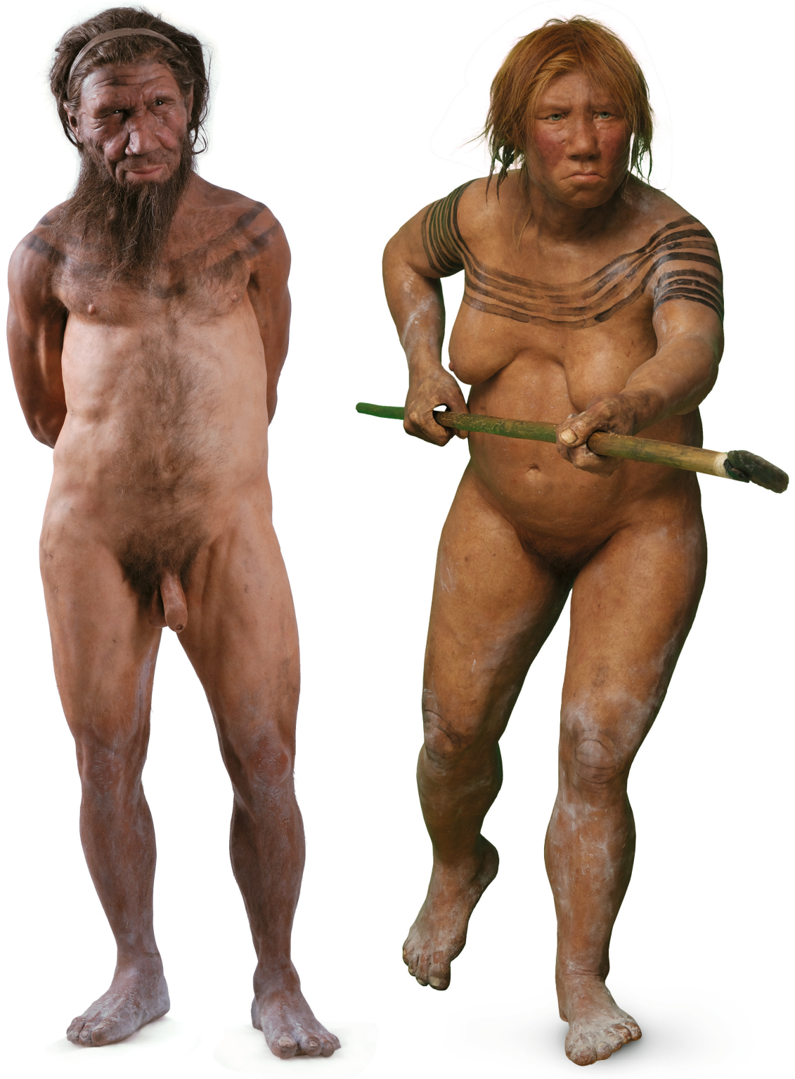
Reconstructie van twee Neanderthalers.