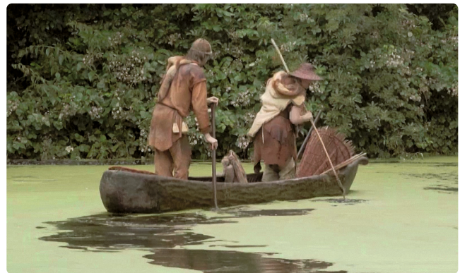
Met een rieten fuik op jacht naar vis in een boomstamkano.