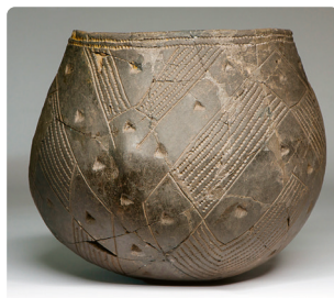
Aardewerken pot uit de Bandkeramische cultuur.

De zeearend en bonte specht hebben prachtige veren; die kunnen als versiering zijn gebruikt. De doorboorde honden-