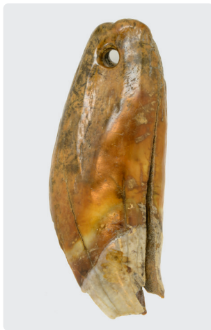
Doorboorde tand van een bruine beer, als hanger gebruikt.

Tegen het eind van deze periode bouwen kleine groepen bewoners de eerste eenvoudige houten hutjes. Ze wonen verspreid over een landschap van zandduinen, bossen, veenmoerassen en riviervlaktes, op de hoger gelegen stukken land. Deze bieden bescherming tegen overstromingen van de zee of de rivieren.