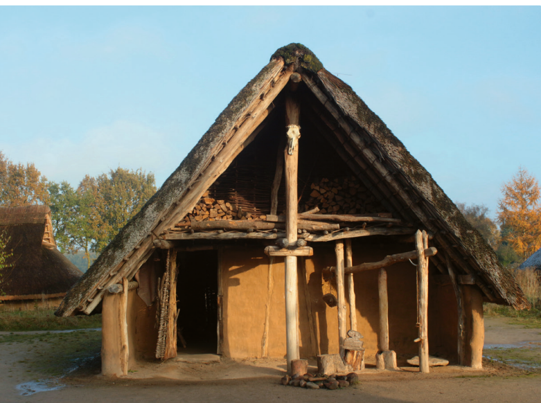
Reconstructie van een boerderij uit de late steentijd.

Nog steeds wonen er maar weinig mensen op het grondgebied dat nu Nederland heet. De complete bevolking zou in vier intercity's passen: zo'n 2000 mensen. Deze eerste landbouwers wonen op de bosrijke lössgronden. Met zware palen bouwen