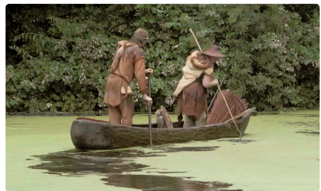
Met een rieten fuik op jacht naar vis in een boomstamkano.

De hele winter leven Trijntje en haar groep op dit rivierduin. De menukaart biedt volop keuze. Ze jagen op bevers, otters, wilde zwijnen, edelherten, wilde katten, boommarters, reeën, grijze zeehonden, gewone zeehonden en bunzings. Daarnaast eten ze buizerds, zeearenden, roodkeelduikers, kleine zwanen, wilde zwanen, rietganzen, smienten, grote zaagbekken, brilduikers en kraanvogels. Diverse eendensoorten, zwaan en zeearend staan het meest op het menu. Voor het vangen van vissen, vooral snoeken, gebruiken ze netten en fuiken.