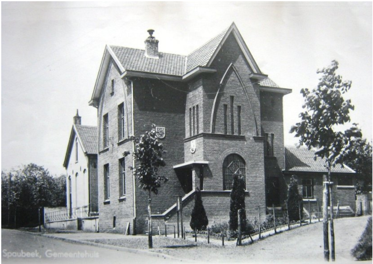
Voormalig Gemeentehuis van Spaubeek.