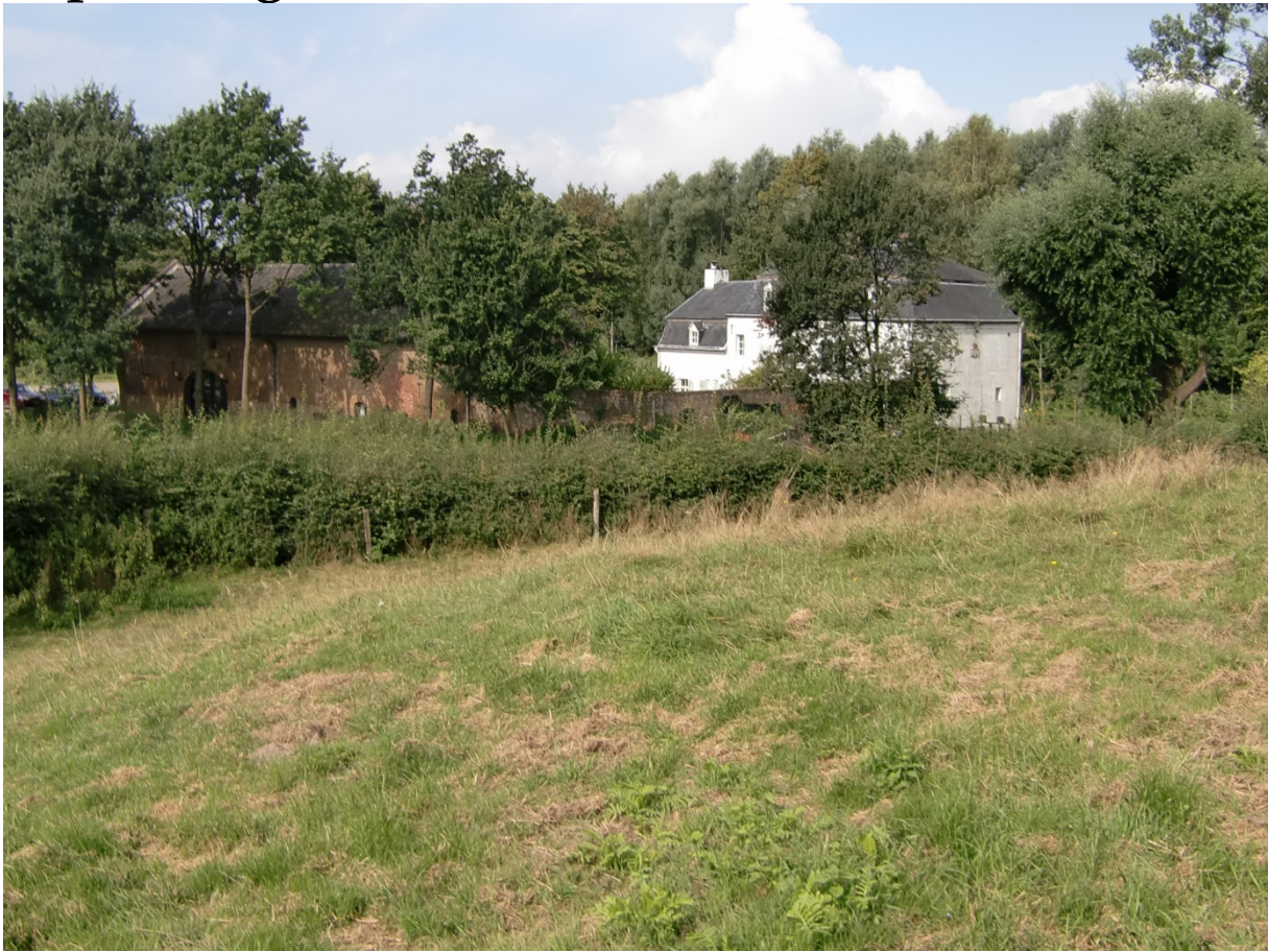
Sint-Jansmolen gezien vanaf de Pepelsberg.

In de buurt van het voormalige kasteel Sint-Jansgeleen komen we via het Beuke(n)boomsvoetpad bij de Pepelsberg (ook wel Pepersberg of Piepersberg geheten). Pepel is de benaming voor vlinder in het Limburgs. Wellicht kunnen we spreken van een vlinderberg .