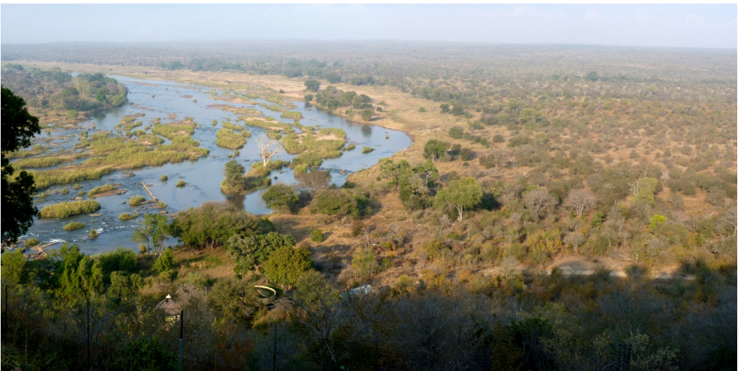
Uitzicht op de Olifants rivier vanaf het terras van onze bungalow in Olifants Restcamp (juli 2010)

niet van een leien dakje. In de bungalow bleken knaagdieren door het dak naar binnen gekomen te zijn en met elkaar tot bloedens toe gevochten te hebben. Na veel heen en weer geloop en gepraat bij de receptie greep uiteindelijk het hoofd van de huishoudelijke dienst in. Wij kregen een andere, wel schone bungalow. Hoe prachtig die lag, zagen we pas de volgende ochtend. Het uitzicht was echt geweldig. Overigens was dit de enige keer dat ons verblijf niet in orde was.