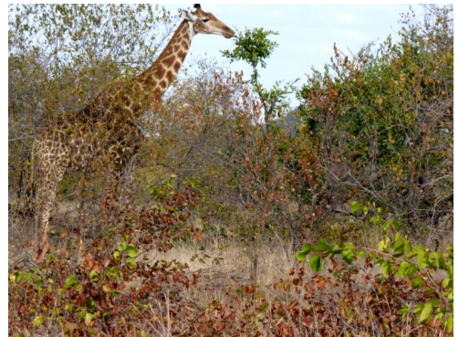
Giraf langs de H9 (25 juli 2010)

Rijden mag op asfaltwegen overigens niet harder dan 50 km/uur en op gravelwegen 40 km/uur. Je zult echter merken dat die snelheden aan de hoge kant zijn, wil je goed het wild kunnen zien. Naarmate