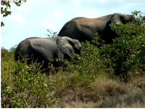
Olifanten langs de S46 (26 juli 2010)

Een stukje verderop was het weer raak: een leeuw zichtbaar tussen het struikgewas. Je zou haast denken dat het heel normaal is om verschillende keren op een dag leeuwen tegen te komen. Dat is het echter niet. Er zijn dagen dat je geen leeuw tegenkomt. Twee keer leeuwen zien in een tijdsbestek van nog geen vier uur is wel heel bijzonder. Deze leeuw