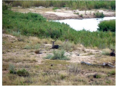
Waterbokken langs de S93 (26 juli 2010)

Onderweg naar Letaba kwamen we ook nog een kleine kudde olifanten tegen. De grootste klapperde flink met haar oren. We hadden gelezen dat ze dan agressief konden zijn, en zijn daarom snel doorgereden. Later beseften we dat het klapperen met de oren niet voor ons bedoeld was, maar om haarzelf te verkoelen.