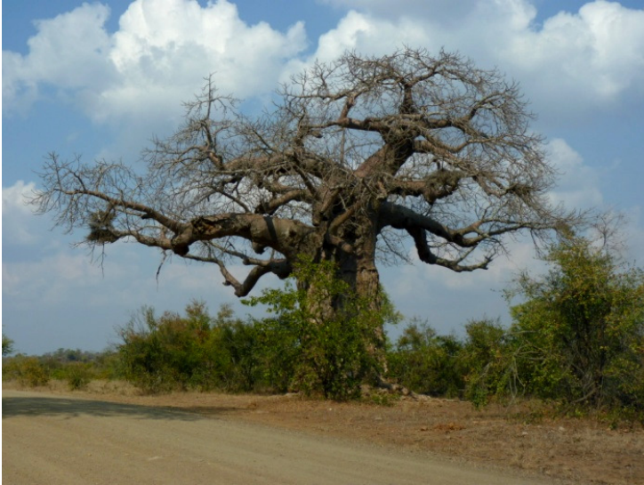
Von Wielligh's baobab bij de kruising van de S44 en S93 (26 juli 2010)

Aan de S44 bij de splitsing met de S93 staat ook een grote baobab-boom. Deze is vernoemd naar Von Wielligh die in de 19 e eeuw deze streken heeft verkend. Hij