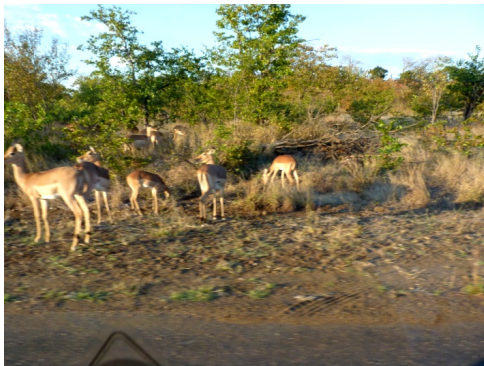
Impala's langs de H9 (25 juli 2010)

Je kunt één of meerdere dagen toegang tot het Krugerpark krijgen. In het eerste geval is het zaak dat je vroeg het park binnengaat, want er worden per toegangspoort slechts een beperkt aantal bezoekers toegelaten. Als je meerdere dagen in het Krugerpark wilt verblijven, moet je accommodatie in het park gereserveerd hebben. Daarbij is dan meteen je toegang tot het park geregeld. In beide gevallen moet wel nog de toegangsfee betaald worden. Verblijf je voor wat langere tijd in het park, dan kan een 'wildcard', die je een jaar lang toegang geeft tot onder meer het Krugerpark, voordeliger zijn.