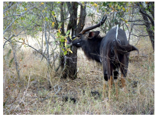
Mannetjes nyala langs de S44 (26 juli 2010)

Rond 13.30 uur zat onze eerste tocht door het Krugerpark erop, konden we gaan nagenieten en bedenken wat we de rest van de dag zouden gaan doen. Onze