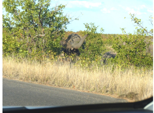
Olifanten langs de H9 (25 juli 2010)

je er meer ervaring in hebt, zal dat overigens steeds beter gaan. En je weet natuurlijk niet wat je niet gezien hebt. Met meerdere personen in de auto zul je trouwens eerder dieren opmerken. En stilstaande auto's op de weg zijn ook meestal een signaal dat er iets bijzonders te zien is.