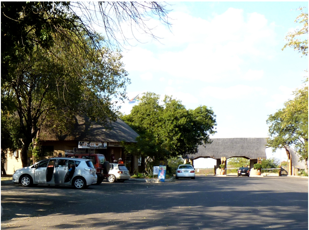
Phalaborwa toegangspoort tot het Krugerpark (25 juli 2010)

In het grootste deel van dit boek staan mijn belevissen en ervaringen in het Krugerpark centraal. Die ervaringen worden gelardeerd met foto's. Daarbij wil ik laten zien hoe het 'echt' is. Er zijn dus niet alleen 'mooie plaatjes' uit een reisgids of film opgenomen, maar ook minder mooie foto's. Juist daardoor vormen ze een goede illustratie van wat ik beschrijf. Bovendien geeft dat een reëler beeld van het Krugerpark. En dat is precies mijn bedoeling. Laten we het Krugerpark binnengaan.