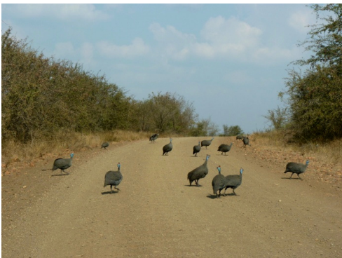
Helmpareldoenders op de S44 (26 juli 2010)