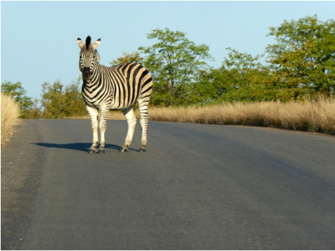
Zebra op de H9 (15 juli 2010)