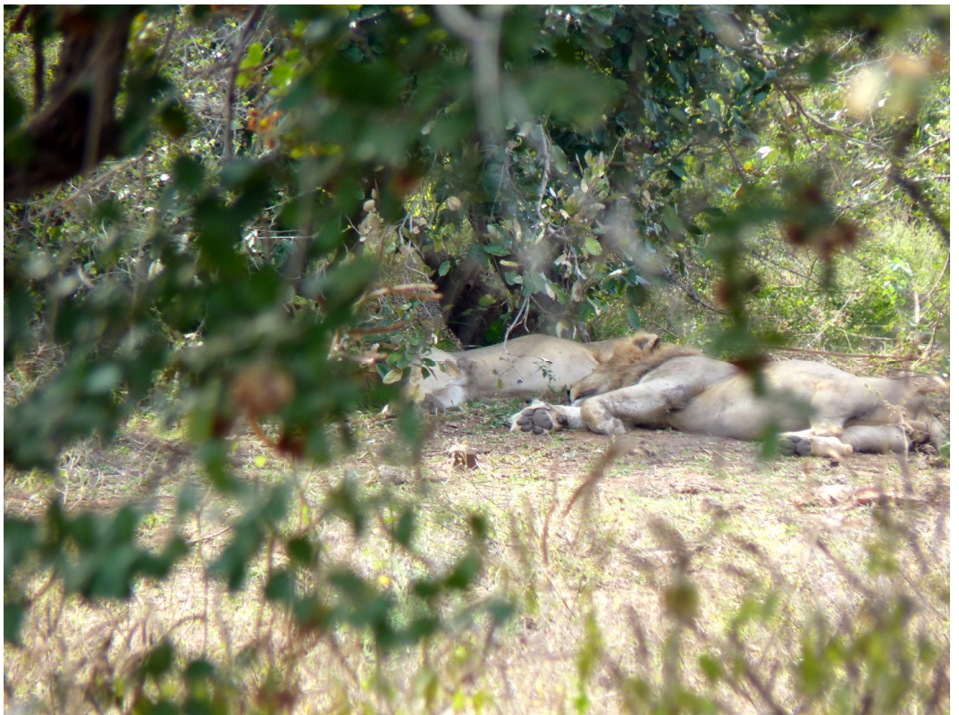
Onze eerste 'eigen' leeuwen langs de S93 op weg van Olifants Restcamp naar Letaba (26 juli 2010)

We besloten om van Olifants Restcamp naar Letaba Restcamp te rijden, zoveel mogelijk over gravelwegen. Op de heenweg naar Letaba reden we het grootste deel de wegen die niet langs de Letaba rivier lagen (S93, S46, S94), terwijl we op de terugweg naar Olifants Restcamp juist de wegen langs de Letaba reden (S46, S93, S44). Het laatste deel ging vrij steil omhoog, maar gaf wel een mooi uitzicht over de Letaba en de Olifants rivieren.