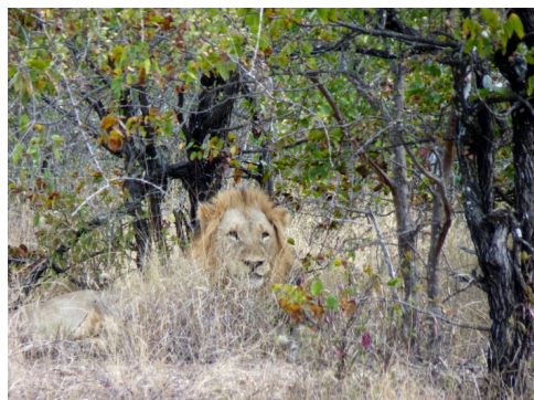
Leeuw langs de S46 (26 juli 2010)

was mager in vergelijking met de eerdere leeuwen. Hij liep tussen het struikgewas en ging in het gras liggen. Zo van een afstand maakte hij een vriendelijke indruk. Je zou niet zeggen dat dit het machtigste roofdier van het Krugerpark is.