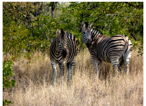
Nijlpaard en zebra's langs de S93 (26 juli 2010)