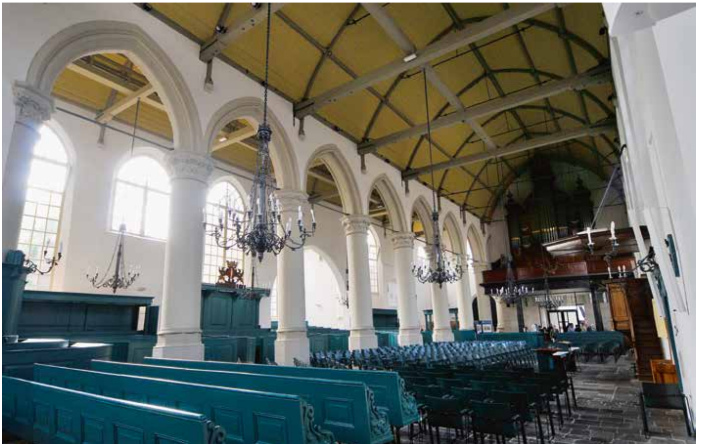
Interieur van de huidige Augustijnenkerk

Het Dordtse klooster maakte deel uit van de Keulse Provincie. Dat het klooster aanzien had, blijkt uit het feit dat de belangrijkste vergadering, het Provinciaal Kapittel, diverse malen hier plaatsvond. Vertegenwoordigers van alle tot de Provincie behorende kloosters kwamen dan bijeen onder leiding van de prior-provinciaal. Zo verzamelden de kapittelvaders zich op 29 september 1489 in Dordrecht in de kapittelzaal van het klooster. Ook had het Dordtse klooster naam als studiecentrum. Van hieruit trokken jonge augustijnen na hun vooropleiding naar het buitenland om verder te studeren aan beroemde kloosterscholen en universiteiten.