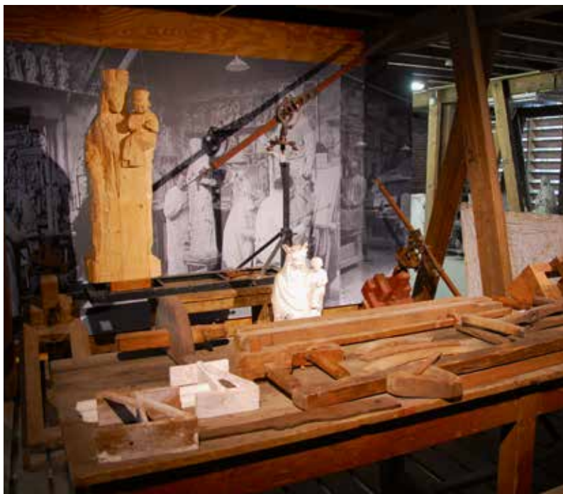
Evocatieve opstelling van de punteertechniek voor het maken van houten beelden in de houtloods van het Cuypershuis.