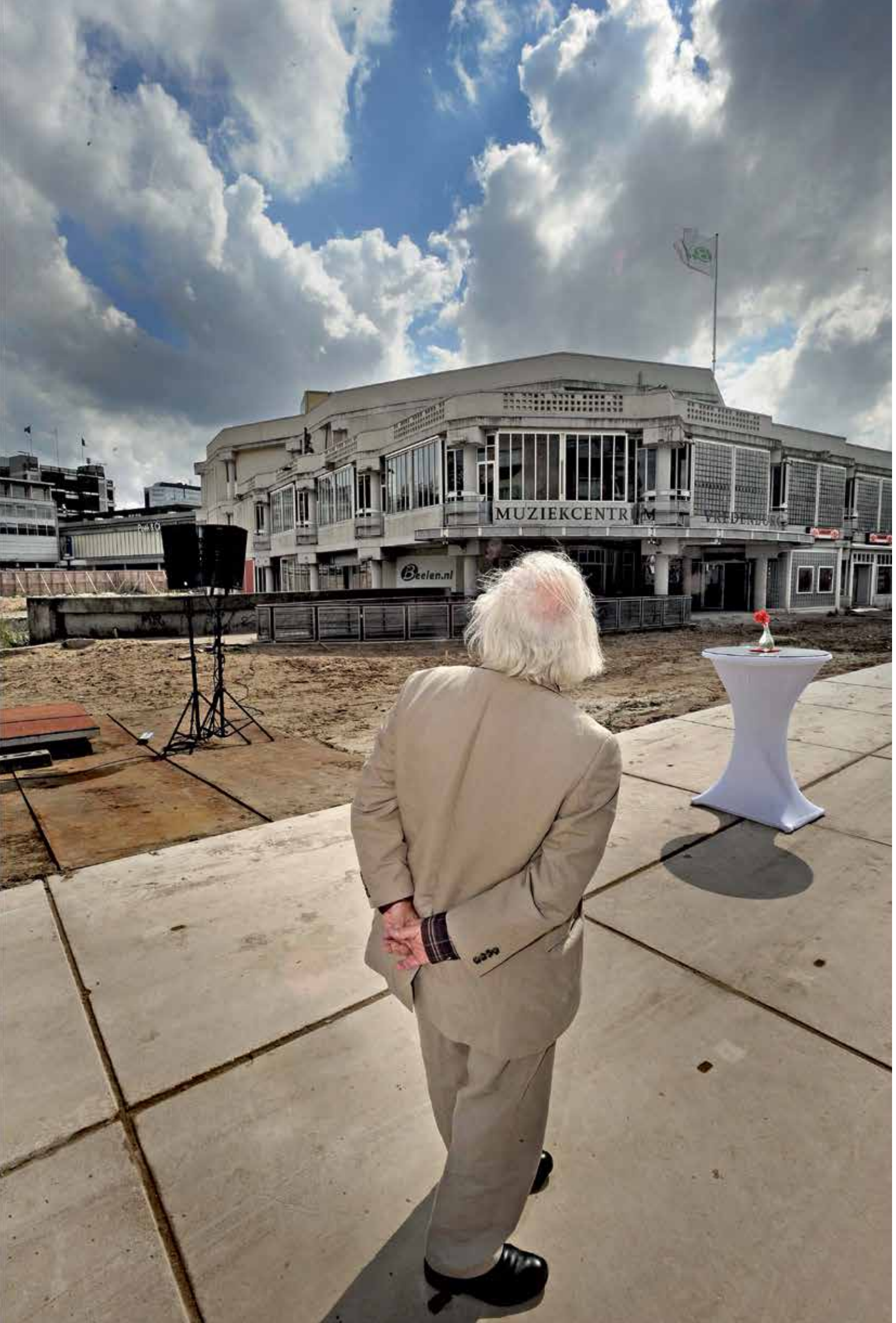
SMAKKELAARSVELD (TIVOLIVREDENBURG IN AANBOUW), 2011 VREDENBURG (ARCHITECT HERTZBERGER), 2008