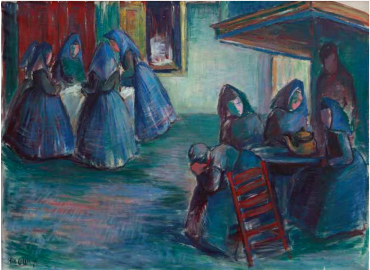
118 Stien Eelsingh , Sterfhuis , olieverf op doek, 71,5 x 95,5 cm, Museum de Fundatie