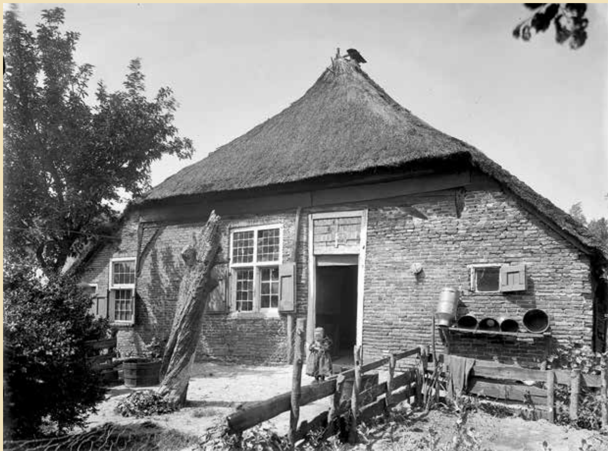
001 Boerderij in Staphorst, 1917, Rijksdienst voor het Cultureel Erfgoed (foto C.J. Steenbergh)