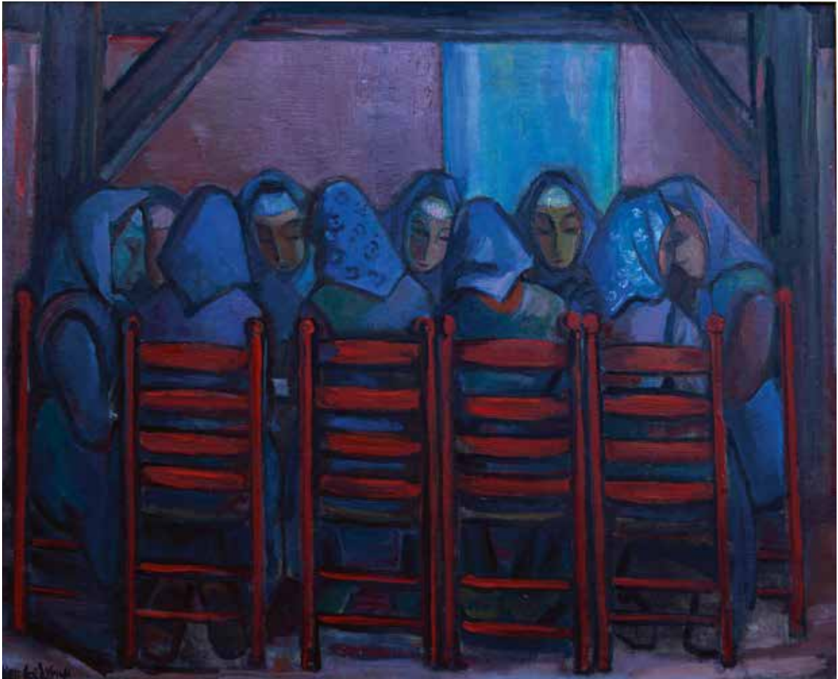
119 Stien Eelsingh , Begravenismaal , 1954, olieverf op doek, 88 x 110 cm, Museum de Fundatie