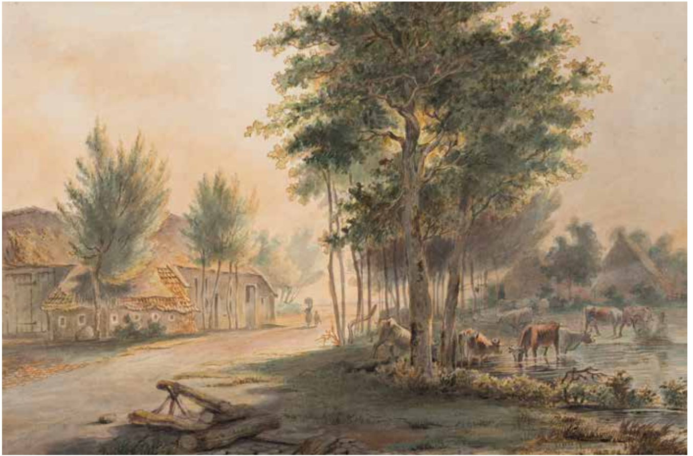
afb. 016 Sybolt Berghuis , Gezicht op Rhee , 1862, aquarel op papier, 25,5 x 38,7 cm, Drents Museum