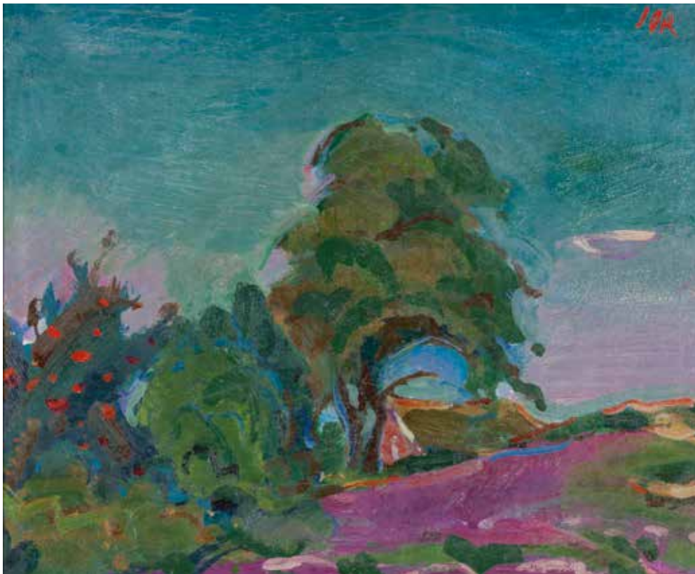
afb. 167 Jan Jordens , Landschap bij Gasselte , 1927, olieverf op doek, 29,5 x 36 cm, Drents Museum