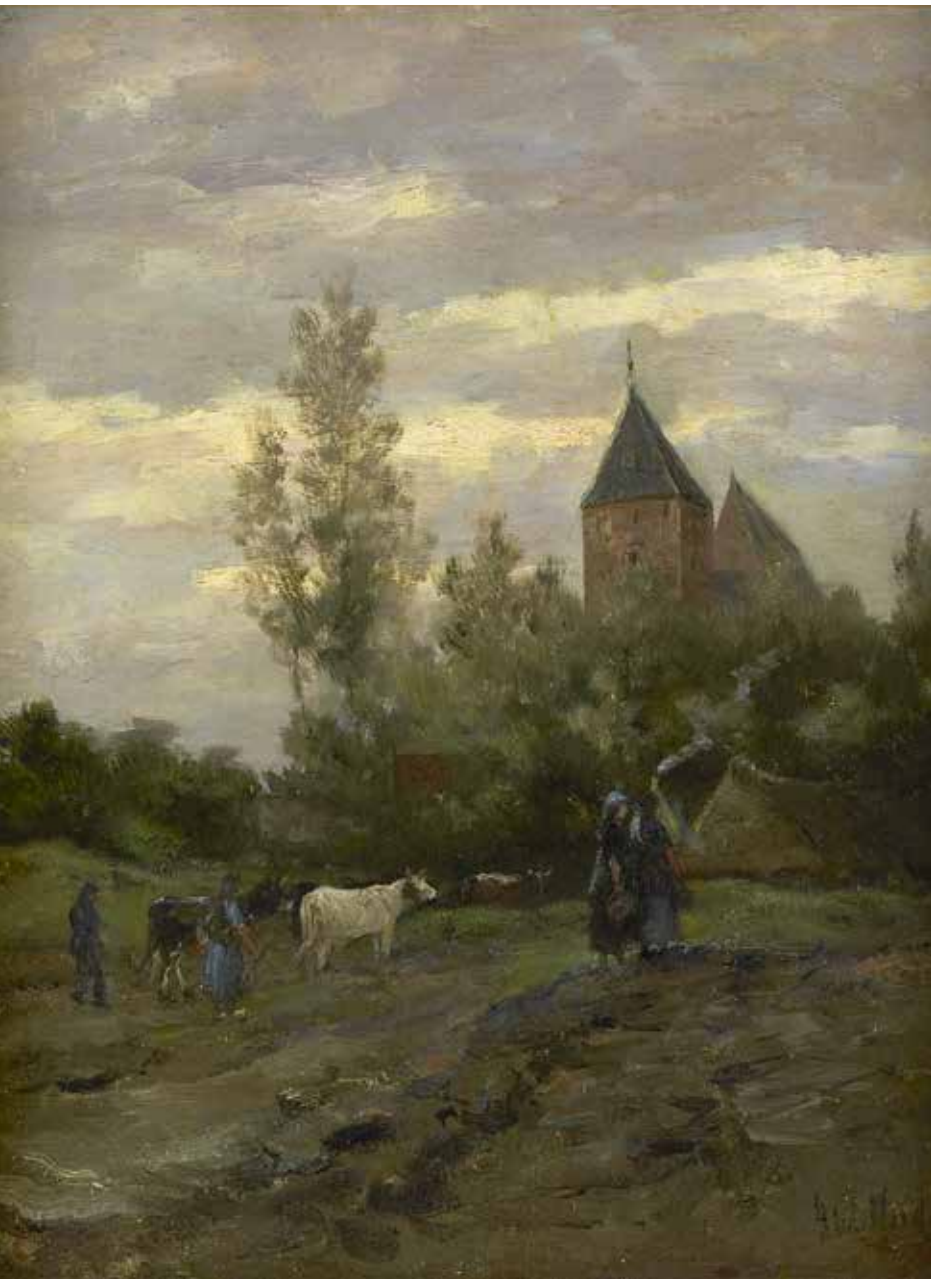
afb. 069 Hendrik Willem Mesdag , Gezicht op de kerk van Vries , 1851, olieverf op doek, 52 x 41 cm, Drents Museum