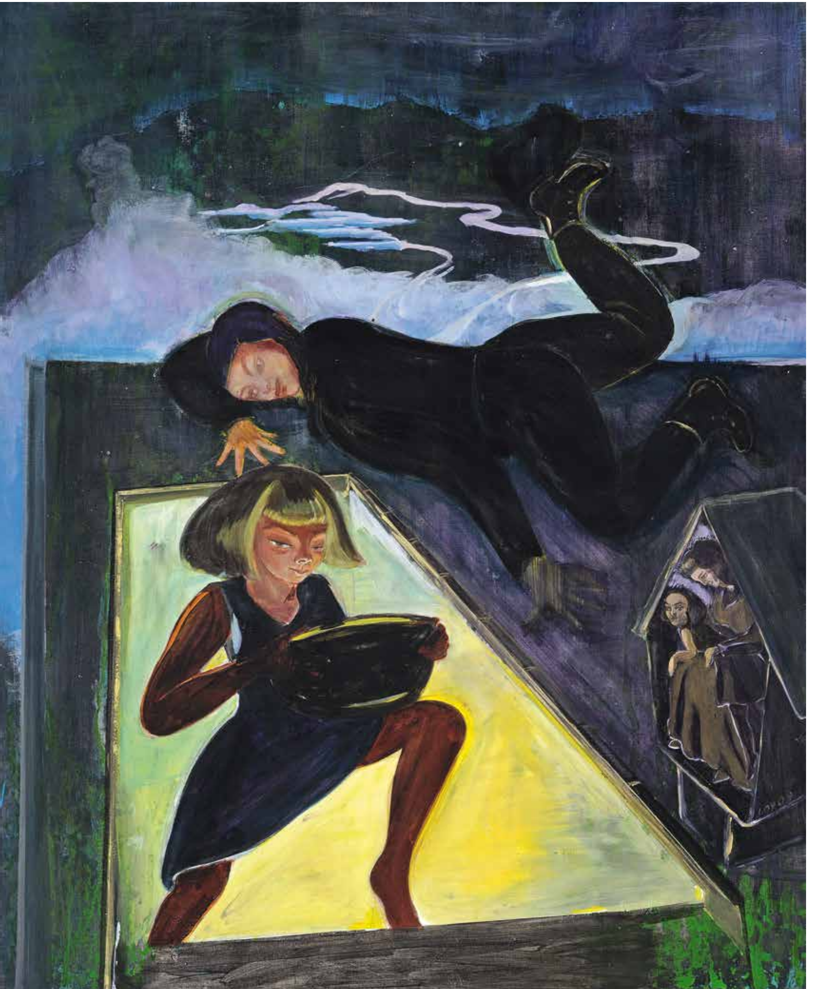
Aanbidding / Anbetung