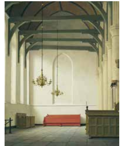
Henk Helmantel De zuidbeuk van de St. Nicolaaskerk in Monnickendam 1988 193 x 153 cm Museum Helmantel Westeremden

Abstractie vertrouwde Helmantel niet helemaal: 'De abstracte kunst is een gegeven waar je niet aan voorbij kunt gaan,' verklaarde hij nog in 1978 in een interview: 'De abstracte kunst is een laatste stap in een hele reeks eerder gedane stappen. Het is typisch een eindstation waarin je eigenlijk onmiddellijk rechts-