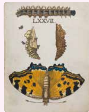
SCHOONE BOTER-KAPELLE (GROTE VOS), AFBEEELDING LXXVII, DEEL 1, 1660, VROEGSTE AFBEEELDING IN DE GESCHIEDENIS, WAAROP ZOWEL EEN VOLLEDIGE METAMORFOSE, ALS VAN HET WERK VAN SLUIPWESPEN TE ZIEN IS.