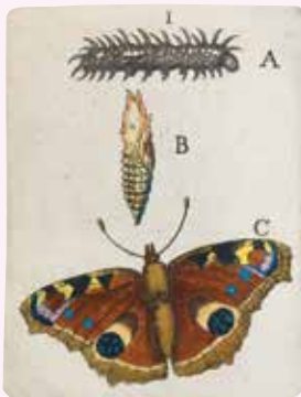
PAEUW-OOG (DAGPAUWOOG), AFBEELDING I, DEEL I, 1660,

Goedaerts beschrijvingen van de Twee-steert geven een goed beeld van zijn pionierswerk en zijn doorzettingsvermogen. Goedaert behandelt de Twee-steert, die tegenwoordig hermelijnvlinder heet, in elk deel van zijn werk. In het eerste deel bespreekt hij bij Bevindinge LXV alleen de rups, die van groen in rood veranderde en na twee dagen stierf. In het tweede deel bespreekt hij de soort opnieuw. Nu veranderde de rups tot Goedaerts grote verbazing, 'so dat zijn verstand als verstellt ende