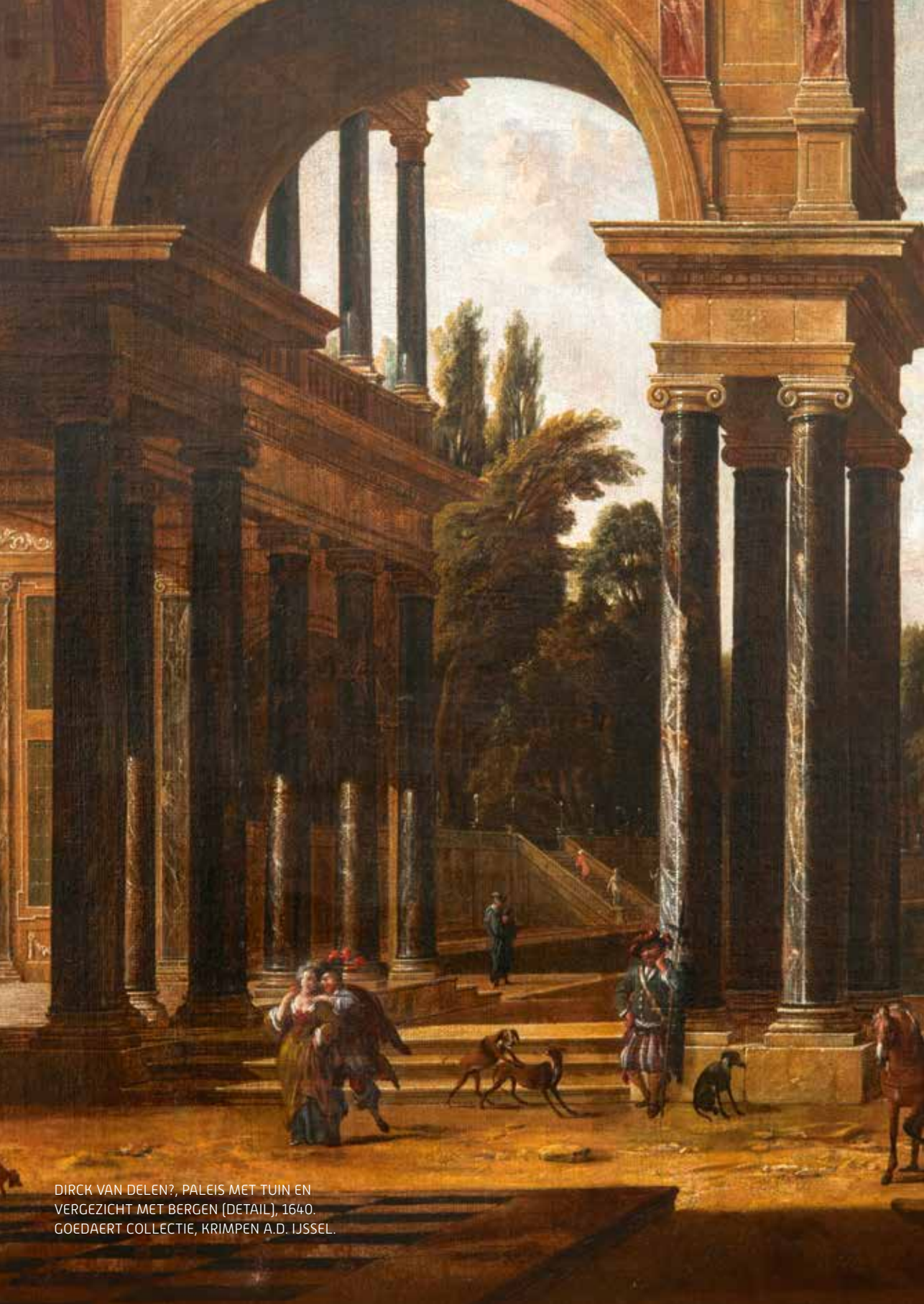
DIRCK VAN DELEN?, PALEIS MET TUIN EN VERGEZICHT MET BERGEN (DETAIL), 1640. GOEDAERT COLLECTIE, KRIMPEN A.D. IJSSEL.