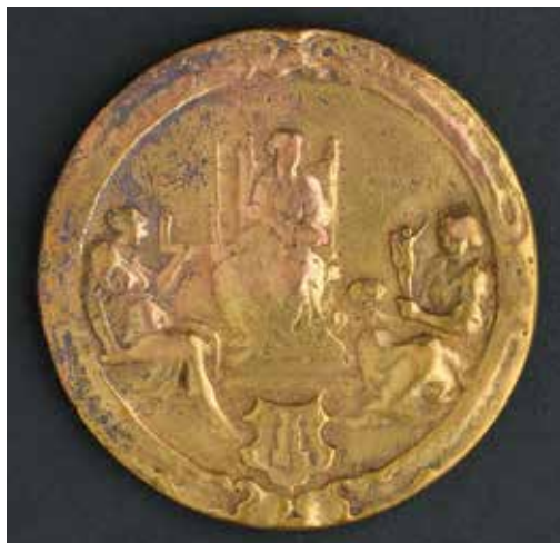
4 EN 5. PENNING VAN HET ST. LUCASGILDE TE MIDDELBURG, 1653. ZEEUWS MUSEUM, COLL. KZGW.

aantal vakgenoten zo klein en de concurrentie van beunhazen blijkbaar zo groot dat Van Anthonissen zich in januari 1676 met twee vakgenoten tot het stadsbestuur richtte om nieuwe regels te bepleiten. 8 Zij stelden voor aspirant-schilders voortaan een proefstuk te laten maken, zoals ook in verschillende Hollandse steden inmiddels gebruikelijk was. Ook zou openbare verkoop van schilderijen binnen de stad alleen voorbehouden moeten zijn aan vrije meesters. De burgemeesters hadden begrip voor hun klachten en besloten in juni van hetzelfde jaar de verkoop van schilderijen op openbare veilingen aan banden te leggen. Daarnaast werd bepaald dat niemand 'sal vermogen eenige hujsen, solders, schoorsteenmantels, vendels, calessen of rouwwapens etc te schilderen ofte vergulden' tenzij deze met succes een proefstuk had gemaakt dat door de deken en hoofdmannen van het gilde in aanwezigheid van de reeds lid zijnde schilders werd geaccepteerd. De proef moest bestaan uit het maken van een cartouche 'hebbende in t midden een Ossenhoofd, en voorts het wapen van St. Lucas'. Het is opvallend dat het hierbij louter om decoratief schilderwerk en niet om het maken van schilderijen ging (afb. 3).