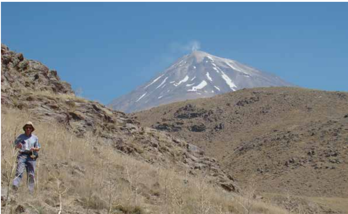
Het hoogste punt in Iran is de top van de Damavand vulkaan in het Alborz gebergte. Deze reikt tot 5700 m.

nere en grote vlaktes. Deze opbouw is grotendeels ontstaan in de laatste twaalf miljoen jaar als gevolg van het op en over elkaar schuiven van verschillende schollen van de aardkorst. Het Zagros gebergte is daarbij het meest actieve deel van het land. De grote hoeveelheid aardbevingen die Iran niet alleen recent maar ook in het verleden hebben geteisterd, zijn een direct gevolg van al die tektonische bewegingen in de aardkorst. Alles bij elkaar is dat ook een van de belangrijkste factoren geweest voor hoe het natuurlijke en het historische landschap er nu