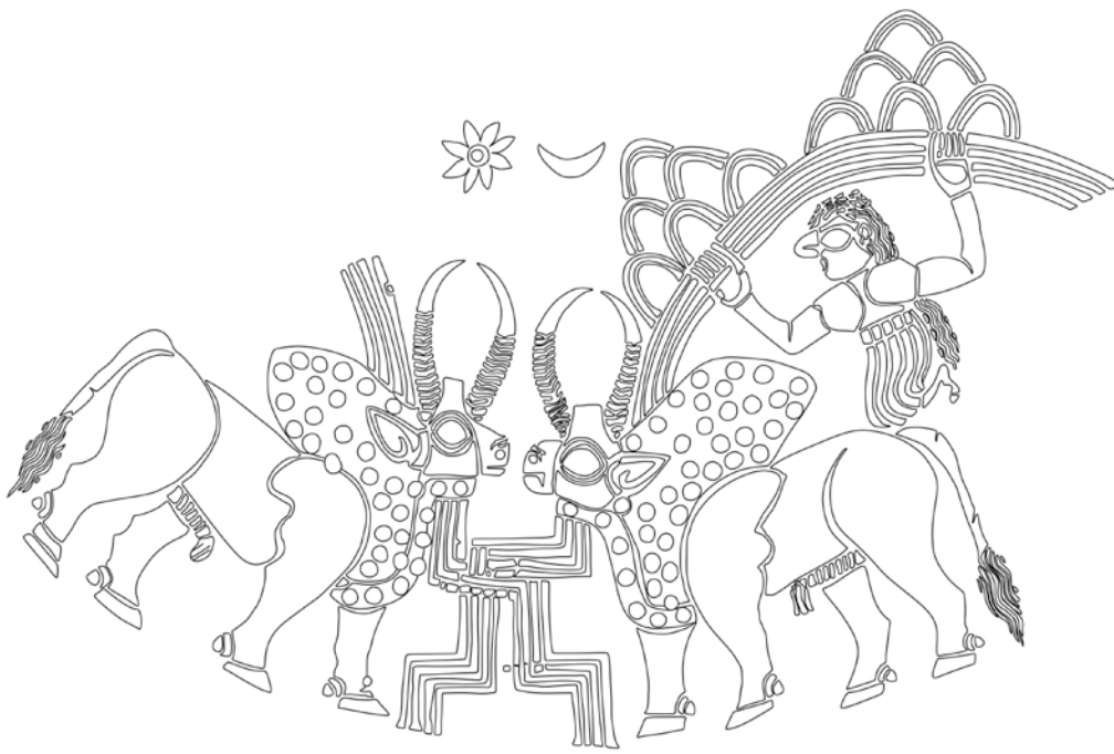
Spekstenen kan (H. 18 cm) uit Jiroft. Datering 2600-2400 v.Chr. (zie ook blz. 68).