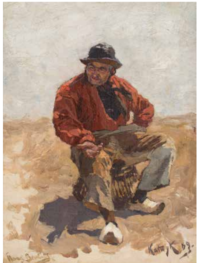
Mijmering (Katwijk) , olieverf op doek 47,6 x 33,3 cm, collectie Simonis & Buunk Kunsthandel, Ede, 10741