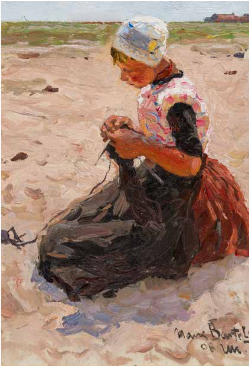
HANS VON BARTELS , Vrouw en drie kinderen, Urk, 'UK(19)08' , aquarel, 46,7 x 33,8 cm, collectie Museum Het Oude Raadhuis Urk

Breïend Urker meisje op de Staart, 'UK (19)08' , olieverf op doek, 32 x 22 cm, particuliere collectie