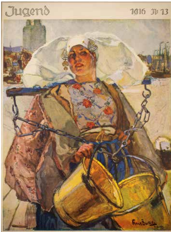
HANS VON BARTELS , Jong meisje van Rijsoord , Dordrecht op de achtergrond, 'München', gouache, 100 x 80 cm, collectie Lieveland