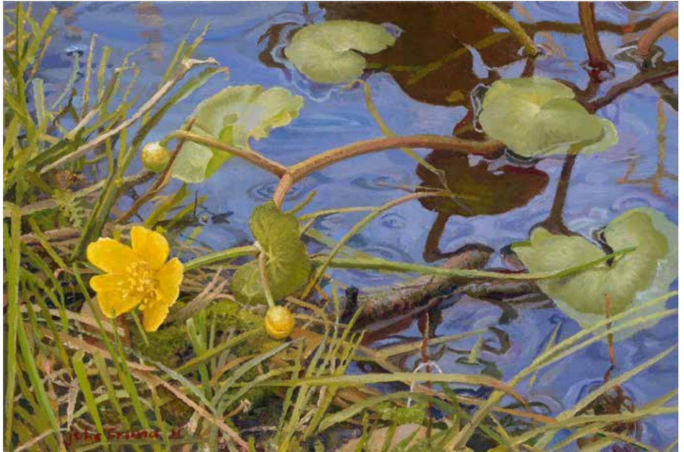
Dotters met water , 2011 olieverf op paneel, 16 × 24 cm