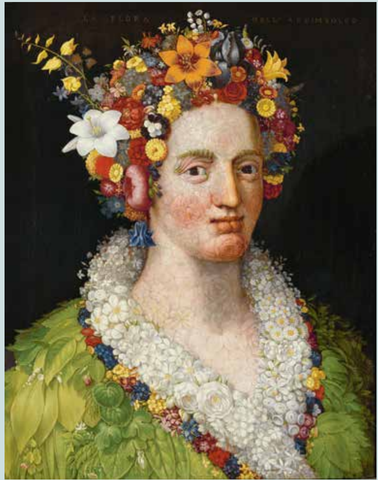
Giuseppe Archimboldo, Flora , ca. 1591