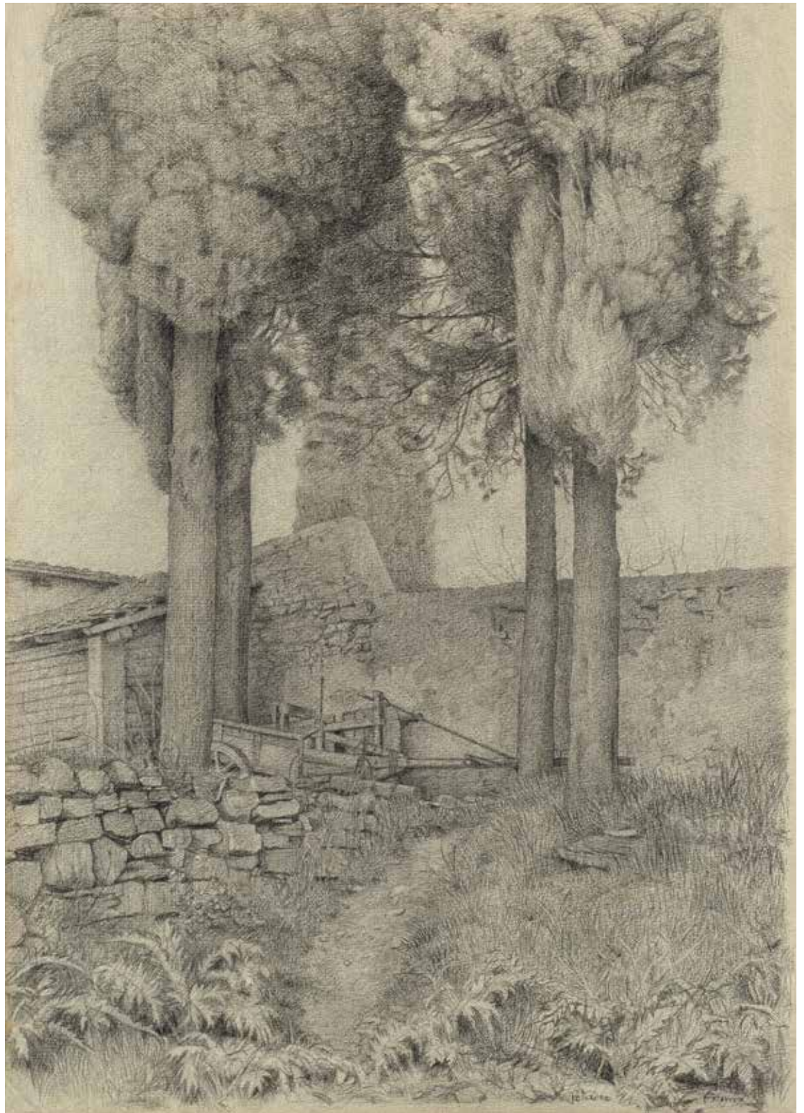
Cypressen bij Valiano , 1979 houtschoolpotlood op Ingres, 40 × 28 cm