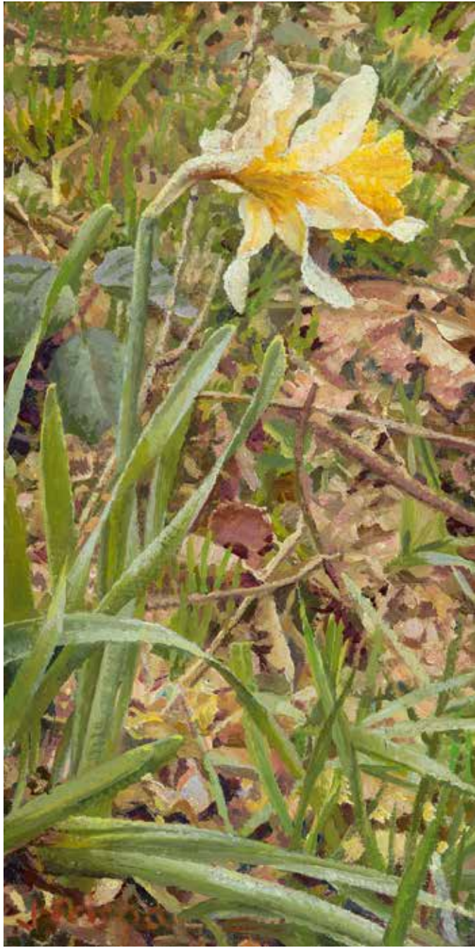
Wilde Narcis , 2009 olieverf op paneel, 20 × 10 cm