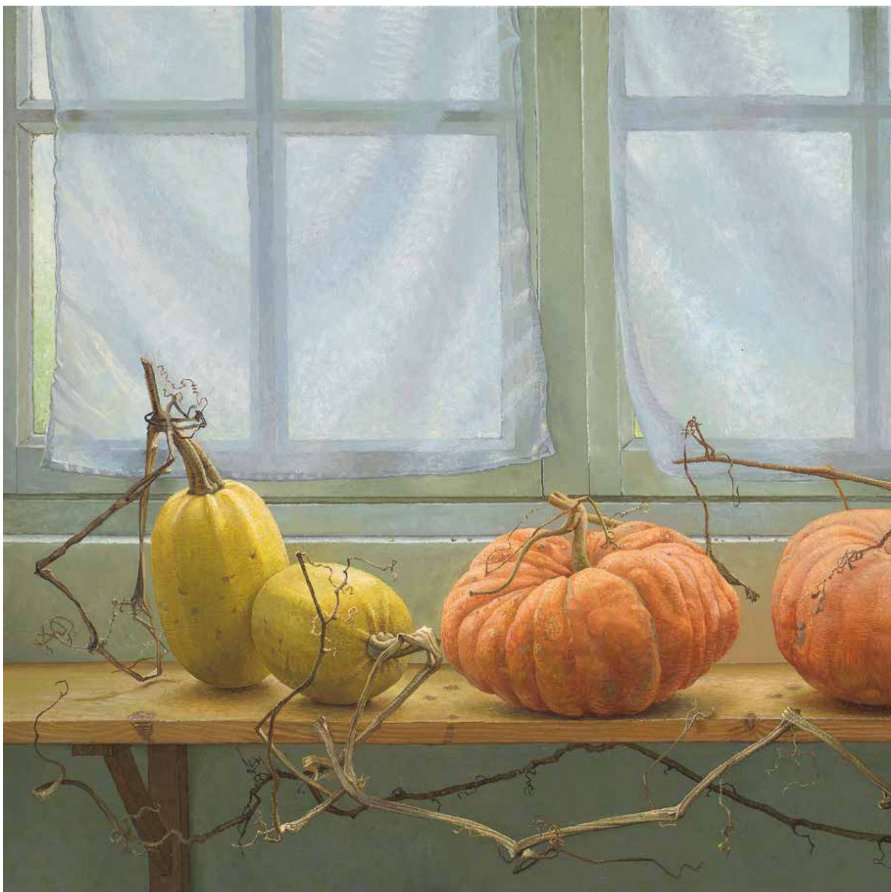
Het zachte wachten , 2003 olieverf op linnen, 70 × 140 cm