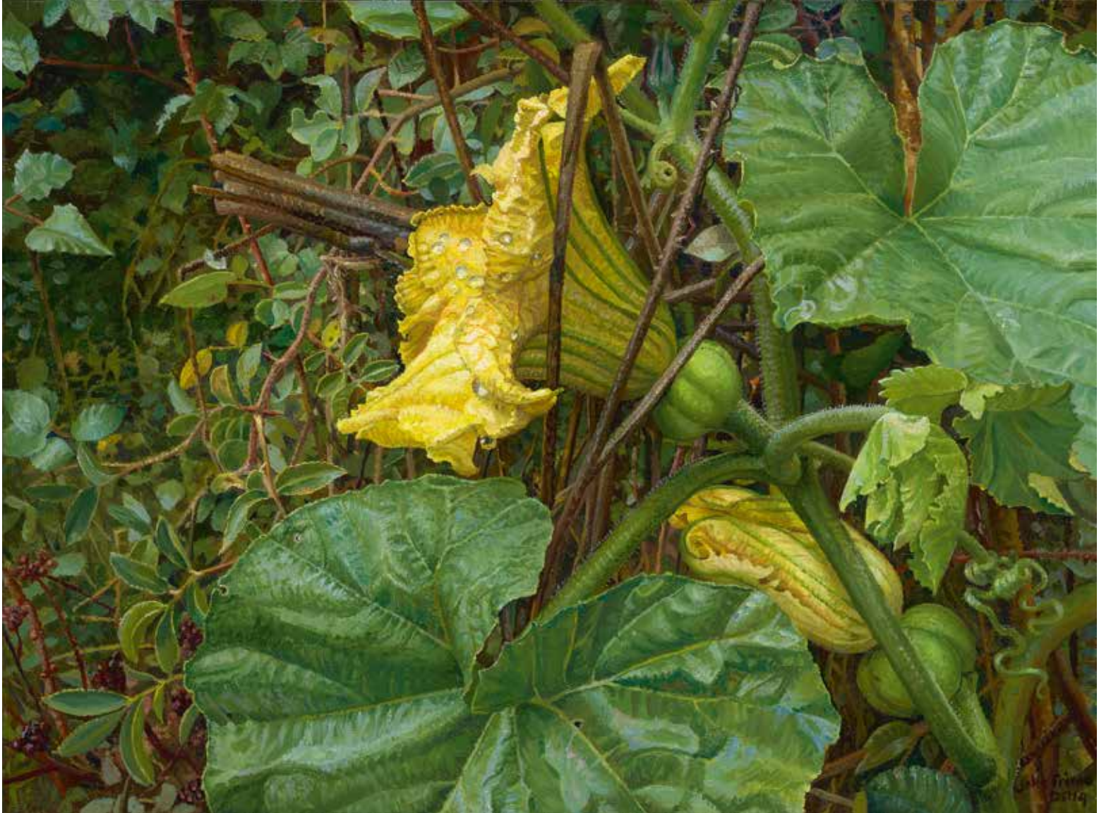
Vruchtbeginsel , 2014 olieverf op paneel, 29 × 39 cm