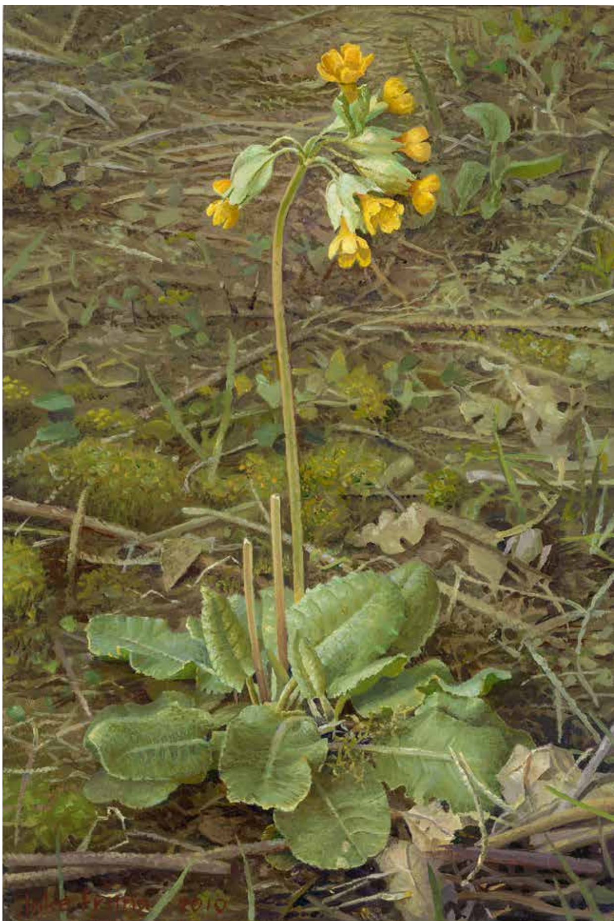
Sleutelbloem , 2010 olieverf op paneel, 30 x 20 cm