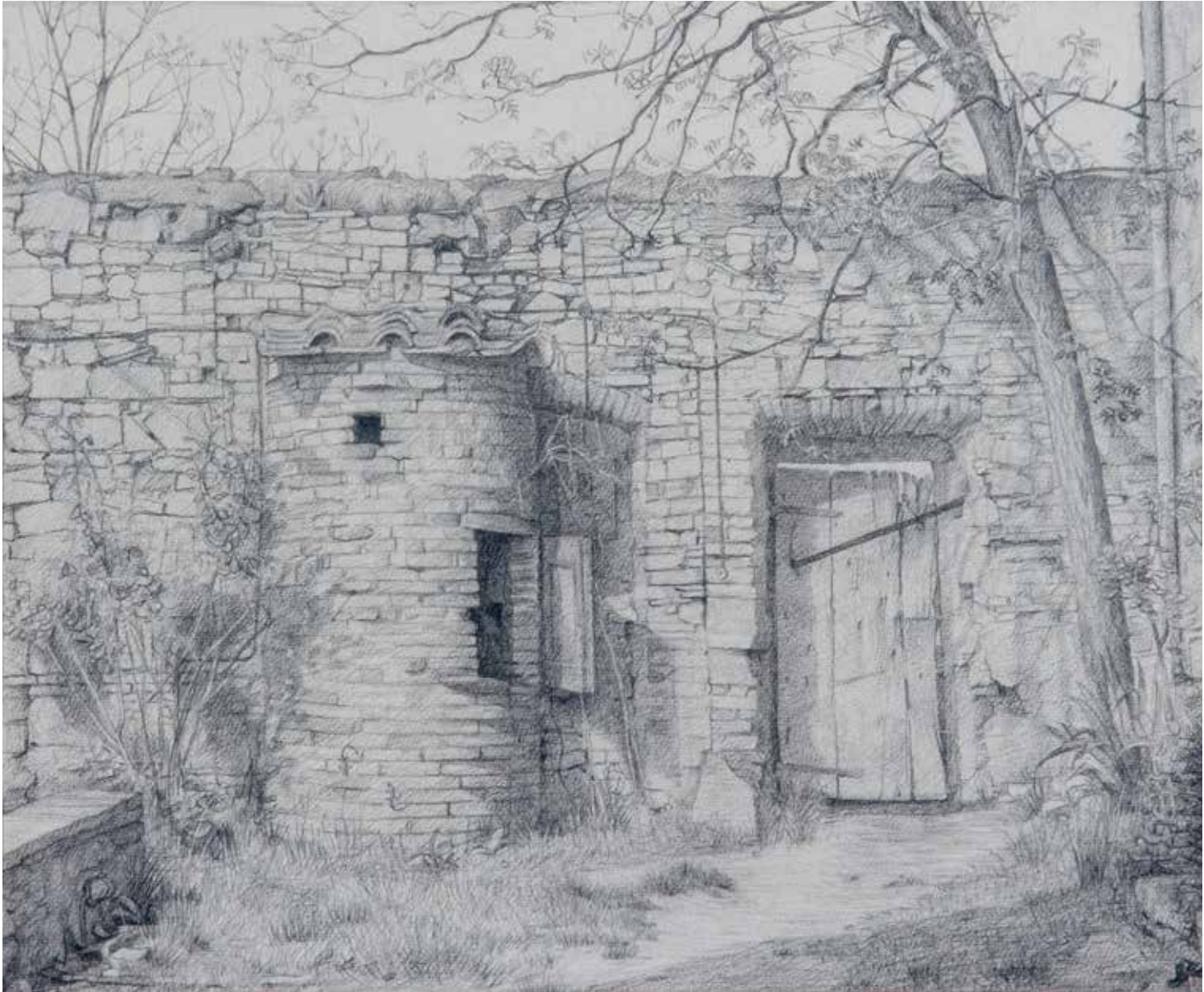
Put in muur in Valiano, 1980 houtskoolpotlood op Ingres, 24,5 × 30,5 cm