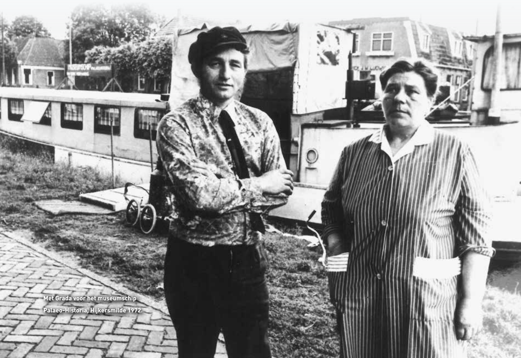
Met Grada voor het museumschip Palaeo-Historia, Hijkersmilde 1972.

M. Jones (ed.), Fake? The art of deception , Londen 1990, 16.