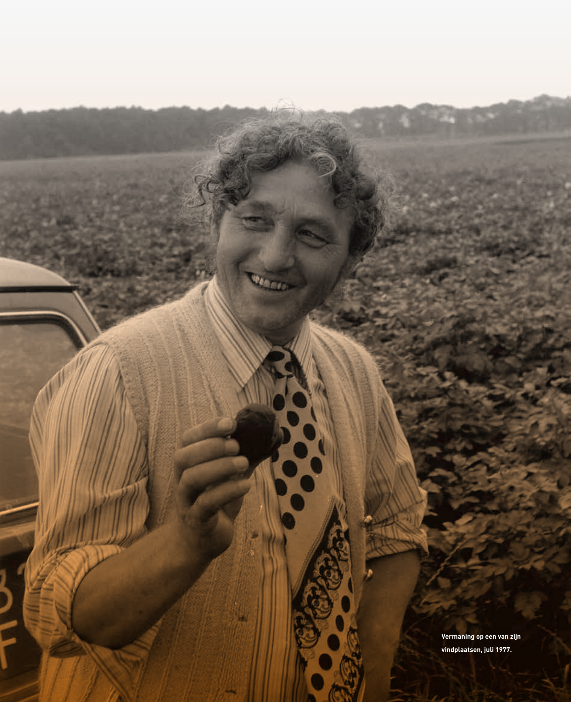
Vermaning op een van zijn vindplaatsen, juli 1977.