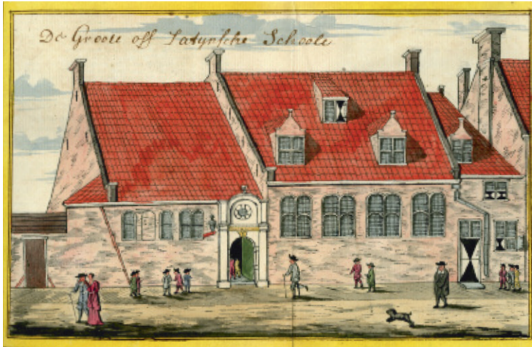
Latijnse school van Delft aan de Schoolstraat met het in 1620 toegevoegde schoolpoortje, naar ontwerp van Hendrick de Keyser.

Met godsdienst werd niet gespot. De dag werd geopend en gesloten met gebed en op zondag werden de leerlingen geacht twee keer naar de kerk te gaan. Vanzelfsprekend werd de Heidelbergse catechismus, het calvinistische leer- en lesboek van de christelijke leer, bestudeerd. Honderdnegentwintig vragen en antwoorden die, in het Latijn én in het Nederlands, uit het hoofd geleerd moesten worden. Daarnaast was er ruimte om de Psalmen van David te zingen.