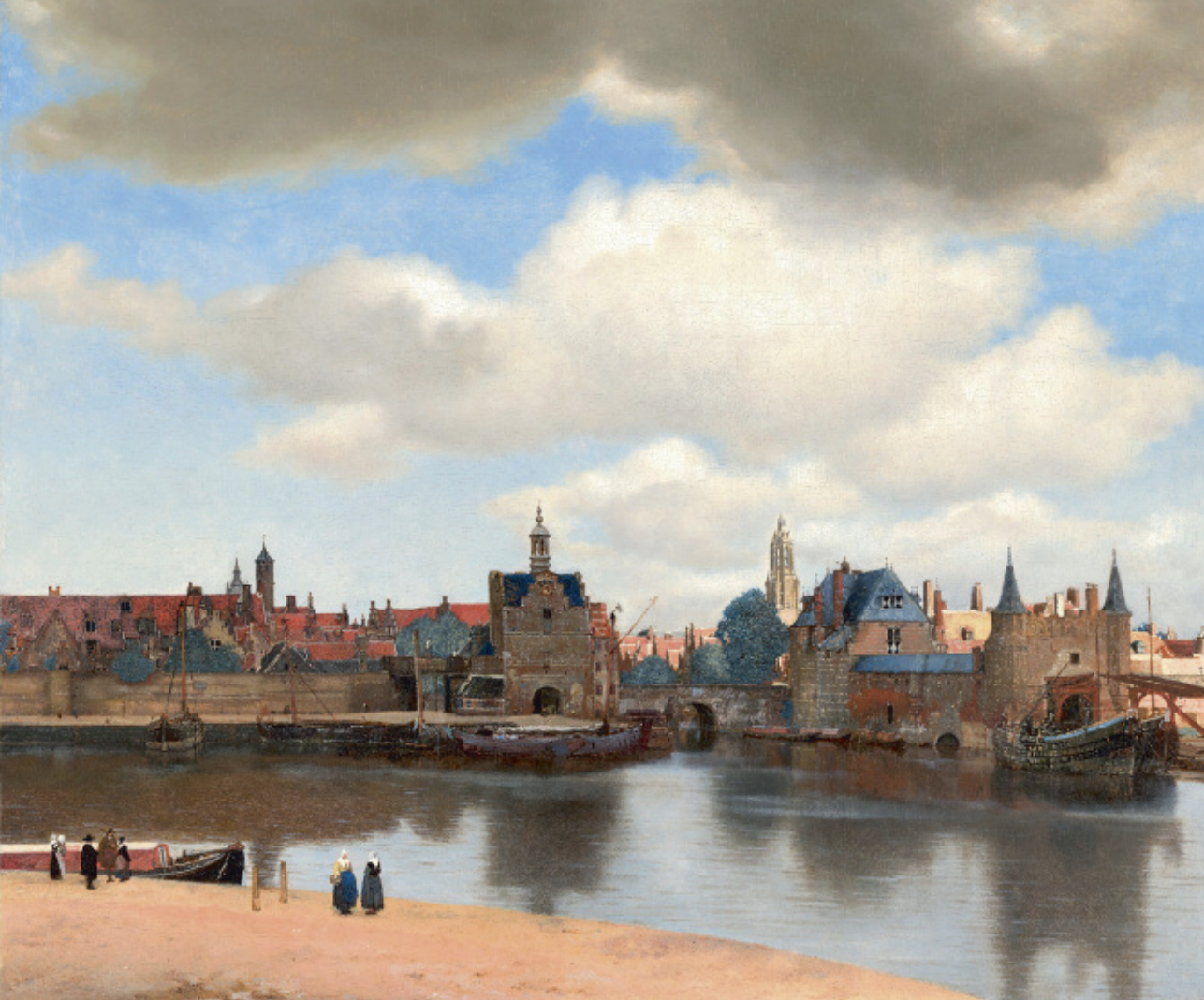
Gezicht op Delft, circa 1660, door Johannes Vermeer.

fel gedragen en iemand met zijn verjaardag feliciteren. Om zich in het gebruik van het Latijn te trainen werden er in de verschillende leerjaren dispuutwedstrijden gehouden.