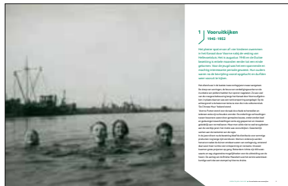
1 Vooruitkijken 4 1945-1952