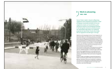
3 Werk in uitvoering 44 1953-1959