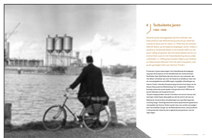
4 Turbulente jaren 74 1960-1968