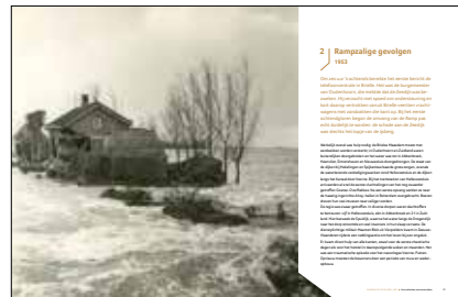
2 Rampzalige gevolgen 26 1953