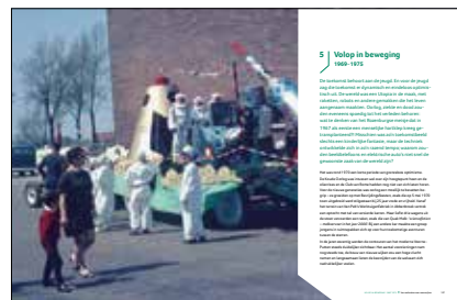
5 Volop in beweging 106 1969-1975