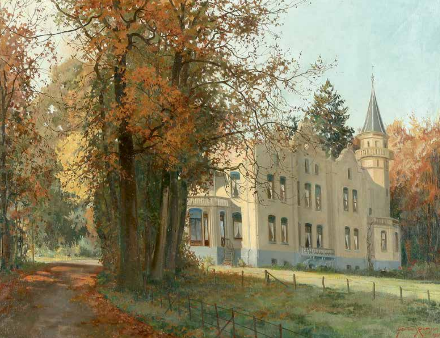
Herman Romijn , Het landhuis De Hemelsche Berg te Oosterbeek , 1940, olieverf op doek, 50 x 65 cm, particuliere collectie Oosterbeek