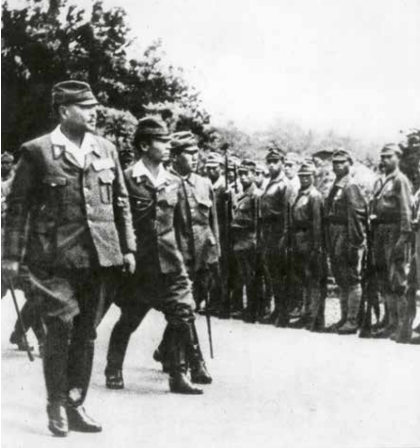
De Japanse opperbevelhebber generaal Hadara tijdens de inspectie van de Indonesische cadetten, in opleiding om tegen 'het Westen' te vechten, 1943