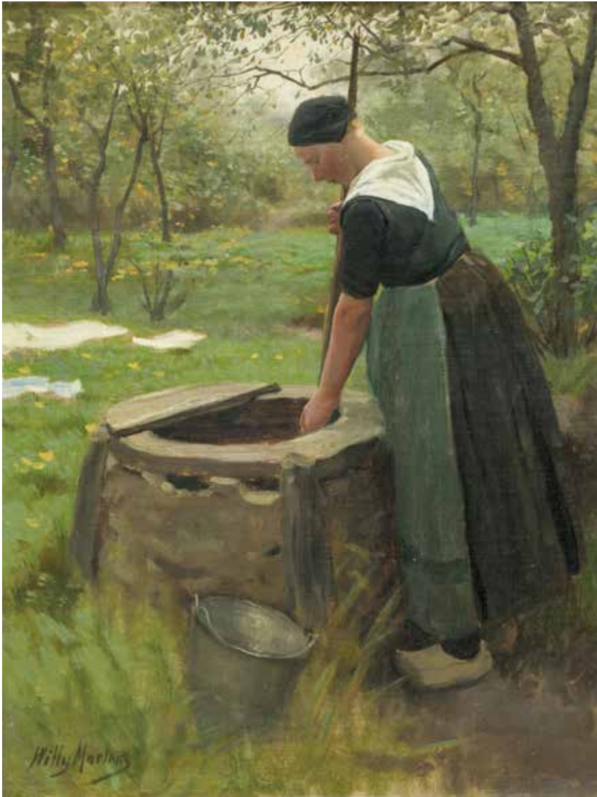
Willy Martens, Boerenvrouw bij waterput , ongedateerd. Olieverf op doek, 50 x 40 cm. Collectie Noord-Veluws Museum

> Willy Martens, Twee jonge vrouwen uit Vierhouten , ongedateerd. Olieverf op doek, 125 x 85 cm. Collectie Museum Arnhem