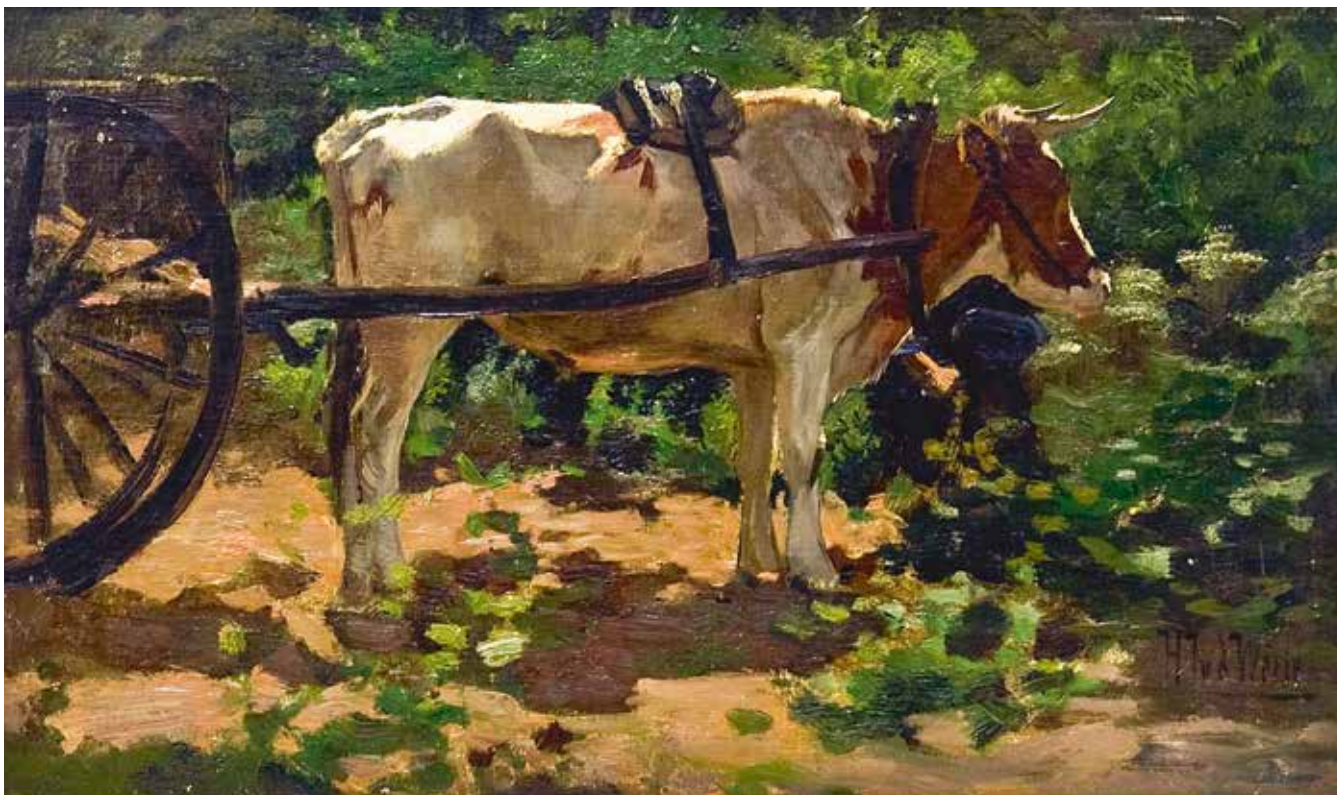
Herman van der Weele, Trekos voor een boerenkar op de Veluwe , ongedateerd. Olieverf op doek, 50 x 72 cm. Collectie CODA, Apeldoorn