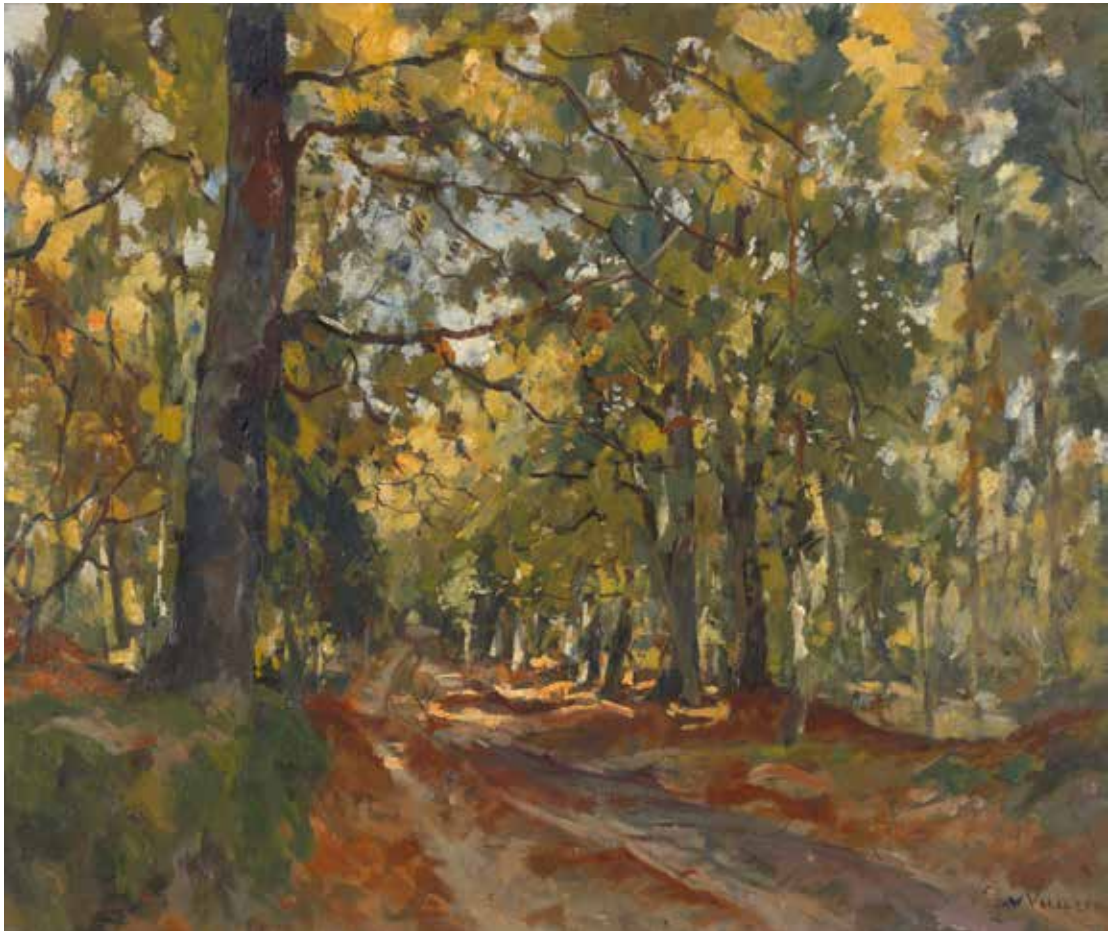
Jan van Vuuren , Bospad , ongedateerd. Olieverf op doek, 50,5 x 60,5 cm. Collectie Gemeente Nunspeet